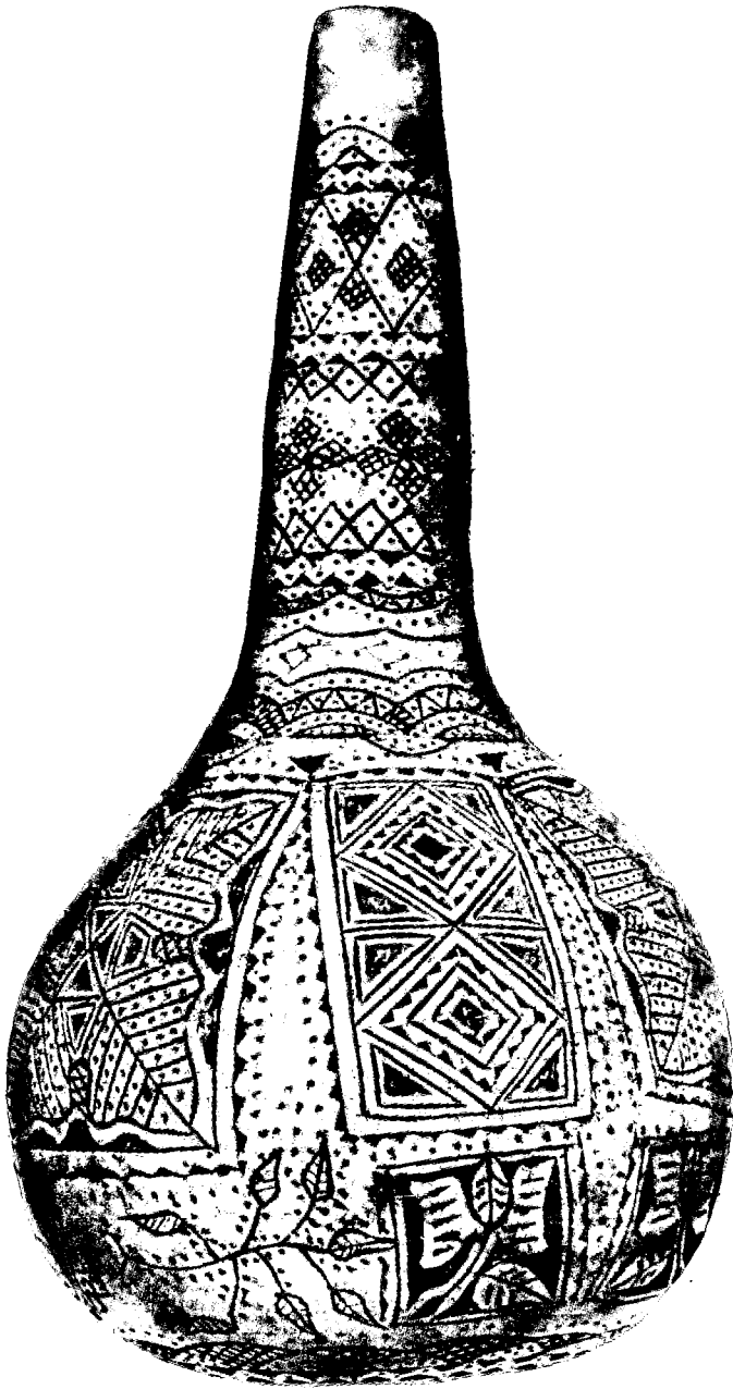
Rezbarena tikvica iz 1892. godine