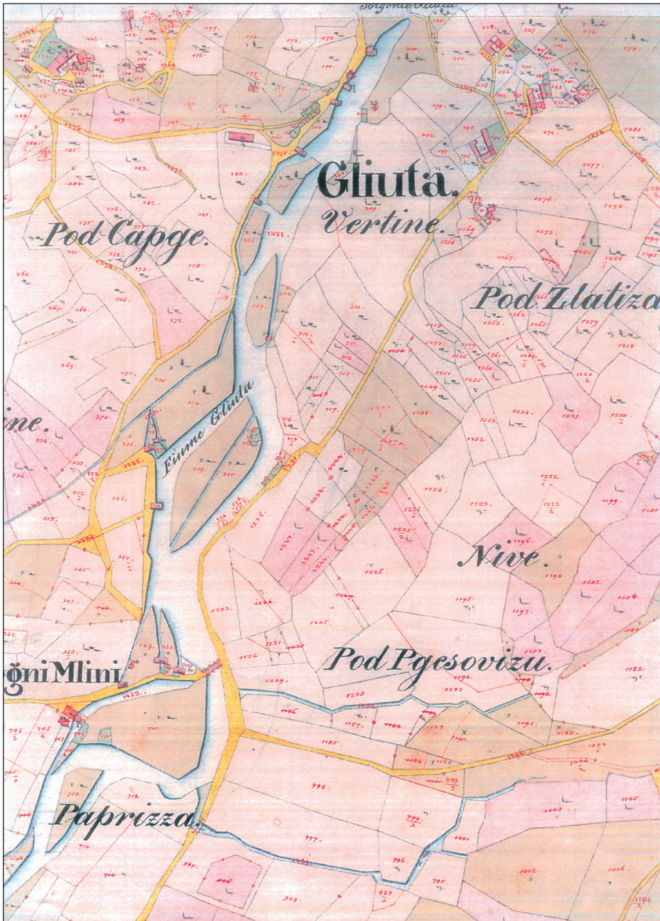
Slika 1. Rijeka Ljuta na katastru iz 1837. godine.