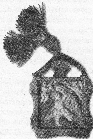
Slika 3: Tablica krojačkog ceha, Križevci, 18. st.