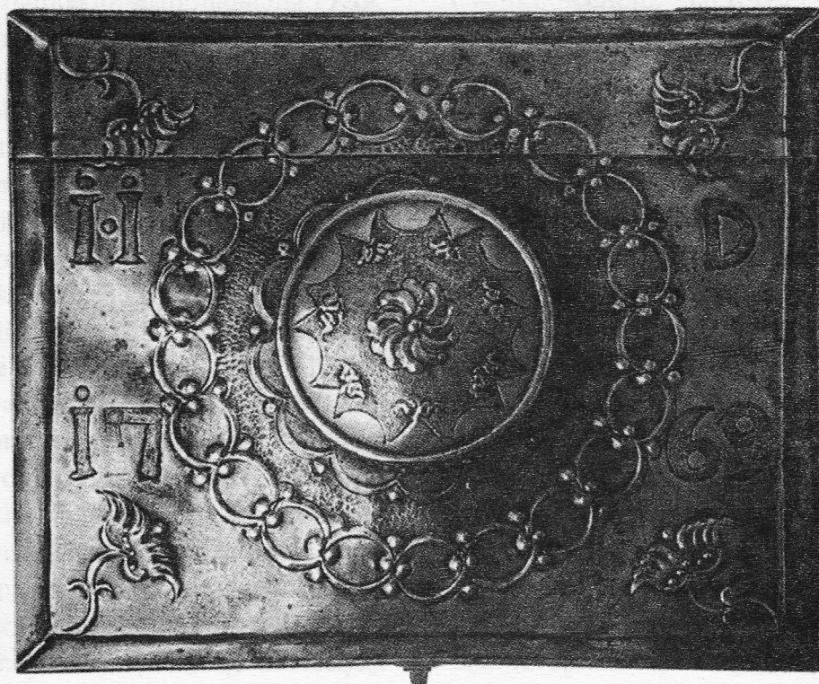
Metalne korice za cehovska pravila, Križevci, 1769. g.

ŠERCER, M. (1991): Stari zagrebački obrti (katalog izložbe), Zagreb.