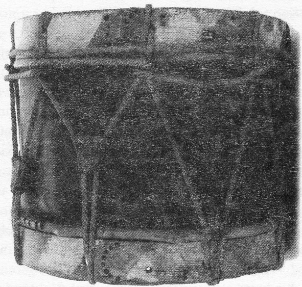
Bubanj seoske narodne straže (gibive čete) iz Visokog; izrađen iz bakrenog lima i napete kože

Hrvatski pokret 1848. g. koji u političkom pogledu završava hrvatsko-mađarskim vojnim sukobom u jesen iste godine, karakterizira otpor mađarskom nacionalizmu, ideje i pokušaji osamostaljenja u austroslavističkom duhu u okviru postojeće državnopravne zajednice — Habsburške Monarhije. Isčitavajući novinske članke i originalne povijesne dokumente koji se odnose na zbivanja u Križevačkoj županiji i “slobodnom kraljevskom gradu Križevcu” 1848. postajemo svjesni činjenice da su njihovi stanovnici aktivni sudionici političkih, društvenih i vojnih zbivanja. Njihovi sugrađani, posebice Ljudevit Vukotinović, Franjo Žigrović Pretočki, Mirko Bogović, Antun Nemčić te Matija Mrazović obnašatelji su značajnih državnih i upravnih funkcija, bliski suradnici bana Josipa Jelačića u stvaranju samostalne i cjelovite Hrvatske u sklopu federalistički uređene Habsburške Monarhije - “Austrije slobodnih naroda”.