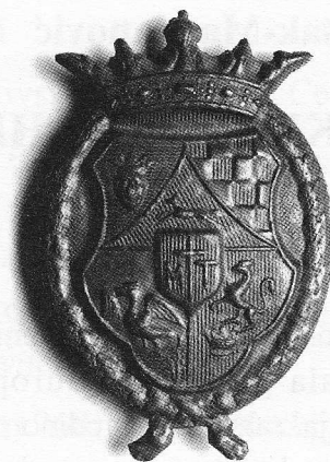
Slika 2: Oznaka s grbom Križevačke županije, prva pol. 19. st. Najvjerojatnije oznaka s čaka stražara Križevačke županije. U ovjenčanoj kartuši grb Križevačke županije koji je podijelila Marija Terezija 1759. g.