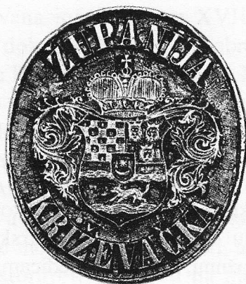
Slika 1: Pečatnjak Križevačke županije, Križevci, pol. 19. st.