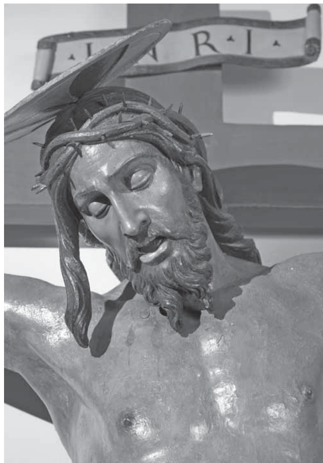
Andrea Fosco, Raspelo, Stari grad, crkva cv. Petra Mučenika, detalj torza

U tom smislu se uočava narav oblikovno bliskog odnosa prema drugome otočkom kipu istoga sadržaja, što vodi pretpostavci da oni u osnovi proistječu iz svjesnog variranja tipski zadanoga modela raspetoga Božjeg sina. Ustvare se razabire kako se na jednome htjelo i uspjelo predočiti završni trenutak Spasiteljeve trpnje uoči izdisaja, a na drugome nastup njegove fizičke smrti. Oba pak lika ne kriju predanost uvjetno starogrčkim kanonima ljepote s malom glavom i vitkim tijelom, što ide u prilog visokom obrazovanju umjetnika. Na djelu u Hvaru istaknuto je viđenje atleta koji se uzdiže visini kao svemoćni gospodar u crkvi sažetoga prostora svijeta te se čitav predaje u njoj prirodno rasutome svjetlu. Tome dosljedno, nad nogama okomito stisnutima, kako nalaže donji čavao skupivši im stopala, uz relativno uspravni torzo asimetrično raskriljene ruke podaju skulpturi dojam snage. Desna je pružena iz niže položenog ramena prema kojem se jedva naginje glava, pa je lice čitavo vidljivo iz prednjeg dijela prostorije te ispunjeno ozbiljnim izrazom dostojanstva. Lijevo je pak rame s čvršće istegnutom rukom ponešto iščašeno, ali ostaje snažno završavajući blagi luk što se preko frontalnoga, u masi punoga grudnog koša i površinski većega abdomena spušta k desnome boku. Na toj razini oko