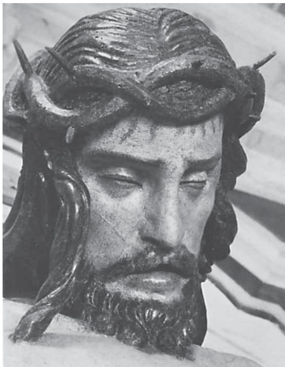
Andrea Fosco (potpisano), Raspelo, Latisana (Udine), crkva San Giovanni Battista, detalj (iz: A. Markham Schulz, Three Unknown Crucifixes by Andrea Fosco , u: Nuovi Studi , 14 (2008.)

Andrea Fosco (signed by), Crucifix, Latisana (Udine), church of San Giovanni Battista, a detail