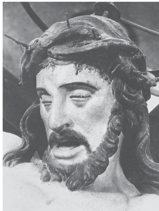
Andrea Fosco, Raspelo, Venecija, crkva Santi Giovanni e Paolo (iz: A. Markham Schulz, nav. djelo), detalj

Andrea Fosco (signed by), Crucifix, Latisana (Udine), church of San Giovanni Battista, a detail