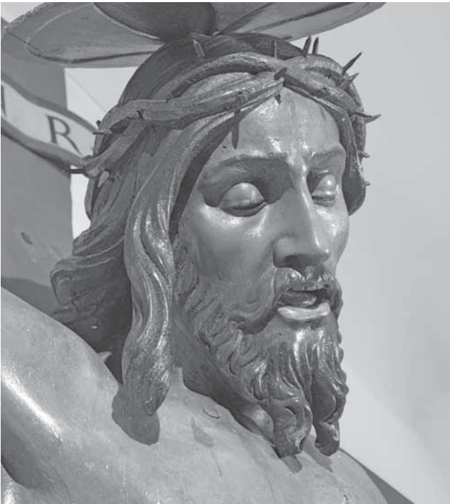
Andrea Fosco, Raspelo, Stari grad, crkva cv. Petra Mučenika, detalj

Andrea Fosco, Crucifix, Stari grad, church of St. Peter the Martyr, a detail