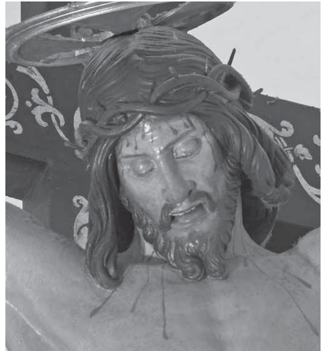
Andrea Fosco, Raspelo, Hvar, detalj

Andrea Fosco, Crucifix, Stari grad, church of St. Peter the Martyr, a detail