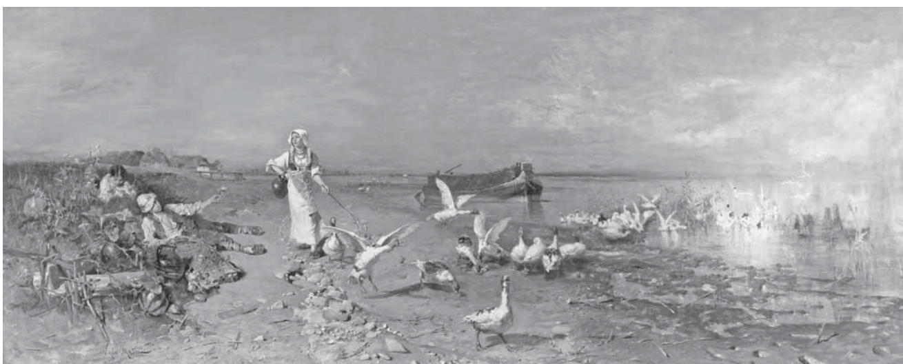
N. Mašić, Guščarica na Savi , 1880.–1881. N. Mašić, Goose-Girl by the Sava River , 1880