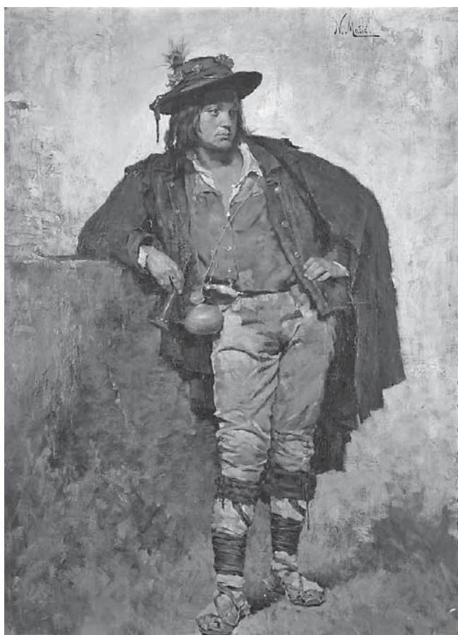
N. Mašić, Napuljski pastir , oko 1877.