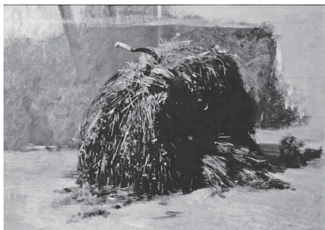
F. Palizzi, Fascio d'erba con falce , studija F. Palizzi, Fascio d'erba con falce , study

Cava (1881.), do njege su doprla preko brata Giuseppea, a posebno je uz Francusku bila vezana Scuola di Resina , koja je predstavljala i most između firentinskih Macchiaioli i napuljske tradicije pejzažizma, vedutizma i naturalizma, koja svoje modernije korijene u lokalnoj tradiciji nasljeđuje od posilipanske škole. Ne treba, stoga, čuditi da je upravo Napulj predstavljao točku u kojoj je Mašić mogao intuitivno pronaći naslućene odgovore na svoja osobna traženja. Pođemo li od socijalno-gospodarske krize, iscrpljenosti završenom revolucijom te dekadentnim ozračjem Mezzogiorna , možemo uočiti višestruke paralele s kriznom situacijom u Mašićevoj domovini, posebno u njezinu krajiškom dijelu, koji je njegov primarni zavičaj, opustošen previranjima, ratovanjima i traženjima. 29 Kada je o slikarstvu riječ, opisanu napuljsku situaciju na razmeđu akademizama i modernijeg poimanja slikarstva u smjeru plenerizma i mrljastog poteza, nije moguće definirati bez priznavanja difuznog prelijevanja granica i kontinuirane komunikacije svih protagonista, ma koliko se u prvi tren činili na oprečnim pozicijama, u potrazi koja je, u konačnici, zajednička. Uzmemo li u obzir različite tendencije unutar slikarstva europskog i posebice talijanskog ottocenta te činjenicu da su akademizam, akademski žanrovi i Akademija bili njegovo osnovno polazište, ne treba nas čuditi ni dihotomija između akademizma i težnje k modernijem