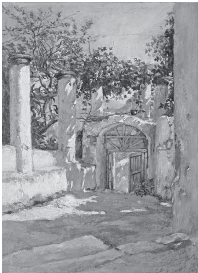
N. Mašić, Pergola , 1880. N. Mašić, Pergola , 1880