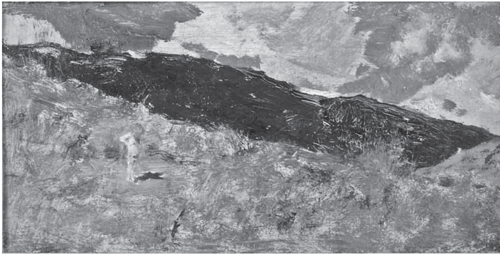
M. J. M. Fortuny y Marsal, studija M. J. M. Fortuny y Marsal, study

mahom malenih studija), ali i nepretencioznosti prikaza života puka (kojima će se vratiti nakon povratka iz Italije, uglavnom na način umrtvljenog akademizma). Njegova je Italija bila »postgeteovska« te »minhenska predimpresionistička Italija« te njegovo putovanje, kako se izrazio Peić, stoga nije bilo »historijsko«, već »biološko«. 48 Capri mu je pružio ono za čim je, prema Peiću, traga u Posavini, »vidik samo od vode i neba«. 49 Kao temelj Mašićeva najboljeg dijela opusa stvaranog za ovih posavskih i talijanskih boravaka, Peić će više puta isticati stenografiju njegova crtačkog zapisa, Mašićev »biološki talijanizam« i »naslućeni japanizam«. 50