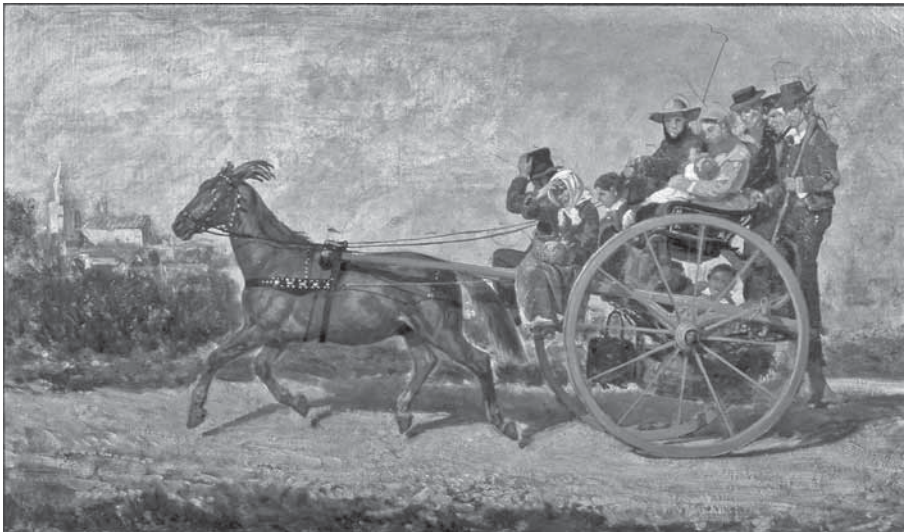
F. Palizzi, Antico curriculum napoletano , studija

F. Palizzi, Antico curriculum napoletano, study