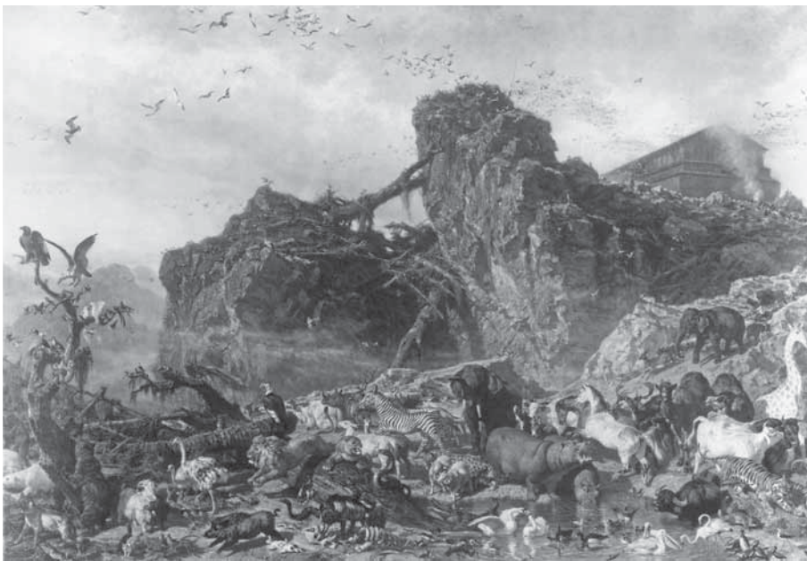
F. Palizzi, Dopo il diluvio , 1863 c

F. Palizzi, Antico curriculum napoletano, study