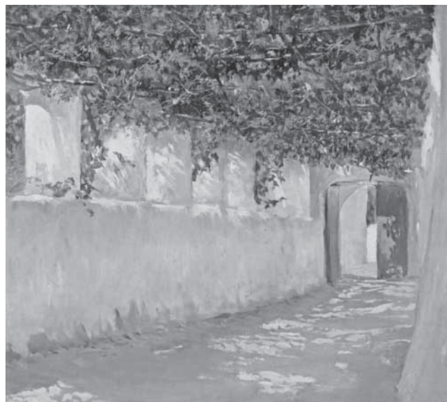
N. Mašić, Pergola II (Capri), 1880. N. Mašić, Pergola II (Capri), 1880