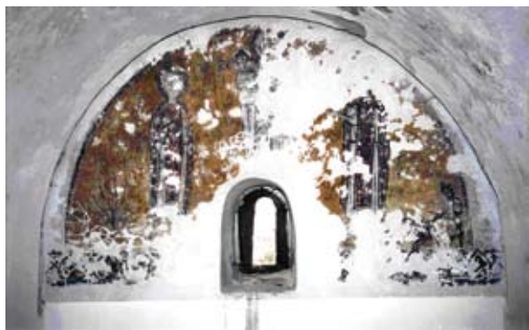
Sl. 1 Sveti Juraj na fresci. Crkva Gospe Srimске, Srma