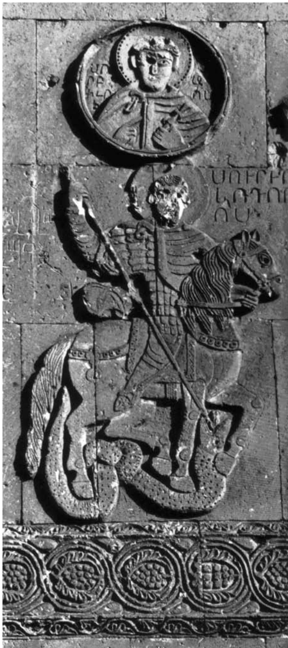
Sl. 3 Sveti Juraj ubija zmaja. Reljef na crkvi u Akhtamaru, 916. – 921. god. (preuzeto iz: Ipsiroglu 1963, str. 125)

X. stoljeća nalazimo u umjetnosti prizore kako sveti Juraj ubija zmaja. 52 Najstariji reljef sv. Jurja koji ubija zmaja sačuvan je na crkvi u Akhtamaru (Armenija), nastao je od 916. do 921 godine, 53 što upućuje na mogućnost da je taj motiv na Istoku mogao biti poznat i stoljećima ranije.