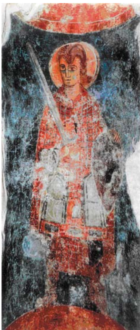
Sl. 2 Sveti Juraj na fresci. Crkva sv. Mihajla, Ston

sa svijetlim mačem i štitom, mladolik, rastvorenih očiju. 44