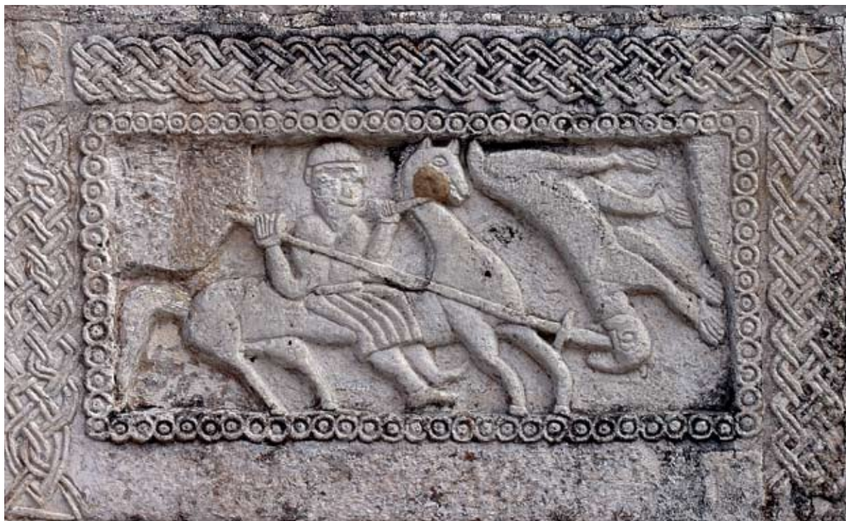
Sl. 4 Sveti Juraj ubija zmaja. Reljef na crkvi u Žrnovnici