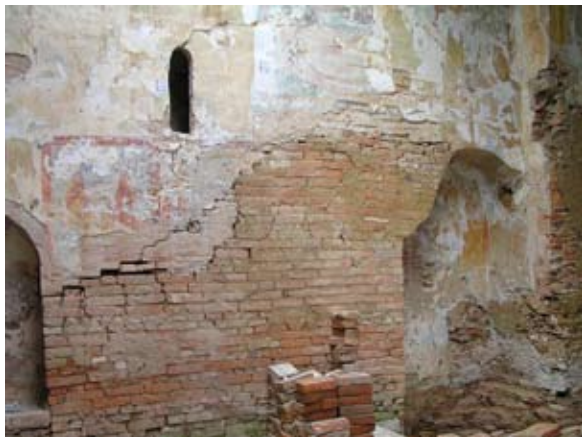
Sl. 11. Secco oslik na sjevernom zidu, odnosno zidu stubišta za emporu