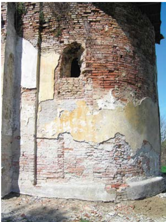
Sl. 7. Južni romanički prozor svetišta te tragovi otklesanog niza slijepih arkada ili lezena

pronađeni elementi podnožja u romaničkom sloju crkve te se može pretpostaviti da podnožje tada nije bilo ni izvedeno. 20