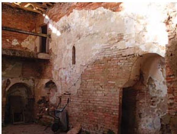
Sl. 10. Sjeverni zid – stubište na emporu – te današnji kor na zapadnom zidu

spoznajama, ponajviše bilo definirano fresko-ciklusom koji se protezao cijelim svetištem te čeonom stranom trijumfalnog luka, brodom romaničke crkve dominirala je 'gospodska' empora na zapadnom zidu, do koje je vodilo i danas sačuvano usko stubište na sjevernom zidu broda crkve (sl. 9 i 10). 28 Na osnovi otkrića temelja stupaca što su nosili emporu, kao i naknadno otklesanog pojačanja južnog zida broda crkve, pretpostavljena su četiri moguća tipa empure: empora što se pružala samo duž zapadnog zida, empora što se pružala cijelom dužinom broda – u kojem slučaju bi se radilo o dvojnoj crkvi – potkovičasti tip empure te tip empure u obliku slova L . 29