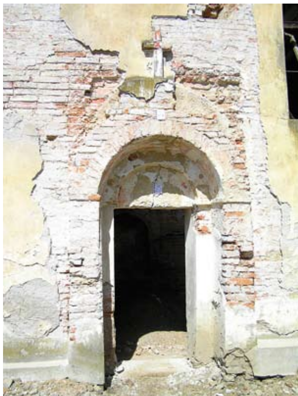
Sl. 5. Južni portal