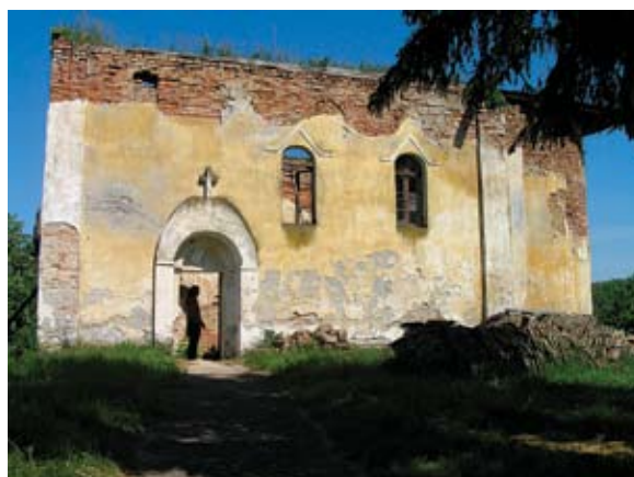
Sl. 2. Crkva Rođenja Presvete Bogorodice nakon stradanja u Domovinskom ratu