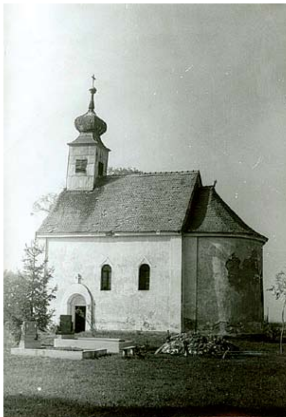
Sl. 1. Izgled crkve Rođenja Presvete Bogorodice nakon obnove, 1969. g.

U unutrašnjosti crkve, definirane brodom nadsvođenim drvenom bačvom te svetištem sa zidanom polu-