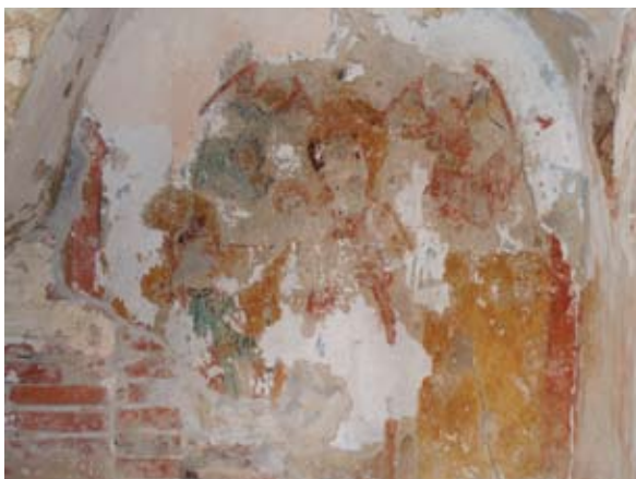
Sl. 13. Detalj secco oslika – sv. Marija s Kristom u naručju

Do prve graditeljske intervencije u romanički korpus građevine došlo je, smatram, već u gotici: istražnim radovima ustanovljena je jedino izmjena, odnosno proširenje izvornog ulaza na stubište za emporu te novi, secco oslik na unutrašnjem zidu stubišta, izveden na vapnenoj žbuci krupne granulacije i grube teksture (sl. 11). Kompozicija oslika djelomično je sačuvana, najviše radi naknadnih izmjena donjeg dijela zida stubišta. Ciklus oslika bio je podijeljen unutar kvadratnih polja izvedenih crvenom linijom. Koliko se može razaznati prema sačuvanim fragmentima, pravokutna su polja bila izvedena u dva reda. U donjem redu, idući s lijeva nadesno, niže se prikaz arhanđela Mihaela u jednom polju, zatim prikaz zasad nepoznatog lika (sl. 12). 33 U gornjem redu sačuvan je fragment prikaza sv. Jurja