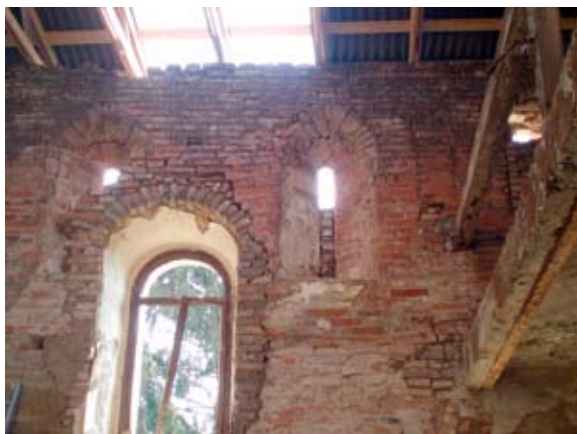
Sl. 4. Romanički prozori broda crkve te, između njih, naknadno probijen barokni prozor

2008. postavljena je privremena i provizorna krovna konstrukcija, a 2009. nastavljeni su istražni radovi, kojima se htjela ustanoviti povijesno–stilska slojevitost crkve. 13