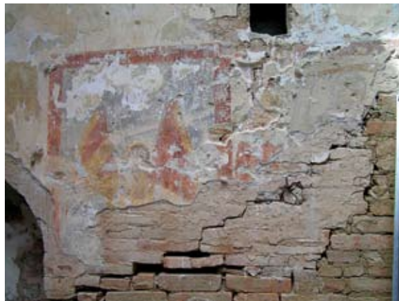
Sl. 12. Detalj secco oslika – sv. Mihael te prikaz nepoznatog lika

Pitanje oblikovanja, porijekla te tipologije gospodske ili zapadne empole obrađeno je u stručnoj literaturi. 30 Sukladno tome, zapadnu ili gospodsku emporu u