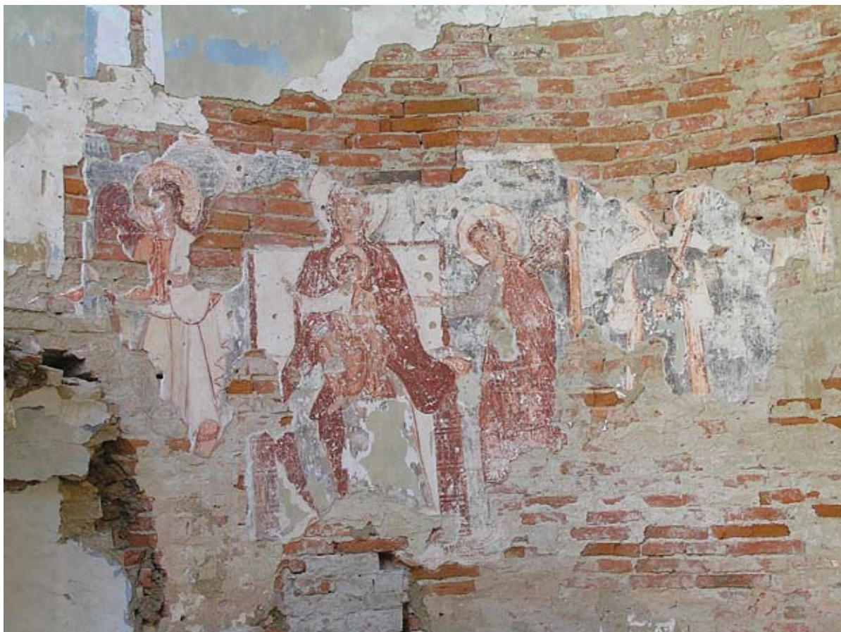
Sl. 8. Freske u svetištu

Unutrašnjost romaničke crkve oblikovao je brod gotovo kvadratna oblika, s emporom na zapadnom zidu, te svetište, od broda odijeljeno trijumfalnim lukom. Zemljanim sondama utvrđeno je naknadno proširenje trijumfalnog luka – izvedeno prilikom barokizacije crkve – te se može samo pretpostaviti da je izvorni trijumfalni luk bio polukružna oblika.