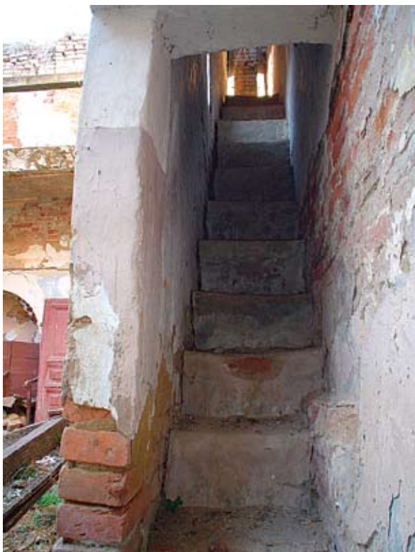
Sl. 9. Stubište u sjevernom zidu, nekoć je vodilo na gospodsku emporu

slova i brojke (vjerojatno godine). Zbog oštećenja freske grafizmi se tek djelomično mogu pročitati: nazire se latinska riječ maneat i nominis te brojke 7 i 8. 26 Analizirajući stilske elemente i dominantne pigmente, mišljenja sam kako su fragmenti u svetištu i oni u luneti portala istovremeni: odlikuje ih prikazivanje bočnih likova u poluprofilu te upotreba crvenog, oker i plavog pigmenta (nažalost, fragment u luneti portala znatno je oštećen te je nemoguće obaviti daljnje analize ili komparacije). 27