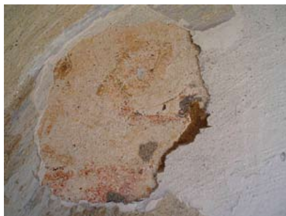
Sl. 6. Fragment freske u luneti portala

portala ustanovljeno je da je portal izveden prema na-