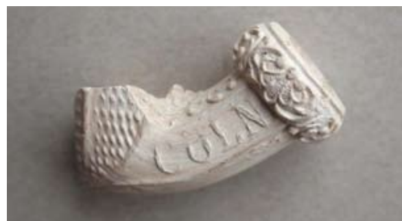
Sl. 43, 43a Ulomak lule s natpisom Cöln / Cafe

Sl. 44, 44a – P.P.D. = 1,5 cm; U.P.T. = 1,15 cm; D.S.Č. = 0,35 cm; N.S.V. = 4,05 cm. Glina narančaste boje premazana glazurom; sačuvan dio čašice; obruč na-