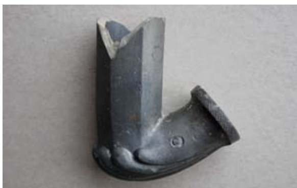
Sl. 4, 4a Ulomak lule tipa Schemnitz

= 0,32 cm; N.S.V. = 6,4 cm. Glina sive boje, crnopečena; sačuvan veći dio osmerokutne čašice; greben u obliku lista ili školjke; obruč prstenasto naglašen i ukrašen motivom rombova ispunjenih točkama; na tuljcu pravokutni pečat s natpisom B...IM / S...NITZ (BETTELHEIM SCHEMNITZ ?), s jedne strane, s druge mali kružni pečat s prikazom koji nije sasvim jasan; možda se radi o prikazu kao kod prethodnog primjerka, tj. o vazi s cvijećem (?); jedna vezna rupa kroz stijenku čašice; lula izrađena u kalupu.