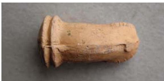
Sl. 76 Ulomak zelovskog tipa lule

Po sredini obruča tuljca postoji kanalić koji je služio za umetanje žice kojom se zatvarao poklopac na tuljcu. Poklopac se može nalaziti i na rubu čašice, a svrha im je bila sprječavanje prosipanja duhana. 120 Analogije za oblik tuljca nalazimo na primjerima s rta Sustipana 121 te iz Zelova i Garduna, 122 koji su bolje sačuvani od našeg ulomka. Osim na navedenim lokalitetima, lule ovog tipa pronađene su u Livnu te u Makarskoj. 123 Zelovski ulomak možemo datirati u 18. ili 19. stoljeće.