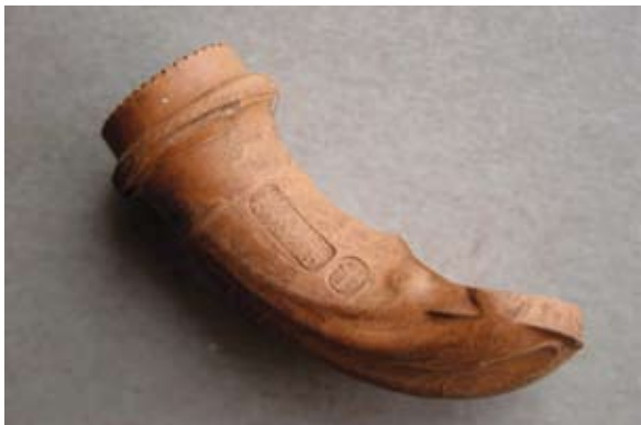
Sl. 38 Ulomak lule s natpisom Philipp / Konrad

je poznato da je djelovala u Theresienfeldu u Austriji i proizvodila keramičke lule od 1838. godine. 78