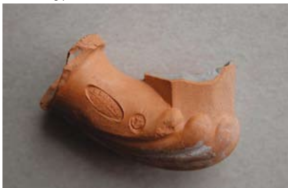
Sl. 20 Ulomak lule s natpisom Leopold / Gross

Kao i prethodna dva primjera (sl. 18, 19) i ovu lulu datiramo u 18. st. ili početak 19. stoljeća te uzimamo iste analogije za formu.