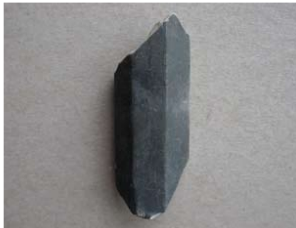
Sl. 10 Ulomak lule tipa Schemnitz

kao kod primjeraka na sl. 3–8. Vjerojatno pripada prvoj polovici 19. stoljeća.