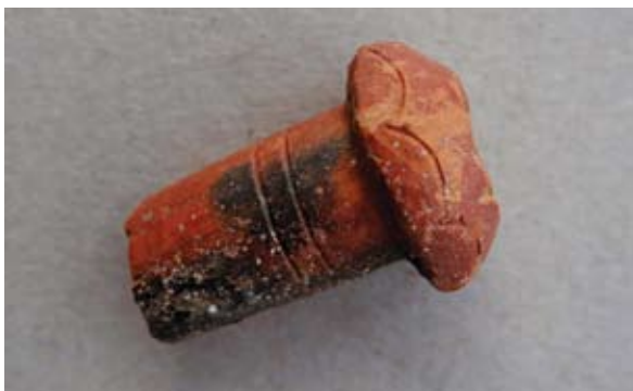
Sl. 67 Ulomak turskog tipa lule

Komparativni primjeri su kao kod sl. 64, lula se datira u drugu polovicu 19. stoljeća.