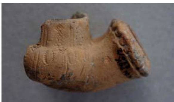
Sl. 56 Ulomak turskog tipa lule

Bugarski primjerci 96 te nalaz s atenske Agore 97 vrlo su dobre analogije za ovaj ulomak. Datira se u 19. stoljeće.