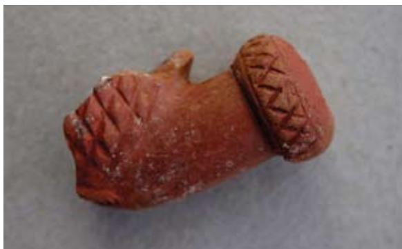
Sl. 63 Ulomak turskog tipa lule

Vrlo slično je ukrašena čašica na korintskom primjerku koji se datira u 19. stoljeće. 101