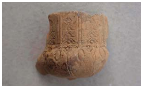
Sl. 57 Ulomak turskog tipa lule

Za ovaj ulomak možemo primijeniti iste analogije kao i za prethodni primjerak (sl. 56) i datirati ga u 19. stoljeće.