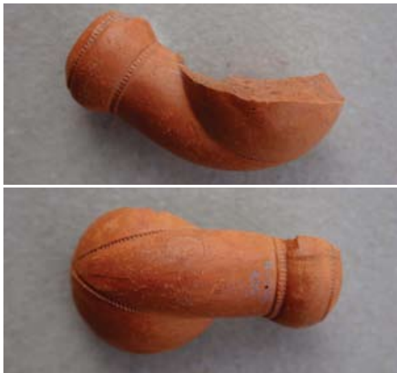
Sl. 49, 49a Ulomak turskog tipa lule

Paralelu nalazimo u jednom grčkom primjerku koji se datira u kasno 18. ili 19. stoljeće, 90 no razlikuju se u završetku obruča tuljca.