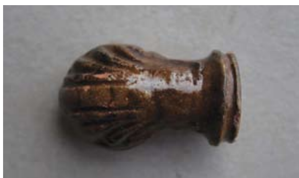
Sl. 52, 52a Turski tip lule s glazurom

Sl. 53, 53a – P.P.D. = 1,9 cm; U.P.T. = oko 1 cm; D.S.Č. = 0,3–0,6 cm; N.S.V. = 2,5 cm. Glina krembijele boje; tuljac sačuvan samo na početnom dijelu gdje se spaja s čašicom; čašica ukrašena vertikalnim urezima kojima je postignut rebrasti ukras; greben V-oblika; jedna vezna rupa kroz stijenkicu čašice; lula rađena u kalupu.