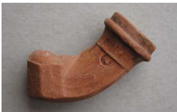
Sl. 13, 13a Ulomak lule tipa Schemnitz

Sl. 14 – U.P.T. = 1,3 cm. Glina crvenonarančaste boje; nije sačuvana čašica; obruč naglašen prstenom ukrašenim gustim kosim paralelnim linijama; na sačuvanom dijelu tuljca pravokutni pečat s natpisom HÖNIG WE / SCHEMNITZ, ispod pečata po sredini otisnut mali pečat sa zvjezdicom; s druge strane lule mali pečat u obliku medaljona s portretom; s donje strane tuljca dio lisnatog motiva; jedna vezna rupa kroz stijenku čašice; lula izrađena u kalupu.