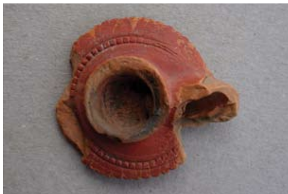
Sl. 73, 73a Ulomak turskog tipa lule s diskastom bazom

Sl. 74 – U.P.T. = 1,2 cm. Glina crvenonarančaste boje; tuljac se lagano širi od baze prema djelomično sačuvanom završnom dijelu koji je ukrašen dvjema kružnim linijama otisnutim nazubljenim kotačićem; lula rađena u kalupu.