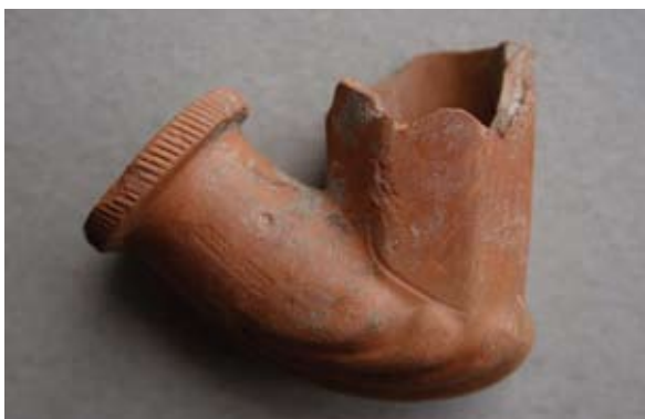
Sl. 12, 12a Ulomak lule tipa Schemnitz

Sl. 12, 12a – P.P.D. = 2 cm; U.P.T. = 1,34 cm; D.S.Č. = 0,25–0,44 cm; N.S.V. = 4,5 cm. Glina crvenonarančaste boje; sačuvan dio osmerokutne čašice; greben u obliku lista ili školjke; obruč naglašen prstenom s gusto urezanim kosim paralelnim linijama; na tuljcu pravokutni pečat s natpisom ...HONIG... / (M.HONIG... / SCHEMNITZ); s druge strane lule mali kružni pečat s prikazom točke (?); jedna vezna rupa kroz stijenku čašice; lula izrađena u kalupu.