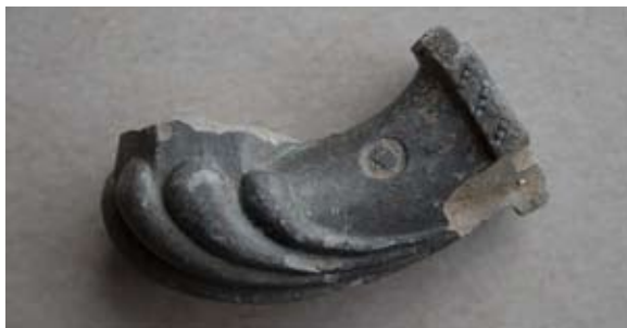
Sl. 7, 7a Ulomak lule tipa Schemnitz

Sl. 8, 8a – P.P.D. = 1,7 cm; U.P.T. = 1,4 cm; D.S.Č. = 0,3 cm; N.S.V. = 3,4 cm. Glina sive boje, crnopečna; sačuvan mali dio osmerokutne čašice; greben u obliku lista ili školjke; obruč prstenasto naglašen, ukrašen motivom kosih paralelnih crtica; na tuljcu se nalazi izduljeni pravokutni pečat s natpisom HONIG WE. / SCHEMNITZ; s druge strane tuljca mali pečat ispunjen portretom; 55 jedna vezna rupa kroz stijenku čašice; lula izrađena u kalupu.