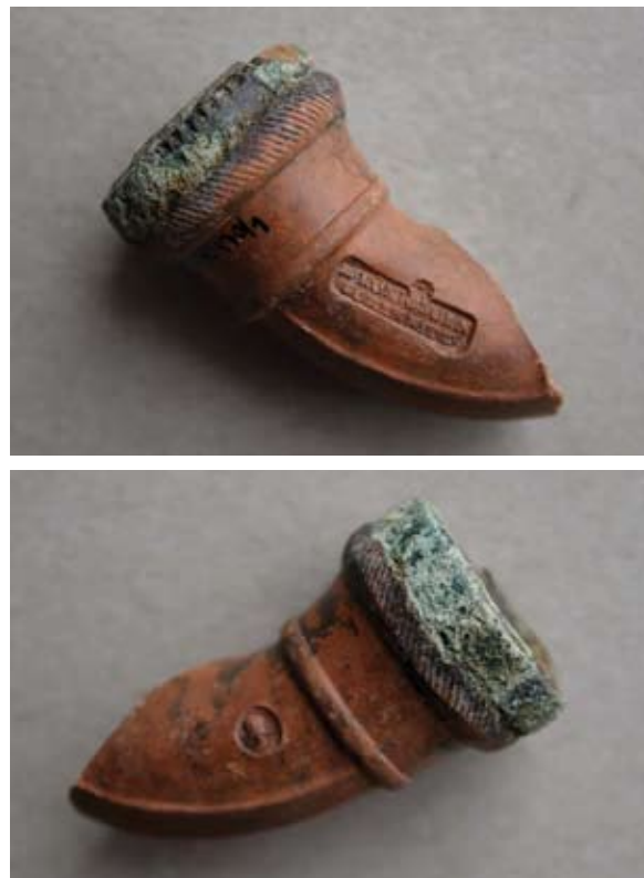
Sl. 15, 15a Ulomak lule tipa Schemnitz