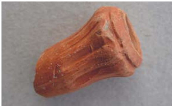
Sl. 69 Ulomak turskog tipa lule

Sličan primjer tuljca, samo izrađen od svijetle oker gline, pronađen je u podvodnom istraživanju lučice Matejuške u Splitu. Ovaj tip tuljca mogao je pripadati lulama s vrećastom čašicom ili bazom u obliku diska, a može se datirati u 19. stoljeće. 106 Analogne primjere nalazimo među bugarskim 107 i splitskim 108 nalazima.