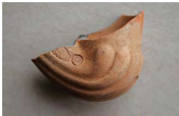
Sl. 22 Ulomak lule s natpisom Leopold / Gross

Sl. 21 – U.P.T. = 1,4 cm; D.S.Č. = 0,3 cm; N.S.V. = 2,5 cm. Glina narančaste boje, presjek sivi; nedostaje čašica; greben u obliku lista ili školjke; obruč naglašen prstenom koji je ukrašen tankim dvostrukim paralelnim linijama; na tuljcu dva pečata od kojih je jedan ovalni s natpisom LEOPOLD / GROSS, a drugi kružni s prikazom sidra; jedna vezna rupa kroz stijenku čašice; lula izrađena u kalupu.