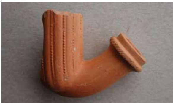
Sl. 39 Ulomak austrijsko–mađarskog tipa lule

Budući da na ovoj luli nije otisnut pečat, teško je reći kojoj je radionici pripadala. Ukrašen i oblikom razlikuje se od navedenih primjera, no svakako pripada austrijsko–mađarskom radioničkom krugu, a mogla bi se datirati u 18. ili 19. stoljeće. 79