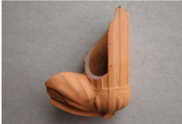
Sl. 27 Ulomak lule s natpisom Leopold / Gross

Kao i prethodni primjeri (sl. 18–26) datira se u 18. st. ili početak 19. stoljeća.