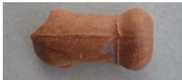
Sl. 51 Ulomak turskog tipa lule

U literaturi ne nalazimo blisku analogiju. Moguće je da pripada 18. ili 19. stoljeću.