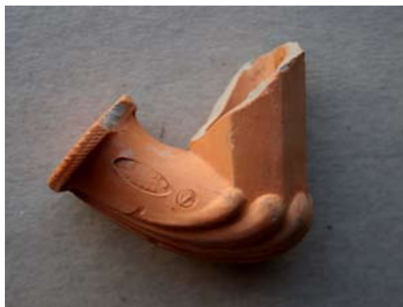
Sl. 18 Ulomak lule s natpisom Leopold / Gross

Ulomak lule s gotovo cijelim ovalnim pečatom radionice Leopolda Grossa pronađen je u Sinju, a datira se u 18. st. ili sam početak 19. stoljeća. 67 Radionica L. Grossa pripada lularskim krugovima središnje Europe, no njezin točan smještaj nije poznat. 68 Slične primjere po formi čašice, tuljca i grebena nalazimo kod lula tipa Schemnitz, tj. možemo primijeniti komparativne primjere navedene kod sl. 12, samo što su lule iz te radionice načinjene od tamnije narančaste gline. Na lulama iz radionice Leopolda Grossa pečati su na tuljcu otisnuti jedan do drugoga, dok lule tipa Schemnitz imaju pečate raspoređene na obje strane.