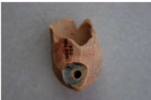
Sl. 46, 46a Ulomak turskog tipa lule

Sl. 47, 47a – U.P.T. = 1 cm; D.S.Č. = 0,3–0,5 cm; N.S.V. = 2,4 cm. Glina narančaste boje; sačuvan mali dio čašice ukrašen trokutom ispunjenim mrežastim motivom; na jednom dijelu vidljiv završetak jednako ukrašenog trokuta; sačuvan prstenom naglašen obruč; greben naznačen V–linijom; jedna vezna rupa kroz stijenku čašice; lula rađena u kalupu.