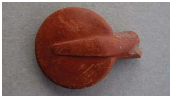
Sl. 72, 72a Ulomak turskog tipa lule s diskastom bazom

Sl. 73, 73a – U.P.T. = 1,3 cm; D.S.Č. = 0,25–0,5 cm; N.S.V. = 1,74 cm. Glina crvenonarančaste boje; sačuvana diskasta baza s dijelom tuljca; rub diska nazubljen; na gornjoj strani diska izvedene tri koncentrične kružne trake, od kojih su dvije rubne ispunjene tankim gustim kosim crticama, a središnja malim reljefno izvedenim kvadratićima; s donje strane baze izvedena je reljefna istaka, koja se spaja s tuljcem; jedna vezna rupa kroz stijenku čašice; lula rađena u kalupu; ostatci premaza.