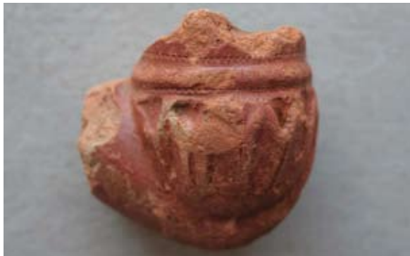
Sl. 55 Ulomak turskog tipa lule

Sličan primjerak nalazimo u Bugarskoj. 94 Postoji širi repertoar lula s čašicom u obliku cvijeta, pojavljuju se begonija, perunika, zvončić, krizantema (zatvorena), ružin pupoljak te razni oblici narcisa. Stančeva smatra da je majstor simbolički povezoao miris duhana s ugodnim mirisom cvijeća. 95 Ova lula vjerojatno pripada 19. stoljeću.