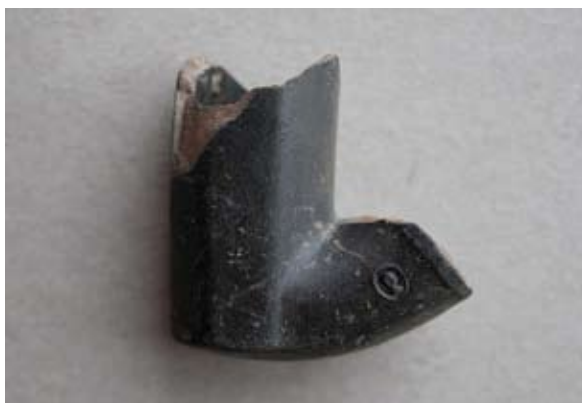
Sl. 9 Ulomak lule tipa Schemnitz

Pripada lulama tipa Schemnitz, a budući da joj greben nije u obliku lista ili školjke kao kod prethodno opisanih primjeraka izrađenih od crne gline, najbliža morfološka paralela bi joj bio jedan rovinjski primjerak, samo što je on izrađen od narančaste gline i ima natpis Honigove radionice iz Schemnitza. 56 Ovu lulu mogli bismo datirati u prvu polovicu 19. stoljeća.