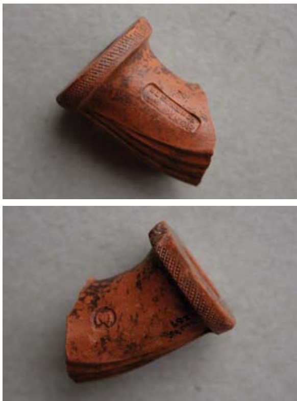
Sl. 14, 14a Ulomak lule tipa Schemnitz

Sl. 15 – U.P.T. = 1,4 cm. Glina crvenonarančaste boje; nije sačuvana čašica; obruč naglašen prstenom na kojem su gusto urezane kose paralelne linije; na obruču ostatak metala; na sačuvanom dijelu tuljca pravokutni pečat s natpisom M.HÖNIGSOHN / SCHEMNITZ, s gornje strane ovog pečata po sredini urezan cvijet; s druge strane lule mali pečat s portretom; jedna vezna rupa kroz stijenku čašice; lula izrađena u kalupu.