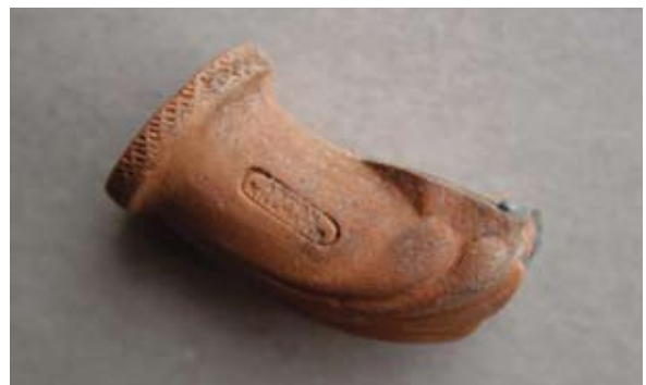
Sl. 37 Ulomak lule s natpisom Anton / Killmayer (?)

Ovo je jedini primjerak s natpisom te radionice, oblikom podsjeća na primjere lula tipa Schemnitz ili L. Gross. Vjerojatno pripada 18. ili 19. stoljeću.