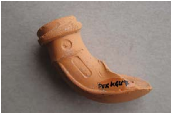
Sl. 35 Ulomak lule s natpisom Wolf / Halphen

Ovome primjerku nije sačuvana čašica, no budući da se njezina baza sasvim neznatno sačuvala, nazire se poligonalan presjek. Najbliže analogije po obliku bili bi nalazi iz podmorja Šolte 75 i Rovinja, 76 dakle kao kod sl. 25, 31, 32. Natpis ove radionice do sada nije pronađen na lulama u Hrvatskoj. Ne znamo gdje je djelovala radionica Wolfa Halphena, zasigurno pripada srednjoeuropskom radioničkom krugu, a vjerojatno je djelovala u 18. ili 19. stoljeću.