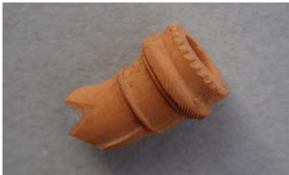
Sl. 42 Ulomak austrijsko-mađarskog tipa lule

Sl. 43, 43a – P.P.D. = 1,55 cm; U.P.T. = 1,44 cm; D.S.Č. = 0,35–0,5 cm; N.S.V. = 2,2 cm. Glina bijele boje; sačuvan vrlo mali dio čašice šesterokutnog presjeka ukrašene reljefnim crticama; obruč naglašen prstenom s reljefno izvedenim biljnim motivima; na tuljcu s jedne strane natpis CÖLN, a s druge CAFE te biljni vitičasti motivi reljefno izvedeni; jedna vezna rupa kroz stijenkku čašice; lula izrađena u kalupu.