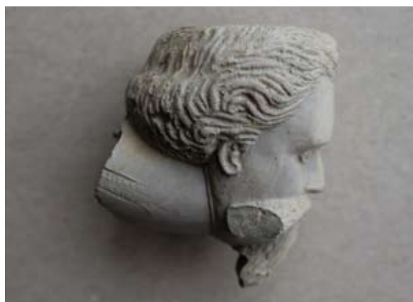
Sl. 11, 11a Ulomak lule tipa Schemnitz