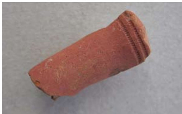
Sl. 74 Ulomak turskog tipa lule

Sličan je oblik i ukras tuljca na grčkom primjerku s diskastom bazom koji donosi R. Robinson, 116 a datira ga u kasno 19. ili rano 20. stoljeće.