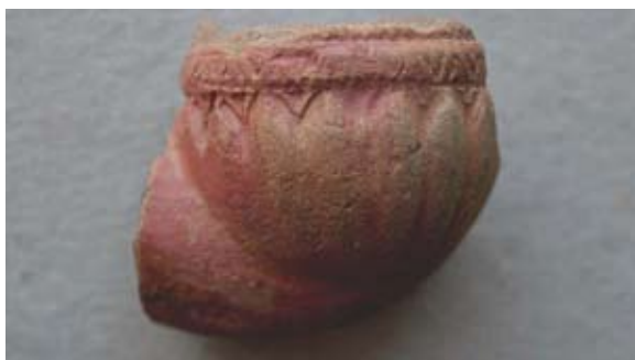
Sl. 54 Ulomak turskog tipa lule

R. Robinson donosi veći broj primjeraka lula s čašicom u obliku cvijeta, koje datira u 18. ili 19. stoljeće, 93 no ti se primjerci ne podudaraju u potpunosti s našim nalazom.