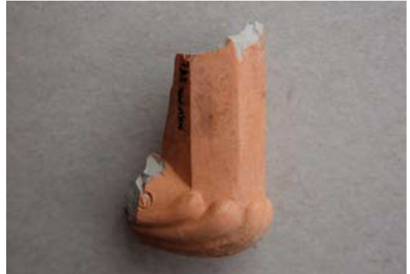
Sl. 29 Ulomak lule austrijsko–mađarskog tipa.

ime radionice, nego mali, s prikazom sidra. Budući da lule iz radionice Leopolda Grossa pored ovalnog pečata imaju i mali pečat sa sidrom, moguće je da se radi o produkciji te radionice ili neke iz istoga kruga. Datira se, kao i prethodni primjeri (sl. 18–28) u 18. st. ili sam početak 19. stoljeća, a morfološke paralele bi bile kao navedene kod sl. 18.