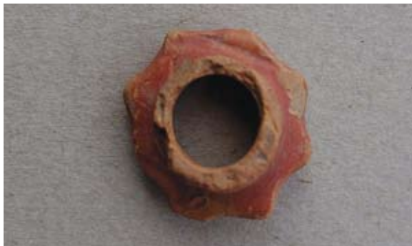
Sl. 68 Ulomak turskog tipa lule

Analogni primjeri su kao kod sl. 64, lula se datira u drugu polovicu 19. stoljeća.