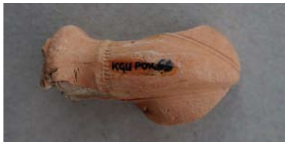
Sl. 47, 47a Ulomak turskog tipa lule

Sl. 48, 48a – P.P.D. = 2,5 cm; U.P.T. = 1,3–1,45 cm; D.S.Č. = 0,3 cm; N.S.V. = 3,06 cm. Glina narančaste boje; čašica dijelom sačuvana, ukrašena paralelnim vertikalnim linijama otisnutim nazubljenim kotačićem; obruč zadebljan te s obje strane omeđen linijama ispunjenim urezima crtica; greben naznačen V–linijom ispunjenom otiskom kotačića; na tuljcu mali kružni pečat; jedna vezna rupa kroz stijenku čašice; lula rađena u kalupu.