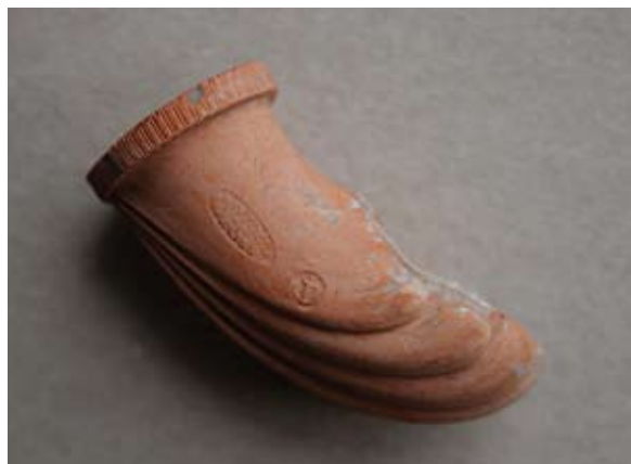
Sl. 21 Ulomak lule s natpisom Leopold / Gross