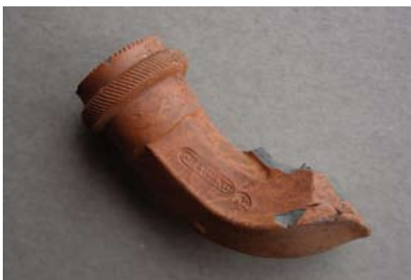
Sl. 32 Ulomak lule s natpisom GWeigand

Sl. 32 – U.P.T. = 1,3 cm; D.S.Č. = 0,3 cm; N.S.V. = 2,2 cm. Glina narančaste boje; čašica nije sačuvana, vidljiv dio njezine osmerokutne baze; obruč naglašen prstenom ukrašenim koso izvedenim paralelnim linijama; na tuljcu dva pečata od kojih je jedan pravokutni s natpisom GWEIGAND, a drugi mali kružni s prikazom cvijeta (?); jedna vezna rupa kroz stijenku čašice; lula izrađena u kalupu.