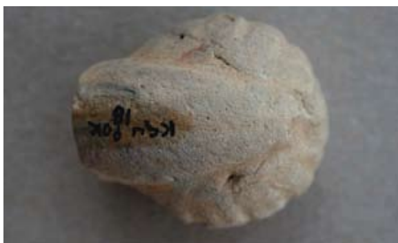
Sl. 53, 53a Ulomak turskog tipa lule

Sl. 54 – P.P.D. = 1,9 cm; D.S.Č. = 0,4–0,6 cm; N.S.V. = 2,7 cm. Glina crvenonarančaste boje; presjek sive boje; tuljac nije sačuvan; sačuvan dio čašice ukrašen blago naglašenim prstenom ispod koje je smješten laticasti reljefno istaknut ukras – cvjetna čaška sa zašiljenim laticama; greben naznačen V-linijom; lula rađena u kalupu; ostatci premaza.