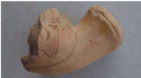
Sl. 58, 58a Ulomak turskog tipa lule

Sl. 59 – U.P.T. = 1,4 cm. Glina oker boje; nema sačuvanu čašicu, samo se nazire mali dio palmete koji je vjerojatno okruživao cijelu čašicu; s obje strane vidljiv manji dio V-linije otisnute kotačićem koja je ukrašavala greben; jedna vezna rupa kroz stijenku čašice; tuljac poligonalnog presjeka, na obruču postoji plitki kanalčić u koji se umetala žica koja je služila za zatvaranje poklopca na tuljcu; lula rađena u kalupu.