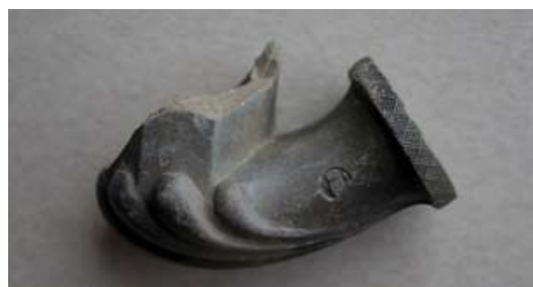
Sl. 6, 6a Ulomak lule tipa Schemnitz

Sl. 7, 7a – U.P.T. = 1,4 cm; D.S.Č. = oko 0,3–0,5 cm; N.S.V. = 2,1 cm. Glina sive boje, crnopečna; čašica nije sačuvana, vidljiva samo osmerokutna baza iznad grebena; greben u obliku lista ili školjke; obruč prstenasto naglašen, ukrašen koso izvedenim izmjeničnim motivom točki i crta; na tuljcu izduljeni pravokutni pečat s natpisom M.HONIG.WE. / SCHEMNITZ; s druge strane tuljca mali kružni pečat s prikazom okrunjenoga grba; jedna vezna rupa kroz stijenku čašice; lula izrađena u kalupu.