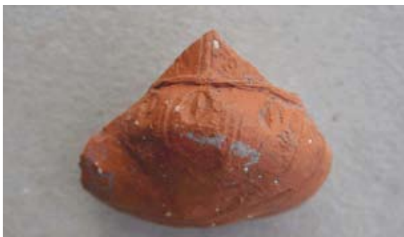
Sl. 60 Ulomak turskog tipa lule

Ovaj se primjerak bojom gline razlikuje od četiri prethodna, no oblikom i dekoracijom uvelike podsjeća na njih, te možemo primijeniti iste analogije kao kod sl. 56 i datirati ovaj primjerak također u 19. stoljeće.