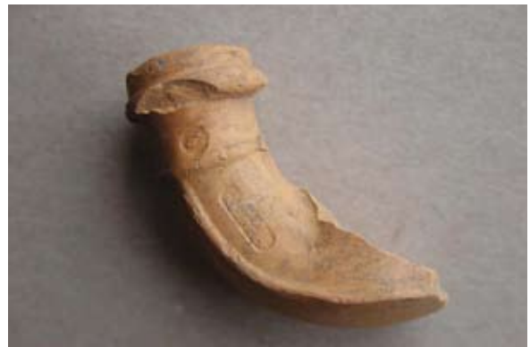
Sl. 36 Ulomak lule s natpisom Wolf / Halphen

mu odrediti analogije kao za prethodni primjer (sl. 35). Vjerojatno pripada 18. ili 19. stoljeću.