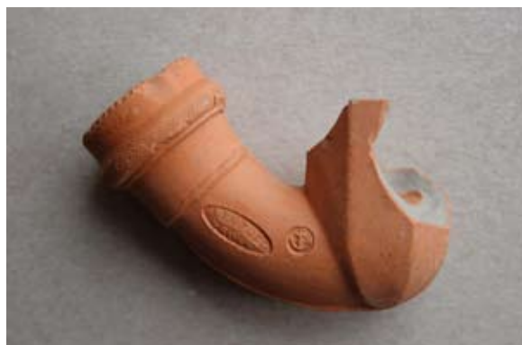
Sl. 26 Ulomak lule s natpisom Leopold / Gross

Kao i prethodni primjeri (sl. 18–25) datira se u 18. st. ili početak 19. stoljeća.