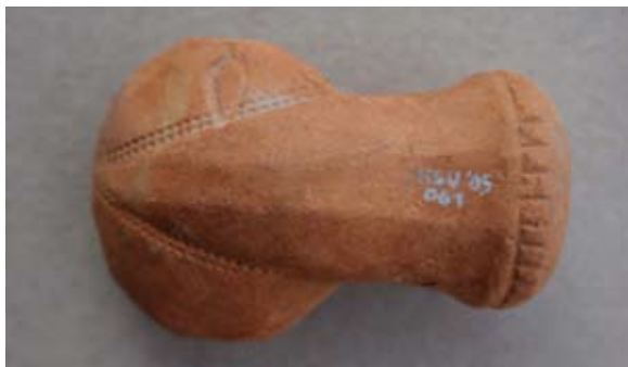
Sl. 61, 61a Ulomak turskog tipa lule

Sl. 62, 62a – P.P.D. = 2,5 cm; U.P.T. = 1,4 cm; D.S.Č. = 0,2–0,3 cm; V.P.D. = 2,1 cm; V. = 3 cm. Glina narančaste boje; sačuvan dio čašice cilindričnog oblika bez ukrasa; tuljac poligonalnog presjeka, ima otisnut kružni pečat s arapskim monogramom; obruč naglašen, ukrašen otiscima sitnijega i krupnijega nazubljenog kotačića; dno baze čašice ukrašeno tankim linijama u obliku slova V, od kojih je unutarnja izvedena nazubljenim kotačićem; jedna vezna rupa kroz stijenku čašice; lula rađena u kalupu.