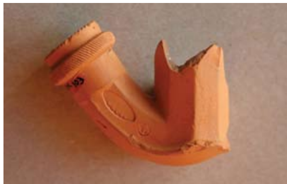
Sl. 25 Ulomak lule s natpisom Leopold / Gross

Slične primjere koji imaju čašicu i tuljac poligonalnog presjeka nalazimo na primjerima iz podmorja Šolte 69 te u Rovinju, 70 no natpisi na njima nisu jasni. Kao i prethodne primjere (sl. 18–24), ovu lulu možemo datirati u 18. st. ili početak 19. stoljeća.