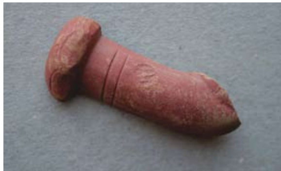
Sl. 64 Ulomak turskog tipa lule

Sličnosti nalazimo na bugarskim 102 i grčkim 103 primjercima, koji se datiraju u drugu polovicu 19. stoljeća.