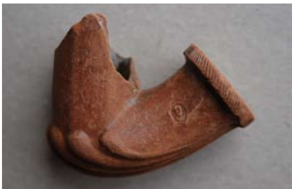
Sl. 16, 16a Ulomak lule tipa Schemnitz

Sl. 17, 17a – P.P.D. = 1,8 cm; U.P.T. = 1,4 cm; D.S.Č. = oko 0,3 cm; N.S.V. = 4,3 cm. Glina crvenonarančaste boje; sačuvan dio osmerokutne čašice; greben u obliku lista ili školjke; obruč naglašen prstenom ukrašenim gustim kosim paralelnim linijama; na sačuvanom dijelu tuljca pravokutni pečat s natpisom M.HÖNIGSOHN / S...ITZ (SCHEMNITZ); s druge strane lule mali pečat ispunjen portretom; jedna vezna rupa kroz stijenku čašice; lula izrađena u kalupu.