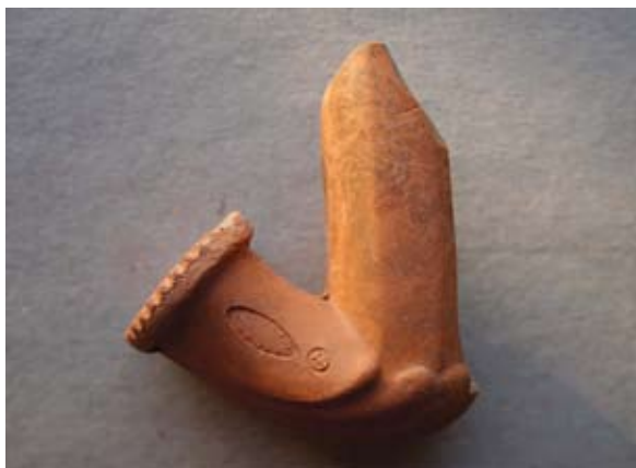
Sl. 19 Ulomak lule s natpisom Leopold / Gross