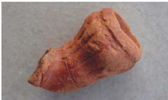
Sl. 70 Ulomak turskog tipa lule

Ovdje možemo primijeniti iste analogije kao kod prethodnog nalaza (sl. 69) i datirati ga u 19. stoljeće.