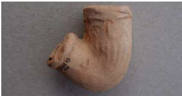
Sl. 45 Talijanski tip lule

Splita oblikom i ukrasom kružića uvelike podsjeća na naš primjerak a pripada 18. ili 19. stoljeću. 84