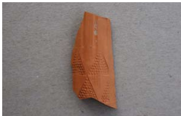
Sl. 40 Ulomak austrijsko–mađarskog tipa lule

Sl. 41 – P.P.D. = 1,8 cm; D.S.Č. = 0,25 cm; N.S.V. = 3,8 cm. Glina narančaste boje; sačuvan fragment na prijelazu čašice u greben; nema sačuvan pečat, no narančasta glina prekrivena je smeđim premazom pa lula ima mramorni izgled. Jedna vezna rupa kroz stijenku čašice; lula izrađena u kalupu; izrađena je od fine pročišćene narančaste gline, koja je u presjeku sive boje.