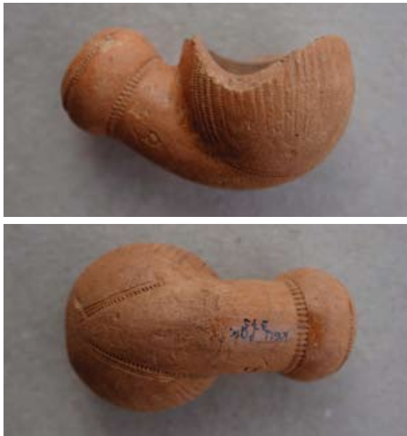
Sl. 48, 48a Ulomak turskog tipa lule

Slične primjere nalazimo među korintskim i atenskim nalazima koji se datiraju u kasno 18. ili 19. stoljeće. 89