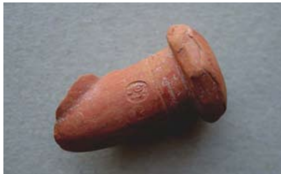
Sl. 65 Ulomak turskog tipa lule

Ovaj ulomak ima iste analogije kao i prethodni (sl. 64) te ga također možemo datirati u drugu polovicu 19. stoljeća.