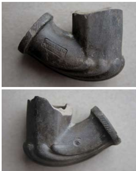
Sl. 3, 3a Ulomak lule tipa Schemnitz