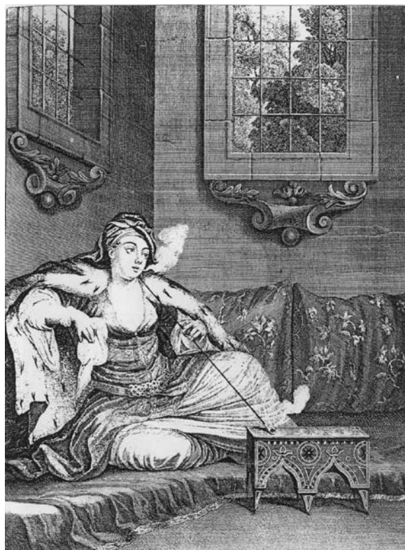
Sl. 2 Prikaz Turkinje na divanu s početka 18. stoljeća s trodijelnom lulom turskog tipa koju čine keramička čašica, kamiš i usnik (prema Robinson 1985, PLATE 37).