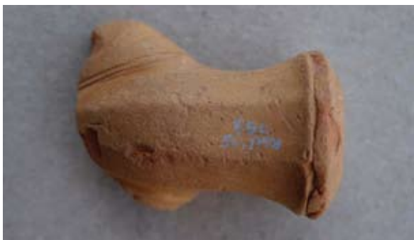
Sl. 59 Ulomak turskog tipa lule

Analogni primjeri isti su kao za prethodni ulomak (sl. 56), datira se u 19. stoljeće.