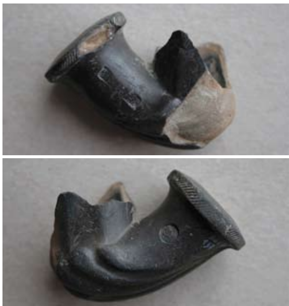
Sl. 8, 8a Ulomak lule tipa Schemnitz

Sl. 9 – P.P.D. = 1,7 cm; U.P.T. = 1,3 cm; D.S.Č. = 0,3–0,4 cm; N.S.V. = 4,5 cm. Glina sive boje, crnoplečena; sačuvan dio osmerokutne čašice; na tuljcu mali pečat u obliku medaljona s portretom; jedna vezna rupa kroz stijenku čašice; lula izrađena u kalupu.