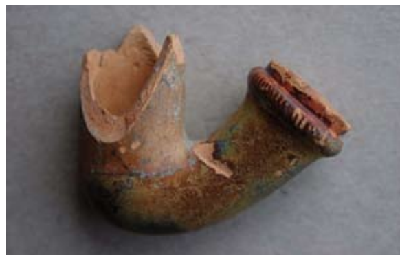
Sl. 44, 44a Ulomak austrijsko-mađarskog tipa lule s glazurom