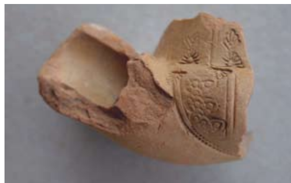
98 Robinson 1985, PL. 56 / C 94.

Izvršna analogija mu je lula pronađena u istraživanju Korinta, 98 jer je i tuljac istog oblika, no komparativnim primjerima možemo smatrati i one navedene kod sl. 56 jer su im oblik i ukras čašice isti. Datira se u 19. stoljeće.