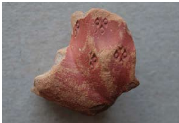
Sl. 75 Ulomak turskog tipa lule

Bugarski 117 , grčki 118 i novosadski 119 primjerci imaju čašice ukrašene na isti način, a mogu se datirati u 19. ili 20. stoljeće.