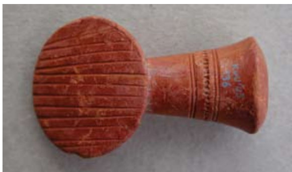
Sl. 71, 71a Ulomak turskog tipa lule s diskastom bazom

Sl. 72, 72a – U.P.T. = 0,95 cm; D.S.Č. = 0,3 cm; N.S.V. = 1,9 cm. Glina crvenonarančaste boje; sačuvana diskasta baza s dijelom tuljca; rub diska ukrašen kosim gustim linijama; s donje strane baze izvedena reljefna istaka, koja se spaja s tuljcem; jedna vezna rupa kroz stijenku čašice; lula rađena u kalupu.