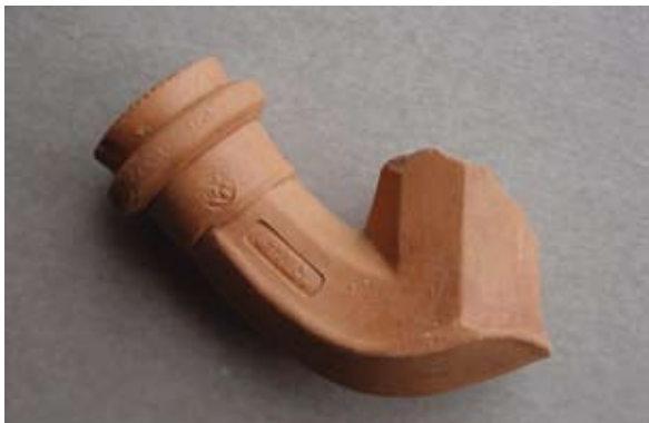
Sl. 31 Ulomak lule s natpisom Georg / Weigand

Ovaj primjerak ima čašicu i tuljac poligonalnog presjeka, a oblikom je isti kao i komparativni primjeri za sl. 25, tj. nalazi iz podmorja Šolte 71 i Rovinja. 72 Natpis ove radionice za sada ne nalazimo kod nas. Lula pripada austrijsko-mađarskom radioničkom krugu, no nije poznato gdje je djelovala ova radionica. Vjerojatno je izrađena u nekoj radionici koja je djelovala u 18. ili 19. stoljeću.