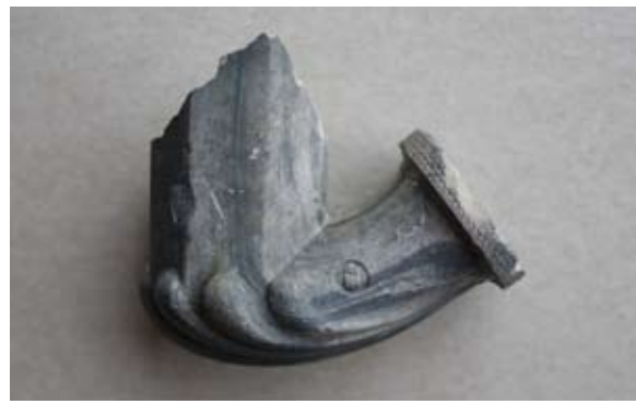
Sl. 5, 5a Ulomak lule tipa Schemnitz