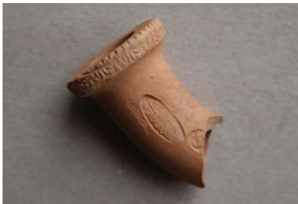
Sl. 28 Ulomak lule s natpisom Leopold / Gross

Kao i prethodni primjeri (sl. 18–27) datira se u 18. st. ili početak 19. stoljeća.