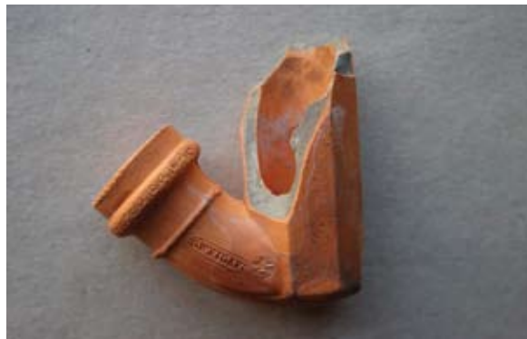
Sl. 33 Ulomak lule s natpisom GWeigand

Kao i prethodna dva primjera (sl. 31, 32), lula se može datirati u 18. ili 19. stoljeće.