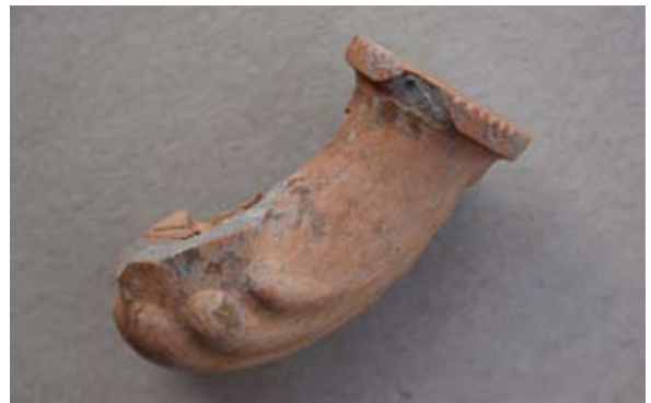
Sl. 30 Ulomak lule austrijsko–mađarskog tipa

Budući da ovaj primjerak nema sačuvane pečate, ne možemo ga sa sigurnošću odrediti, ali po svjetlijoj glini, ukrasu na prstenu tuljca, lisnatom motivu na grebenu, možda bismo ga mogli svrstati u radionicu L. Grossa ili neku iz bliskog središta. Datira se, kao i prethodni primjeri (sl. 18–29), u 18. st. ili sam početak 19. stoljeća.