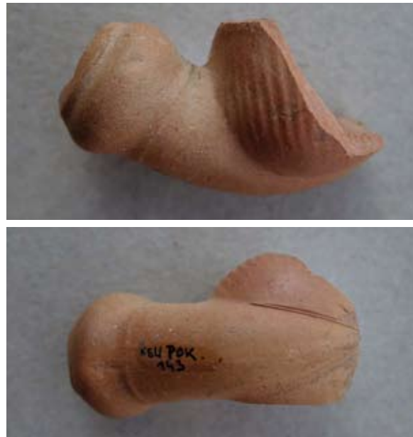
Sl. 50, 50a Ulomak turskog tipa lule

U literaturi ne nalazimo blisku analogiju. Moguće je da pripada 18. ili 19. stoljeću.