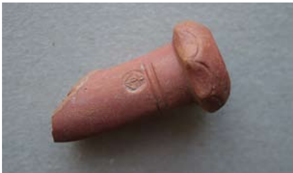
Sl. 66 Ulomak turskog tipa lule

tim noktima; na tuljcu urezane dvije paralelne linije te mali kružni pečat s prikazom sidra; lula rađena u kalupu.