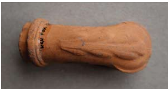
Sl. 24, 24a Ulomak lule s natpisom Leopold / Gross

Sl. 25 – P.P.D. = 1,7 cm; U.P.T. = 1,2 cm; D.S.Č. = 0,2–0,3 cm; N.S.V. = 4,2 cm. Glina narančaste boje, presjek sivi; sačuvan dio osmerokutne čašice; obruč naglašen prstenom ukrašenim tankim kosim paralelnim linijama; na tuljcu dva pečata od kojih je jedan ovalni s natpisom ...D / GROSS (LEOPOLD / GROSS), a drugi kružni s prikazom sidra; jedna vezna rupa