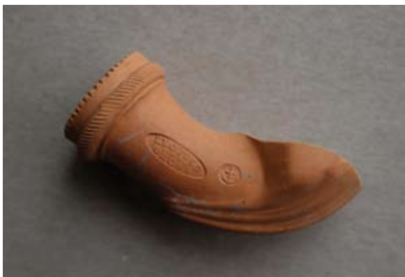
Sl. 23 Ulomak lule s natpisom Leopold / Gross

Sl. 24, 24a – U.P.T. = 1,2 cm; N.S.V. = 1,9 cm. Glina narančaste boje, presjek sivi; nije sačuvana čašica; na grebenu izveden lisnati motiv; obruč naglašen prstenom ukrašenim kosim paralelnim linijama; na tuljcu dva pečata od kojih je jedan ovalni s natpisom LEOPOLD / GROSS, a drugi kružni s prikazom sidra; jedna vezna rupa kroz stijenku čašice; lula izrađena u kalupu.