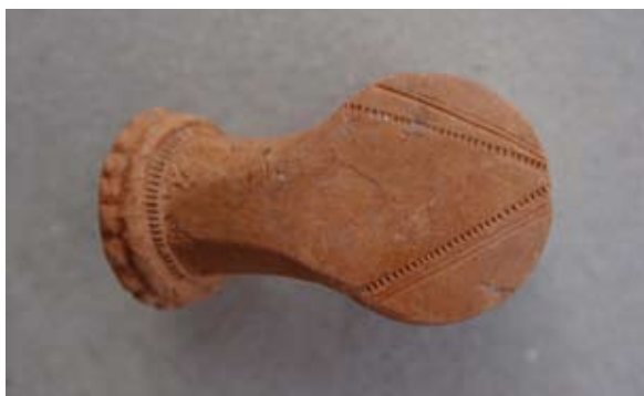
Sl. 62, 62a Ulomak turskog tipa lule

Sl. 63 – U.P.T. = 1,1 cm. Glina crvenonarančaste boje; sačuvan mali dio čašice ukrašen mrežastim motivom s rombovima istaknutim u reljefu; tuljac s prstenom naglašenim obručem ukrašen mrežastim motivom kao i čašica; greben neznatno sačuvan, bio naznačen V-linijom otisnutom nazubljenim kotačićem; jedna vezna rupa kroz stijenku čašice; lula rađena u kalupu.