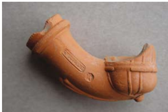
Sl. 34 Ulomak lule s natpisom GWeigand