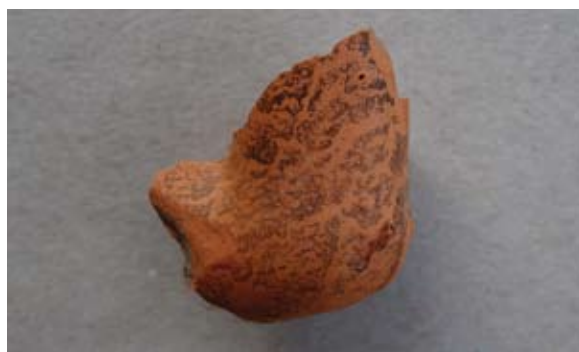
Sl. 41 Ulomak austrijsko–mađarskog tipa lule

Ovaj ulomak sačuvan je u manjem opsegu pa mu nedostaju radioničke oznake što otežava određenje središta u kojem je nastao. Lula je premazana tako da je postignut mramoriziran izgled, kao i kod primjera na sl. 32, od kojeg preuzimamo analogije za postizanje tog efekta. Kao i prethodni primjeri, vjerojatno pripada 18. ili 19. stoljeću.