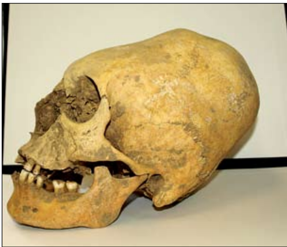
Sl. 1