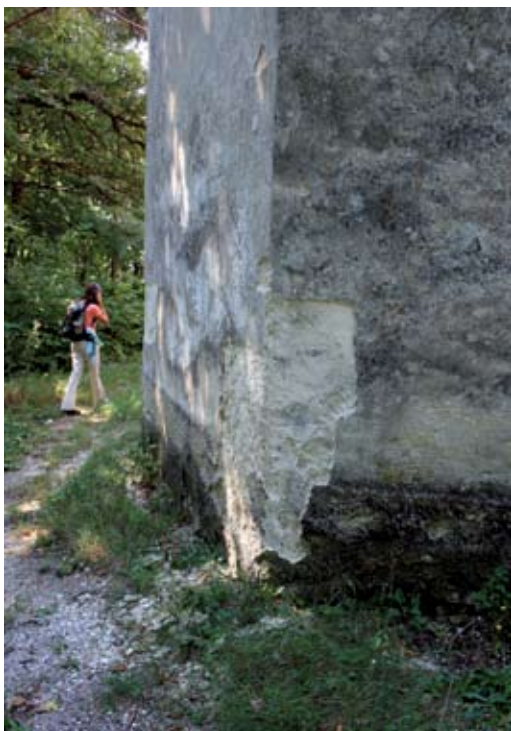
Sl. 13 Meljan, kapela sveta Tri kralja, svetište završeno "na šilj"