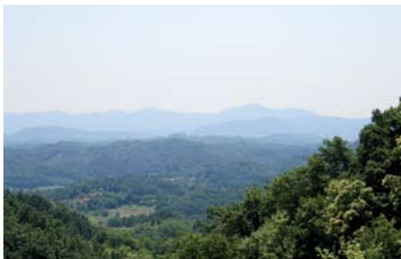
Sl. 3 Jamno, pogled s mjesta gdje se nalazi ruševina prema zapadu i jugozapadu