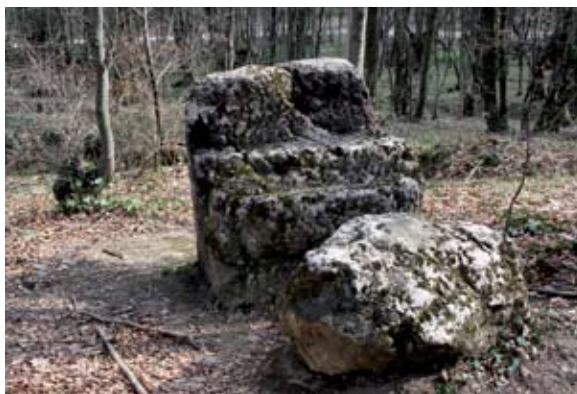
Sl. 15 Kaniža, kameni spomenik

U blizini kapele sv. Tri Kralja, također na povoljnoj strateškoj poziciji, s koje se mogao imati pregled na sjeverozapad i putove koji su vodili od Višnjice prema Trakošćanu, nalazila se još jedna kapela, posvećena