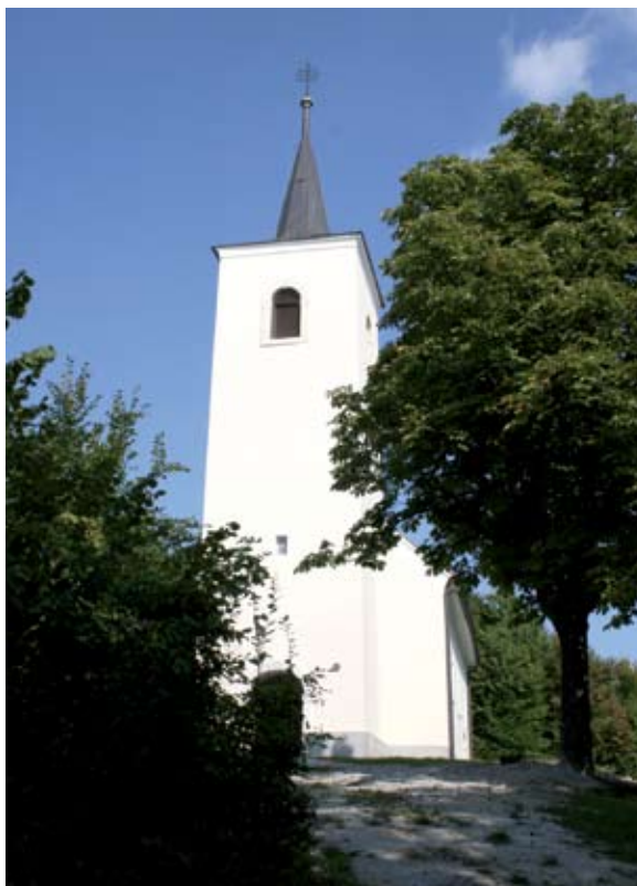
Sl. 8 Hum, kapela sv. Josipa

Brežuljak na kojem je smještena kapela sv. Josipa u Humu, vrlo blizu naselja Bednje, izvanredna je relejna točka. Iako je proplanak s kapelom uokviren gustom šumom, s tornja se otvara pogled na istok, prema Lepoglavi, Ivancu i dalje na sjever i putovima koji vode uz ta naselja, prema jugu se nadzire Bednja, svi prilazni putovi do naselja i cijelo brežuljkasto područje uokolo, a sa sjevera je Hum zaklonjen strmom stijenom Ravne gore. Na ovoj odličnoj strateškoj točki nalazi se manja, pravilno orijentirana jednobrodna kapela sa užim, poligonalno zaključenim svetištem, tornjem is-