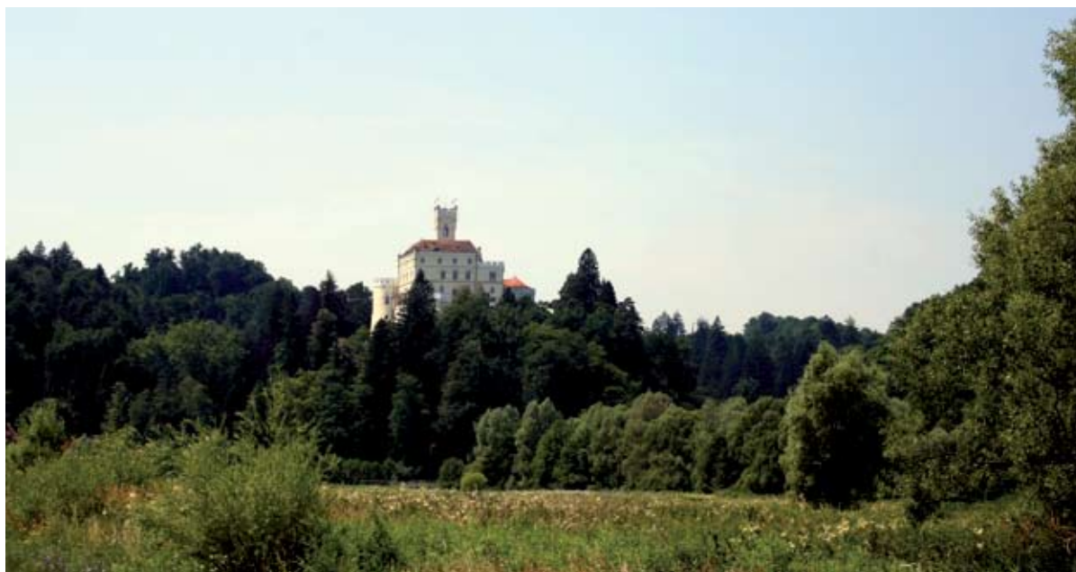
Sl. 5 Trakošćan, pogled na dvorac sa sjevera