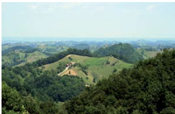
Sl. 4 Jamno, pogled s mjesta gdje se nalazi ruševina prema istoku i sjeveroistoku