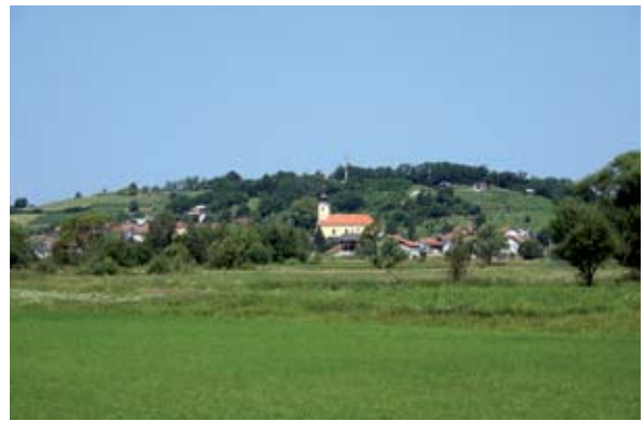
Sl. 6 Bednja, pogled na naselje s juga