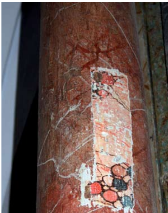
Sl. 14 Meljan, kapela sveta Tri kralja, detalj glavnog oltara

mom vrhu planine, na povoljnoj strateškoj poziciji s koje je moguće imati pod vizualnom kontrolom gotovo cijeli okolni kraj, nalazi se crkva sv. Tri kralja (sl. 12). To je pravilno orijentirana jednobrodna kapela, sa četverostranim svetištem koje je zaključeno na šilj 14 (sl. 13) i tornjem uz južno pročelje. Na sondama otvorenim na vanjskom zidnom plaštu vidljivo je da je kapela prvobitno bila kraća, te se uočavaju tragovi tamno sive boje kojom su bili oslikani ugaooni dijelovi kapele. U unutrašnjosti se također jasno vide neke faze dogradnje i uređenja crkve. Na tornju, ispod razdjelnog vijenca uzidana je ploča sa 1619. godinom, a razvoj i dogradnje u kapeli mogu se pratiti u kanonskim vizitacijama od 1666. godine. 15 Točna starost crkve je za sada nepoznata, a njena strateška pozicija i čvrstoća gradnje daje naslutiti mogućnost njene datacije u srednjovjekovno razdoblje. U kapeli se nalazi vrijedan pokretni inventar iz razdoblja ranog baroka (sl. 14). Buduća istraživanja njene arhitekture, kao i arheološka istraživanja okoliša mogla bi iznjudriti nove podatke o ovoj građevini.