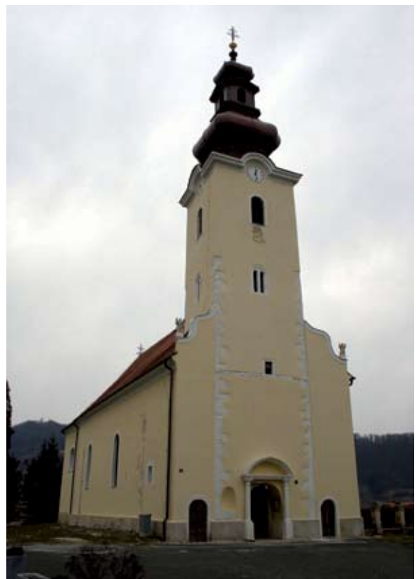
Sl. 7 Bednja, župna crkva

bi prema tome bila srednjovjekovno sakralno središte trakošćanskog posjeda. Crkva i naselje oko nje smješteni su podalje od svjetovnog središta posjeda – utvrde Trakošćan i čine potpuno zasebnu cjelinu u odnosu na utvrdi. Župna crkva je pravilno orijentirana, jednobrodna građevina s polukružnim svetištem iste širine kao i brod, sa sakristijom na južnoj strani i tornjem ispred glavnog ulaza (sl. 7). Prema zapisu koji se nalazio u jabuci tornja, ova crkva bi bila izgrađena iz temelja godine 1822., na potpuno novoj poziciji jer je stara crkva stradala u odronu zemlje. 9 Ovaj zapis pokazao se kao potpuno pogrešan jer su istraživanja