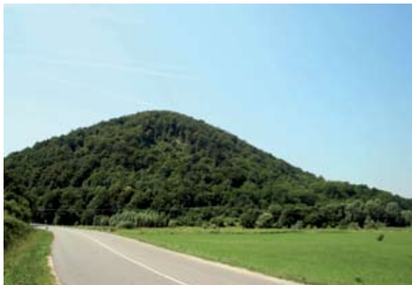
Sl. 10 Želimor, pogled na brežuljak