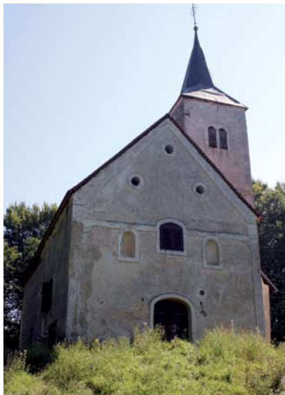
Sl. 12 Meljan, kapela sveta Tri kralja

Južno od naselja Bednja nalazi se brežuljak arhaičnog naziva Želimor, uz koji su povezane i neke legende ovoga kraja (sl. 10). Na nadmorskoj visini od 480 metara, na terasastom platou ispod najvišeg vrha, na mjestu kojeg lokalno stanovništvo naziva Gradišće, nalazilo se dobro zaštićeno naselje 12 s nalazima iz kasnog brončanog i starijeg željeznog doba. Posebno je zanimljiv nalaz ručnog prapovijesnog rotacijskog žrvnja. 13 Sa te pozicije moglo se nadgledati područje s obje strane brežuljka, tj. dolinu rijeke Bednje prema Lepoglavi sa jedne strane te prema Trakošćanu s druge. Prema legendama, u brežuljku Želimor spava zmaj, te se na njega ne smije penjati kako ga se ne bi probudilo. Također postoji legenda da ovdje živi velika zmija. Općenito, uz ovaj brežuljak povezane su zmije te lokalno stanovništvo upozorava da se na njega nitko ne penje jer ima puno poskoka i riđovki . Također postoji još uvijek živuća priča iz okolice Maruševca, da kod brda Želimor žive vještaci koji gataju , te da su ljudi u prošlosti dolazili ovamo na gatanje. Tako