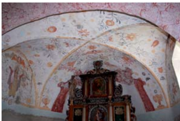
Sl. 9 Hum, kapela sv. Josipa, oslik u svetištu

pred zapadnog ulaza i sakristijom na sjevernoj strani (sl. 8). Zanimljivo je da se sv. Josip prvi put spominje u kanonskim vizitacijama od 1666. godine kao zidana kapela, 10 dok je u opisima koji su bili dio tajnih vojnih karata rađenih u drugoj polovici 18. stoljeća zapisano da je kapela samo drvena. 11