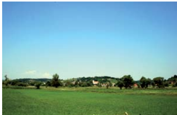
Sl. 1 Dolina Bednje, pogled na naselje Bednja

Stručna istraživanja spomenika graditeljske baštine ovog kraja otkrila su mnoge pojedinosti o povijesti njihove gradnje te upotpunila naše znanje o njima, ali isto tako otvorila mnoga nova pitanja te potrebu za daljnjom stručnom analizom.