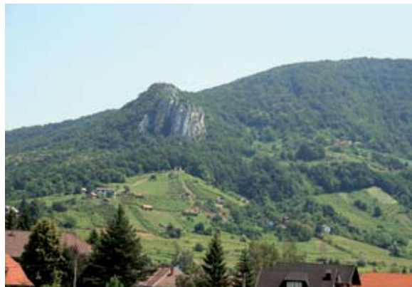
Sl. 11 Ravna gora, "Velike pećine"

On je oblikovno jednak kamenom okviru koji je danas ugrađen na ulazu u župni dvor u Ivancu, a nekad je bio smješten na ulazu u ivanečku župnu crkvu, na kojem je uklesana 1681. godina.