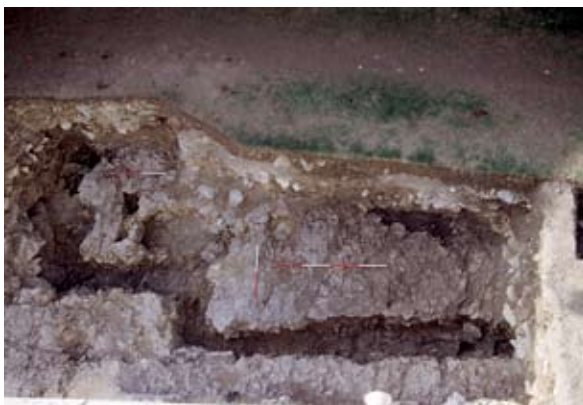
Sl. 1 Drvena crkva – sjeverna strana, istraživanja 2003. godine