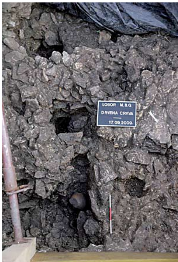
Sl. 5 Jama za stup, u kojoj je nađena posuda, smještena je točno između broda i apside i vjerojatno je u nju bio usađen stup koji je držao jugozapadnu stranu apside

njama crkava. Taj grob vrlo sliči drugim grobovima koji su svi redom ukopani u stijenu. U njima najčešće nema nikakvih nalaza. U većini grobova pokojnici su vjerojatno bili sahranjeni u ljesovima. Većina grobova tog sloja ravna se prema predromaničkoj trobrodnoj bazilici i ni jedan se, osim spomenutog, ne nalazi na prostoru drvene crkve. Cijeli taj horizont grobova datira se u 9. i 10. stoljeće. 10 Nedaleko od groba djevojčice u apsidi drvene crkve nalaze se dvije prazne jame. Možda je riječ o jamama bez ikakvih nalaza, koje se mogu povezati s oltarom ili o jamama za ukop spaljenih pokojnika.