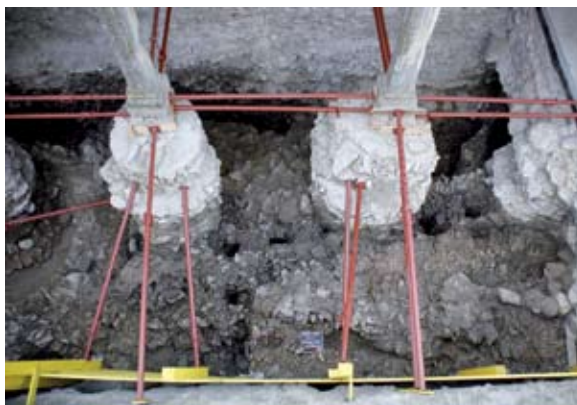
Sl. 2 Drvena crkva – južna strana, istraživanja 2009. godine

je drvena crkva slijedila orijentaciju starije građevine. Očito je starokršćanska crkva, koja je stradala u požaru, bila u tako lošem stanju da više nije obnovljana. Ni jedna građevina u ovome podneblju ne može izdržati dvije stotine godina bez krova. Općenito, kako svjedoče povijesni sljedovi na građevinama u Loboru, ili se građevina mora svakih dvjesto do tristo godina temeljito obnoviti ili se mora srušiti i graditi nova. Zidovi starokršćanske crkve tek su razgrađeni prigodom podizanja predromaničke crkve koncem 9. ili početkom 10. stoljeća.