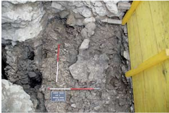
Sl. 3 Ispod utabane podnice na južnoj nižoj strani nalazile su se posložene laporaste pločaste stijene