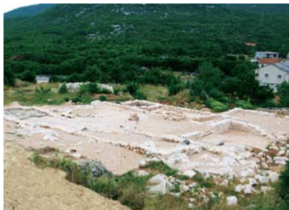
Klapavice–Crkvina nakon istraživanja

U organizaciji Muzeja hrvatskih arheoloških spomenika na proljeće godine 2006. započela su sustavna arheološka istraživanja. 4 Tijekom istraživanja pronađeno je obilje arheološke građe, među kojom