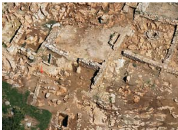
Narteks crkve s položajem nalaza

znatan dio čine numizmatički nalazi. Otkriveno je više od 300 komada pojedinačnoga kasnorimskog i bizantskog novca, koji je sada na konzervatorskoj obradi. O njima će se moći više govoriti kada budu očišćeni i konzervirani.