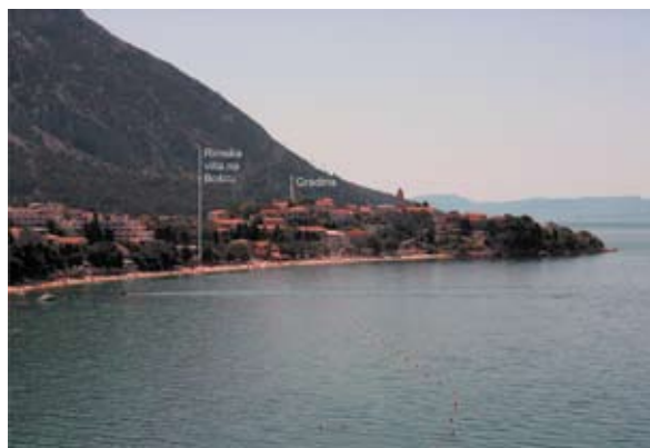
Sl. 3 Gradina u Gradcu i položaj kompleksa rimske villae na sjeverozapadnom podnožju