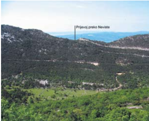
Sl. 7 Pogled s gradinske promatračnice Sv. Nikola na prijevoj preko Neviste