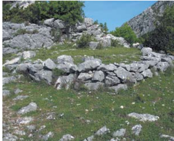
Sl. 10 Ostaci kule istočno od crkve sv. Nikole