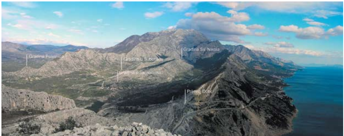
Sl. 6 Pogled s Gradine iznad Dubaca na obalu, prijevoj i gradinske položaje u Gornjim Brelima (foto: Tonči Čorić)

srednjega vijeka. Kod ubiciranja utvrde, svejedno je li kasnoantička ili ranosrednjovjekovna Porfirogenetova, treba polaziti od činjenice kako obalnim Brelima nedostaje gradinski punkt. Nije čudno što se za takvim karakterističnim izgledom lokaliteta poveo još S. Zlatović, smještajući Beruliju upravo na položaju “između Brela i Baške vode...gdje se i danas vide davne poderine zidina na obli humcu iznad Staničića kuća. To se mjesto zove Gradina” , 74 što je Goldstein previdio. Arheološki istraživanoj Gradini (25 n/m) zajamčeno je postanje u ranom brončanom dobu, a naročitu je ulogu dobila utvrđivanjem u vrijeme ratova s Gotima u 6. st. 75 Stoga je njezina situacija, osobito u pogledu rimskih ostataka u podnožju, promotrena kao istovjetna Muccurumu. Zlatovićevu tvrdnju treba uvažiti, slično kao i u Banovićevu ubiciranju Ostroga, tek u ispravnom percipiranju lokaliteta u geomorfologiji prostora. Uz to, etimologija naziva Berulija i u slučaju Baške Vode imala bi svoju osnovu s obzirom na priobalne izvore vode. Ipak, nekoliko je prigovora ubikaciji utvrde, odnosno poistovjećivanju Berulije s Gradinom u Baškoj Vodi. Na njoj nisu potvrđeni ostaci iz ranoga srednjeg vijeka, štoviše, ovi se datiraju zaključno u 7. st. Naprotiv, na prostoru sela Bast, uzdignutog oko 3 km istočnije od Baške Vode, nisu izraženi veći prekidi u naseljavanju od prapovijesti do srednjeg vijeka. 76 Dok se u priobalnoj Baškoj Vodi od kasne antike do postturskog razdoblja ne nailazi