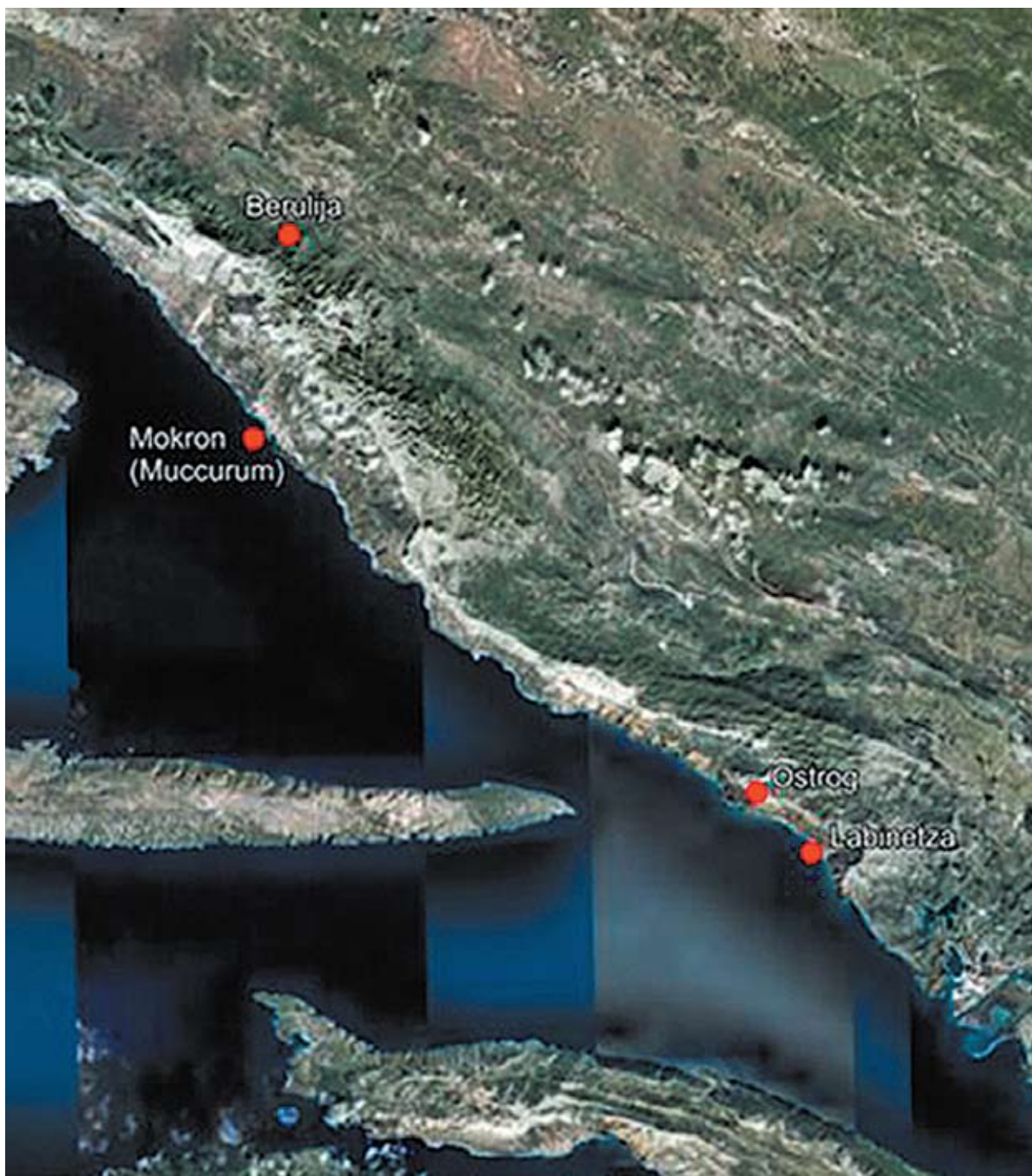
Karta: Položaj Porfirogenetovih gradova – utvrda u Paganiji (Makarsko primorje)