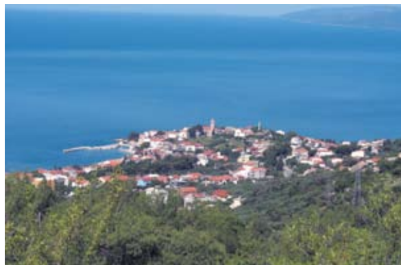
Sl. 2 Gradinski položaj antičkog i ranosrednjovjekovnog sklopa Labinetze u Gradcu

Nepoznavanjem navoda iz referentne literature o ostacima u Gradcu pristupio je i ubiciranju Labinetze. 28 Dok je većinom citirao kabinetska historiografska domišljanja i usputne navode iz njih u pogledu ubicacije, izostavlja Medinijev rad, čije su postavke nedavno osnažene izvješćem provedenih zaštitnih arheoloških istraživanja u Gradcu. 29 Stoga se priklonio nekim radovima koji su ga beskorisnom uopćenošću oskudno spomenutih arheoloških činjenica u nedostatnoj usredotočenosti na problem potaknuli na dvojben, veoma neoprezan zaključak kako se u slučaju priobalne Gradine u Gradcu (32 n/m) “čini da ni arheolozi nisu još stvorili jasnu sliku o starosti tog lokaliteta i o procesima koji su se na njemu odvijali”. 30 Da je kojim slučajem konzultirao Medinijev tekst, znao bi kako uopće ne postoji problem “starosti” tog