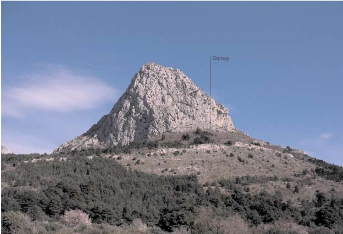
Sl. 1 Ostrog u podnožju Malog Vitera iznad današnjeg obalnog Zaoostroga

u Porfirogenetovu djelu. Doduše, u slučaju Ostroga nije zadao veća odstupanja u užem ubiciranju. Tek je utvrdu pretpostavio na uzdignutoj točki kasnosrednjovjekovne gradnje Jugovića grada, koja je vjerojatno i samim istaknutim položajem podignuta na promatračnici starije utvrde u podnožju.