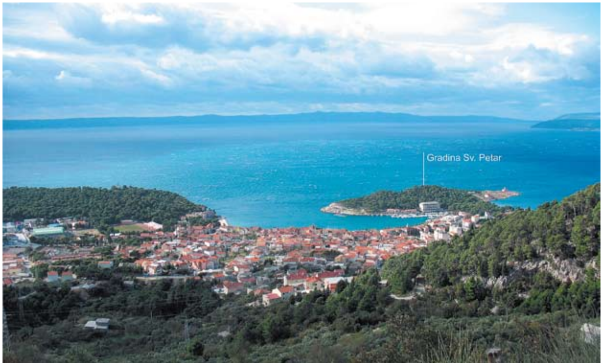
Sl. 4 Pogled na gradinu Sv. Petar i istočnu stranu rimskog Muccuruma na prostoru današnje Makarske u njenom podnožju

lokaliteta, barem ne u okviru koji se ovdje razmatra. Pitanje vremena zasnivanja Gradine upitno je tek u određivanju užeg vremena njezina zasnivanja, najvjerojatnije u prapovijesti. Međutim, nije upitno za antičko i kasnoantičko razdoblje, a po svemu sudeći ni u smislu položaja kastruma iz 10. st. (sl. 2). 31 Na Gradini je rimska gradnja prepoznata u izgledu reprezentativnijih kamenih ulomaka vijenca datiranih u 2. st. 32 Na Bošcu, zapadnom podnožju Gradine, Medini je pretpostavio ostatke monumentalnije villae , 33 a zaštitna arheološka istraživanja 2003.–2004. su je potvrdila, kao i njezin termalni sklop. 34 Gradnja je datirana u isto vrijeme kao i ulomci s Gradine, ali potvrđen je i njezin kontinuitet do 6. st. Uopće, kasnoantički nalazi dokazuju razvijeno središte na prostoru Gradine i Bošca (sl. 3), uključujući crkvenu gradnju, 35