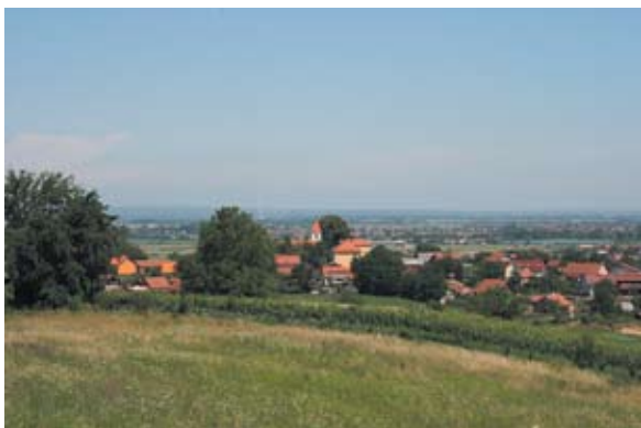
Sl. 18 Kneginec, pogled s Trema prema crkvi sv. Marije Magdalene u Knegincu, autor: Vesna Pascuttini Juraga

Crkva sv. Marije Magdalene u Knegincu ne spominje se u popisu župa 1334. godine niti 1501. godine. Prvi se put spominje godine 1649., kao filijalna kapela župe Blažene Djevice Marije u Biškupcu. Crkva je građena od kamena i pravilne je orijentacije. Smještena je na platou, unutar nekadašnjeg kaštela. Građena je krajem 15. i početkom 16. stoljeća u stilu gotike. To je jednobrodna, longitudinalna građevina, s poligonalnim svetištem nižim i užim od lađe. Svetište je od lađe odvojeno šiljastim trijumfalnim lukom. Nekad je