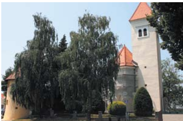
Sl. 12 Kneginec, župna crkva i kula, autor: Vesna Pascuttini Juraga