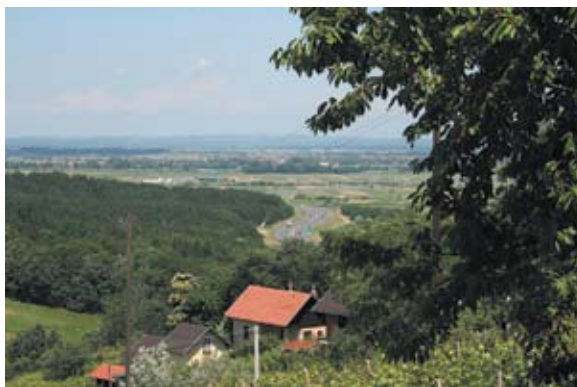
Sl. 19 Banjščina, pogled prema varaždinskoj dolini i autocesti prema Var. Toplicama, autor: Vesna Pascuttini Juraga

Crkva sv. Marije Magdalene u Knegincu ne spominje se u popisu župa 1334. godine niti 1501. godine. Prvi se put spominje godine 1649., kao filijalna kapela župe Blažene Djevice Marije u Biškupcu. Crkva je građena od kamena i pravilne je orijentacije. Smještena je na platou, unutar nekadašnjeg kaštela. Građena je krajem 15. i početkom 16. stoljeća u stilu gotike. To je jednobrodna, longitudinalna građevina, s poligonalnim svetištem nižim i užim od lađe. Svetište je od lađe odvojeno šiljastim trijumfalnim lukom. Nekad je