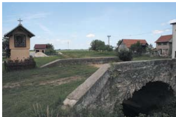
Sl. 1 Kelemen, stari most, autor: Ivana Peškan