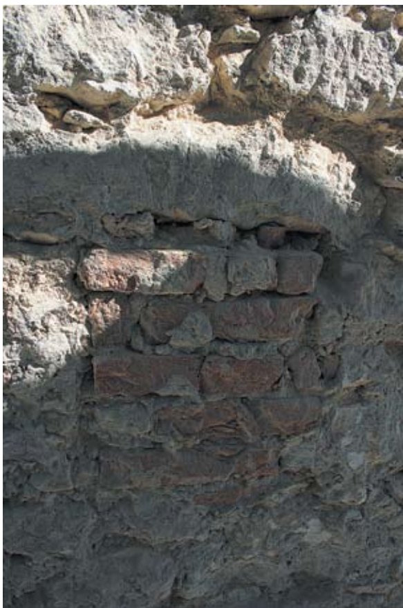
Sl. 17 Kneginec, župna crkva, južno pročelje, stanje nakon skidanja žbuke, autor: Vesna Pascuttini Juraga