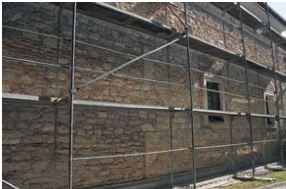
Sl. 14 Kneginec, župna crkva, južno pročelje, autor: Vesna Pascuttini Juraga