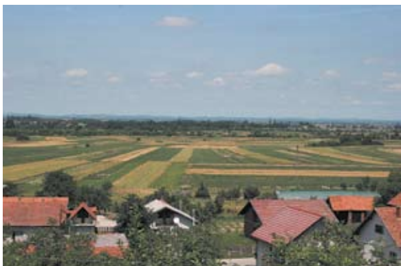
Sl. 21 Črešnjevo, pogled sa platoa gdje se nalazi kapela sv. Mihovila, autor: Ivana Peškan

području Kneginca nalazimo i dvije grabe, Šemigovu grabu te Pintarićevu grabu, kao i područje koje se naziva Šumica, a nalazi se zapadno od crkve. Zanimljiv je i naziv Banjščina (ili Banščina), na kojem smo obilaskom terena također naišli na vrlo zanimljivo mjesto, s kojeg se ponovo pruža pogled i na kneginečku crkvu i na varaždinsku dolinu, te s kojeg se može nadgledati trasa današnje autoceste, tj. nekadašnje ceste prema Varaždinskim Toplicama, a vizualna komunikacija moguća je i s Tremom iznad Jakopovca (sl. 19). To je mjesto na kojem se nekada nalazila palača Kussy, a danas se nalazi restoran Zlatne gorice . Također, moramo spomenuti i naziv naselja Lužan, koji je slavenskog porijekla. 35 Lužan se prvi put spominje kao posjed u povelji iz 1365. godine. 36