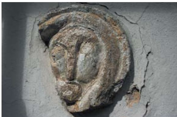
Sl. 15 Kneginec, župna crkva, južno pročelje, reljef, autor: Vesna Pascuttini Juraga