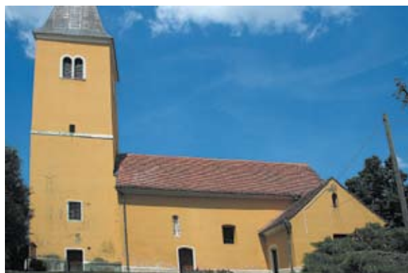
Sl. 3 Kelemen, kapela sv. Klementa, autor: Ivana Peškan

kao župa koja pripada varaždinskom arhiđakonatu ( item ecclesia sancti Clementis in archidiaconatu varazdiensi ). 15 Godine 1501. kao ime naselja u kojem se nalazi crkva navodi se Zvinuša ( ecclesie sancti Clementis in Zwynusa ). 16 Kao župna crkva spominje se još u popisu iz godine 1513., a prema najstarijoj kanonskoj vizitaciji iz godine 1659., već je bila područna kapela suhodolske župe. 17