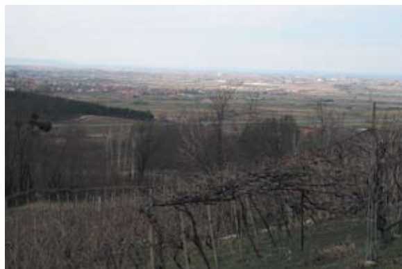
Sl. 10 Jakopovec, pogled s Treme prema Varaždinu, autor: Ivana Peškan