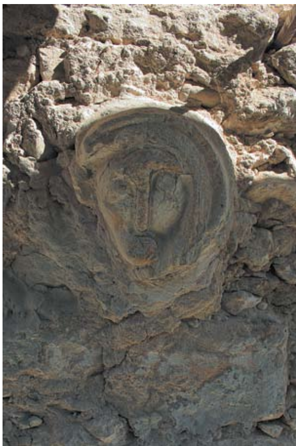
Sl. 16 Kneginec, župna crkva, južno pročelje, reljef, autor: Vesna Pascuttini Juraga

ti nekoliko očuvanih starih bunara, smještenih na križanjima ulica. Samo središte naselja nalazi se na vrhu brežuljka, na platou na kojem se susreću tri puta. I ovdje se nalazi jedan bunar. Najveći dio platoa zauzima kompleks koji čine župna crkva sv. Marije Magdalene, župni dvor, te kula u neposrednoj blizini crkve, s njezine jugoistočne strane (sl. 12, 13).