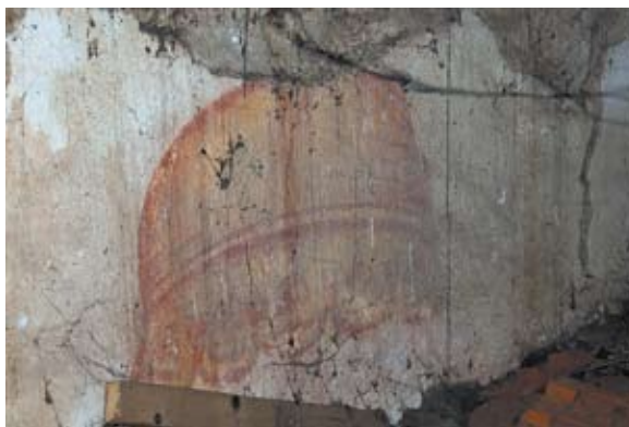
Sl. 6 Kelemen, oslik u potkrovlju, autor: Ivana Peškan

građevina, pravokutnog tlocrta (tlocrtna dispozicija je u obliku Saalkirche), s masivnim tornjem ispred zapadnog pročelja i sakristijom prizidanom na južnoj strani (sl. 3). Dok je svetišni dio izvana potpuno utopljen u zidnu masu širinom i visinom, u unutrašnjosti je odvojen od broda trijumfalnim lukom i nižim svodom, što je barokna intervencija. Masivni zidovi crkve (oko 120 cm), rastvoreni su na južnom pročelju ulaznim vratima iznad kojih se nalazi ostatak romaničkog prozora, iznutra zazidanog, ali izvana je vidljiv njegov kameni okvir, proširen u donjoj zoni (sl. 4). Na južnom pročelju nalazi se još jedan, barokni prozor. Prostrana sakristija zauzima ostatak tog