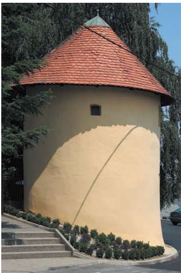
Sl. 13 Kneginec, kula, autor: Vesna Pascuttini Juraga

na. Zbog teškog pristupa krovu sakristije nije trenutno bilo moguće utvrditi eventualne ostatke koji bi upućivali da je to bilo prizemlje neke više građevine, možda tornja ili je možda čak ostatak nekog većeg kompleksa uz kapelu. I ovdje bi arheološka sondiranja uz kapelu dala nove podatke.