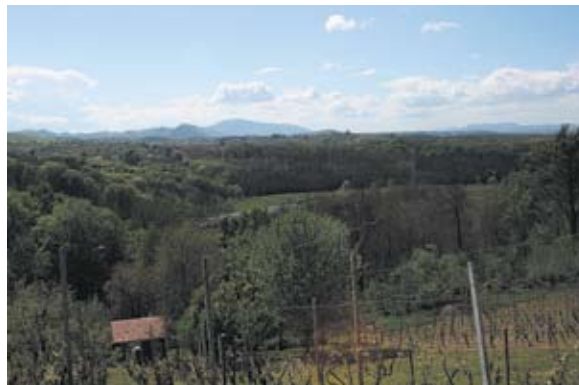
Sl. 9 Jakopovec, pogled s Treme prema Ivanščici i Ravnoj gori

Prilikom konzervatorskog obilaska kapele, vezano uz rješavanje problema vlage i sanacije fasade, naš domaćin je bio g. Družinić, predstavnik mjesnog odbora i očiti entuzijast za kulturno naslijeđe svojega kraja. On nas je, kako bi nam pokazao okolicu, odveo na mjesto gdje je stajala njegova rodna kuća. To mjesto je današnja najviša kota naselja. Stigavši na vrh, bilo nam je odmah jasno da stojimo na mjestu koje je izvanredna relejna točka s vizualnim kontaktom na zapad prema Knegincu, i svim brežuljcima sve do vrha Ivančice, na jugu sve do vrha Kalnika, prema istoku