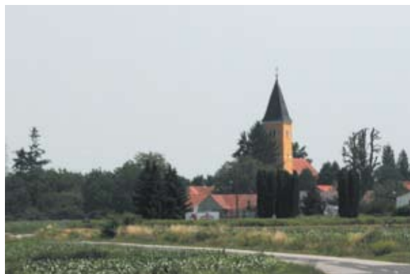
Sl. 2 Kelemen, vizura, autor: Ivana Peškan