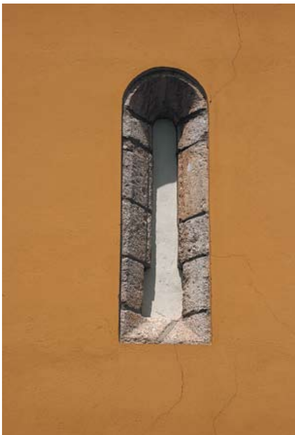
Sl. 4 Kelemen, kapela sv. Klementa, autor: Ivana Peškan