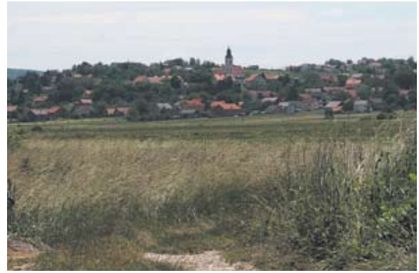
Sl. 20 Sveti Ilija – Obrež, pogled na naselje i crkvu, autor: Vesna Pascuttini Juraga