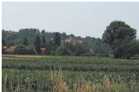
Sl. 7 Jakopovec, vizura na naselje, autor: Ivana Peškan