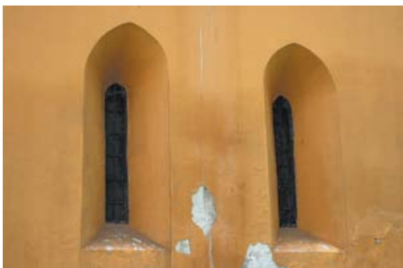
Sl. 5 Kelemen, kapela sv. Klementa, autor: Ivana Peškan

građevina, pravokutnog tlocrta (tlocrtna dispozicija je u obliku Saalkirche), s masivnim tornjem ispred zapadnog pročelja i sakristijom prizidanom na južnoj strani (sl. 3). Dok je svetišni dio izvana potpuno utopljen u zidnu masu širinom i visinom, u unutrašnjosti je odvojen od broda trijumfalnim lukom i nižim svodom, što je barokna intervencija. Masivni zidovi crkve (oko 120 cm), rastvoreni su na južnom pročelju ulaznim vratima iznad kojih se nalazi ostatak romaničkog prozora, iznutra zazidanog, ali izvana je vidljiv njegov kameni okvir, proširen u donjoj zoni (sl. 4). Na južnom pročelju nalazi se još jedan, barokni prozor. Prostrana sakristija zauzima ostatak tog