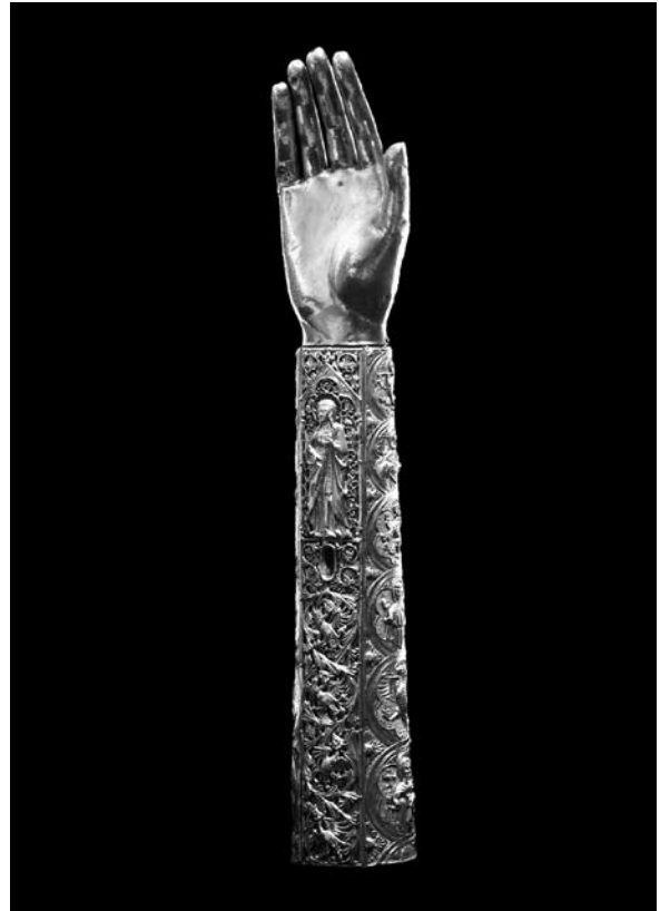
Sl. 1. Moćnik ruke sv. Marije Magdalene (XXV.) iz Moćnika dubrovačke prvostolnice, Majstor fantastičnog bestijarija II, 14. st.