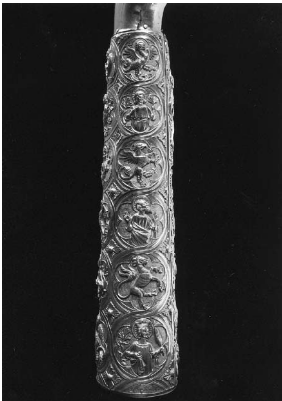
Sl. 3. Detalj moćnika ruke sv. Marije Magdalene (XXV.) iz Moćnika dubrovačke prvostolnice, Majstor fantastičnog bestijarija II, 14. st.