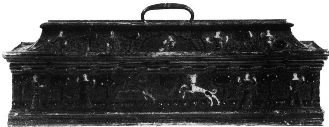
Sl. 15. Škrinja s motivom "caccia amorosa", privatna kolekcija, Italija