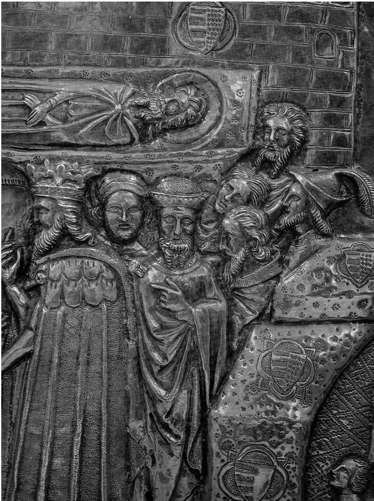
Sl. 19. Franjo iz Milana, Škrinja sv. Šimuna: Ulazak Ludovika u Zadar, detalj kralja s pratnjom, sv. Šimun u Zadru (preuzeto iz I. Petricioli, Škrinja sv. Šimuna u Zadru, Zagreb 1990).