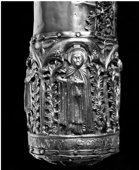
Sl. 9. Detalj s likom sv. Antuna Opata s moćnika sv. Antuna Opata (XXXI.) iz Moćnika dubrovačke prvostolnice, Majstor fantastičnog bestijarija II, 14. st.