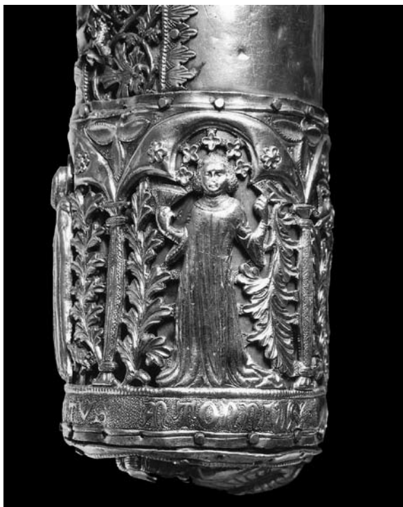
Sl. 11. Detalj sa ženskim likom s moćnika sv. Antuna Opata (XXXI.) iz Moćnika dubrovačke prvostolnice, Majstor fantastičnog bestijarija II, 14. st.