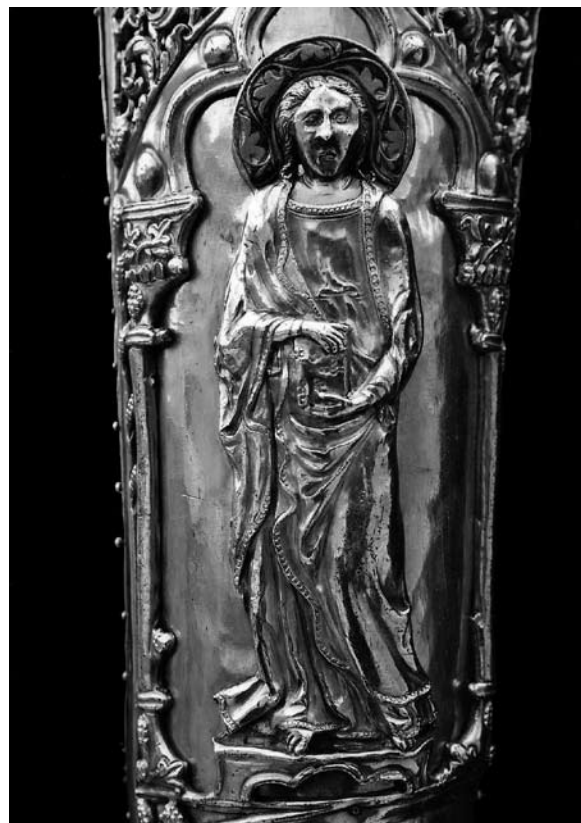
Sl. 23. Detalj sa svetačkim likom u gotičkoj niši brahijalija (XXXIX.) svete bokoktorske braće Petilovrijenaca iz Moćnika dubrovačke prvostolnice, Majstor fantastičnog bestijarija II, 14. st.