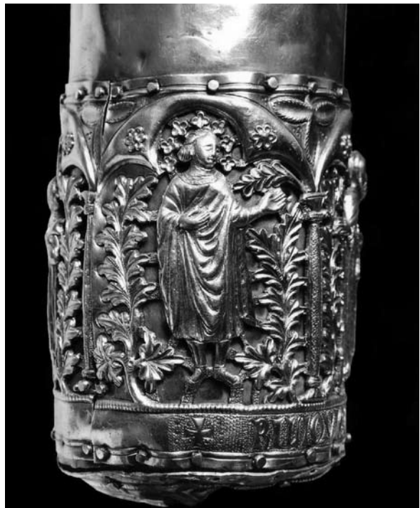
Sl. 10. Detalj s muškim likom s moćnika sv. Antuna Opata (XXXI.) iz Moćnika dubrovačke prvostolnice, Majstor fantastičnog bestijarija II, 14. st.