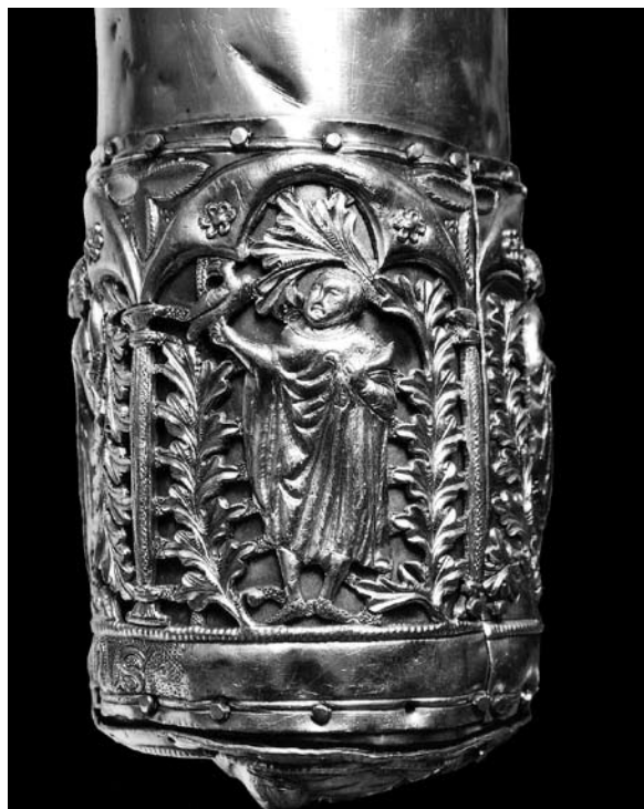
Sl. 12. Detalj sa sokolarom s moćnika sv. Antuna Opata (XXXI.) iz Moćnika dubrovačke prvostolnice, Majstor fantastičnog bestijarija II, 14. st.

ke Republike uz sokolarenje je vezan i običaj darivanja napuljskoga potkralja tijekom nekoliko stoljeća. 10 U srednjem vijeku sokol se katkada prikazivao kako komada zečeve, koji su simbol bluda, pa bi sokol u tom slučaju simbolizirao pobjedu nad seksualnom željom, odnosno nad napasti kojoj je sv. Antun Opat bio izložen u pustinji Natronu. Sokolar drži u ruci pticu koju je uhvatio sokol, prekinuvši ulogu posrednika između neba i zemlje. 11 Alegorijski lik djevojke s pet zvijezda iznad glave svjedoči o rafiniranom gotičkom likovnom jeziku Dubrovnikâ tog vremena. Djevojka je prikazana u dugoj gotičkoj haljini i kose upletene oko ušiju, po francuskoj modi prve četvrtine XIV. stoljeća. 12 Možda se radi o simbolu prve Eve i istočnoga grijeha ispod stabla svijeta. Kršćanstvo je taj simbol proširilo na križ, načinjen od drva stabla spoznaje dobra i zla. Bizantska liturgija i dandanas, na dan slavljenâ Svetog križa opjevava drvo života zasađeno na Križnome putu, stablo na kojemu Kralj stoljećima radi na našem spasenju, stablo koje se, izlazeći iz dubine zemlje, i posvećuje sve do granica svemira. Velika originalnost judeokršćanstva sastoji se u transfiguraciji povijesti u teofaniju i sublimirani simbolički rječnik simbola. 13