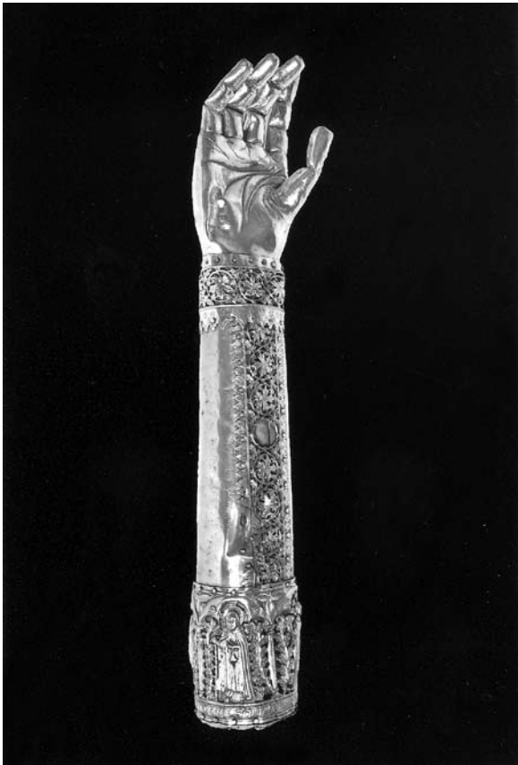
Sl. 7. Moćnik ruke sv. Antuna Opata (XXXI.) iz Moćnika dubrovačke prvostolnice, Majstor fantastičnog bestijarija II, 14. st.

carskog orla Žigmunda Luksemburškog), svetački lik i fantastični lik s ljudskom glavom, lavljim šapama i orlovim krilima. U posljednjem nizu nalaze se: fantastično biće slično zmaju, evanđelist, prikaz lava, 7 evanđelist, orao i svetica s križem. Zapravo, dubrovački je zlatar prikazao četiri simbola evanđelista, četiri lika evanđelista, pet likova fantastičnih životinja, jednog heraldičkog orla, dva muška i dva ženska svetačka lika. Na dnu brahijalija je srebrna pločica s natpisom: +MANVS MARIAE MAGDALENÆ+ . Nažalost, donji je medaljon izgubljen i zamijenila ga je ravna pločica sa žigom sv. Vlaha i žigom dubrovačkog zlatara Pava Percera (PP), koji je 1779. obavio popravak moćnika prije ukidanja samostana sv. Klare. 8 Prijenos umjetnina iz samostana sv. Klare u dubrovačku prvostolnicu zbio se 31. listopada 1806. godine. 9