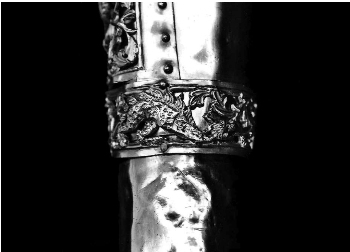
Sl. 22. Detalj brahijalija s motivom zmaja (XXXIX.) svete bokokotorske braće Petilovrijevnaca iz Moćnika dubrovačke prvostolnice, Majstor fantastičnog bestijarija II, 14. st.