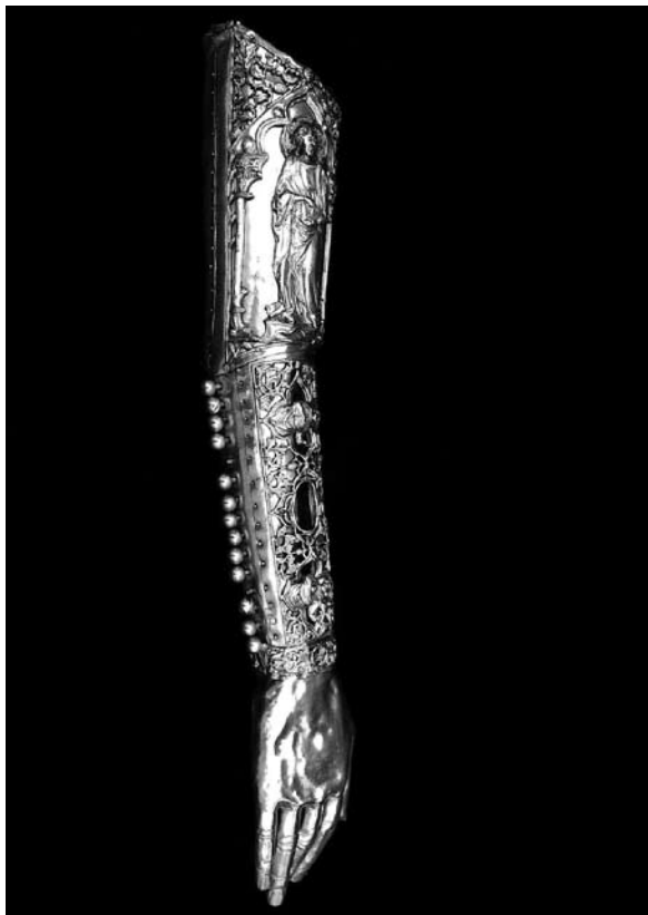
Sl. 18. Brahijalij (XXXIX.) svete bokokotorske braće Petilovrijevnaca iz Moćnika dubrovačke prvostolnice, Majstor fantastičnog bestijarija II, 14. st.

“Nel bosco senza foglie cacciando una perdice molto stanca, saltommi'nanzi una lepre bianca.