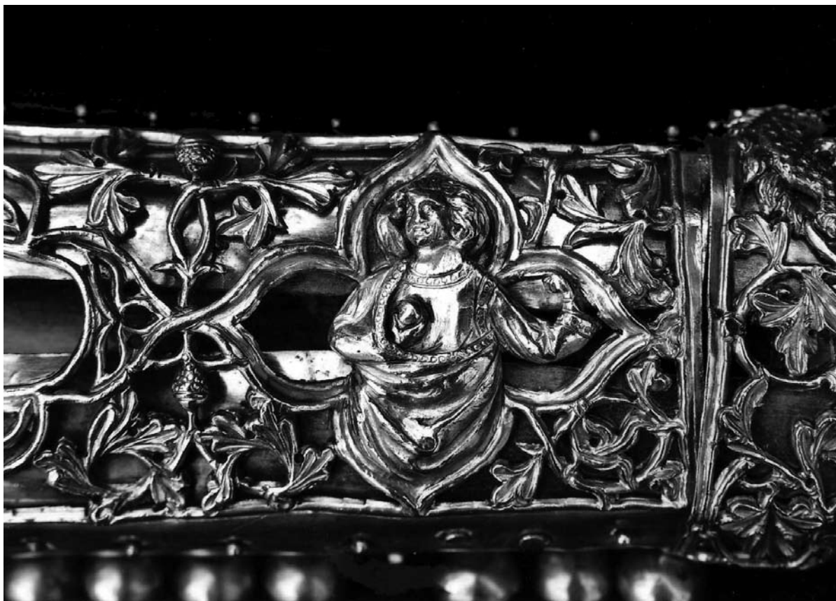
Sl. 21. Detalj sa svetačkim likom brahijalija (XXXIX.) svete bokokotorske braće Petilovrijenaca iz Moćnika dubrovačke prvostolnice, Majstor fantastičnog bestijarija II , 14. st.