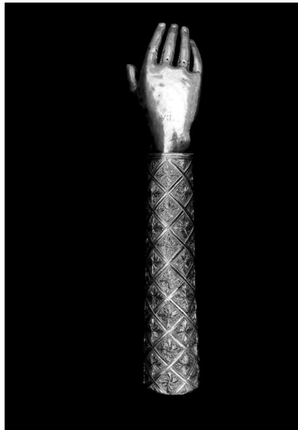
Sl. 17. Moćnik ruke sv. Vlaha (VII.) iz Moćnika dubrovačke prvostolnice, Majstor fantastičnog bestijarija II, 14. st.