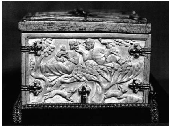
Sl. 14. Ljubavni par, Minnkästchen, Köln, St. Ursula