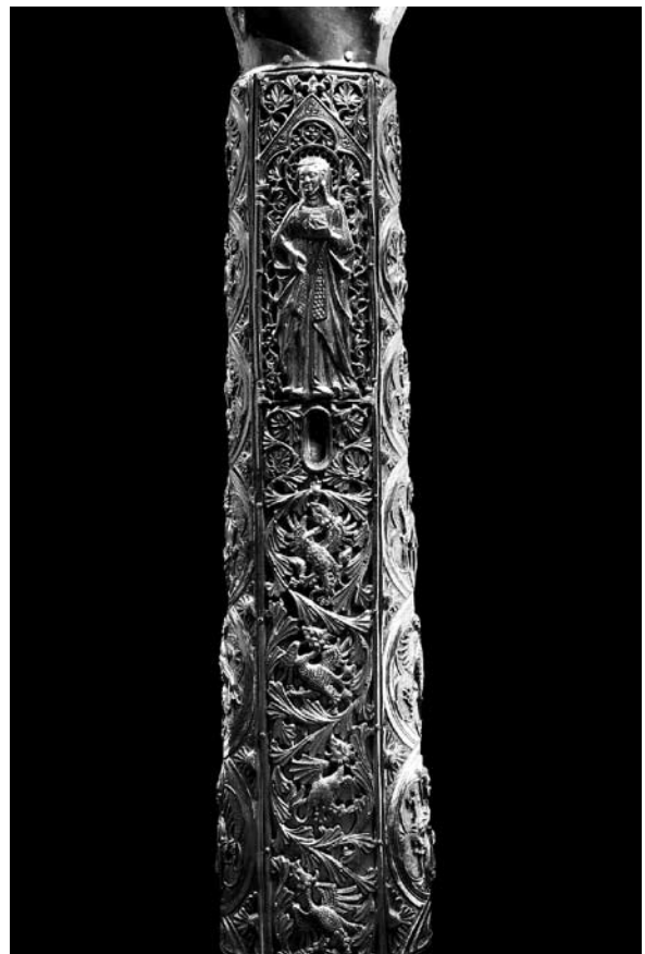
Sl. 2. Detalj moćnika ruke sv. Marije Magdalene (XXV.) iz Moćnika dubrovačke prvostolnice, Majstor fantastičnog bestijarija II, 14. st.