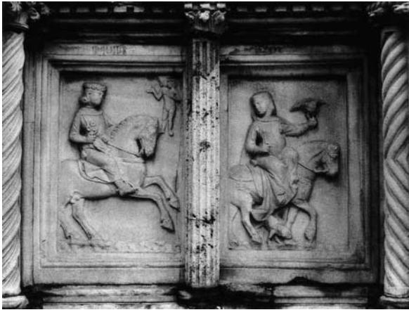
Sl. 13. Nicola i Giovanni Pisano, Alegorija mjeseca svibnja s Fontane Maggiore u Perugi