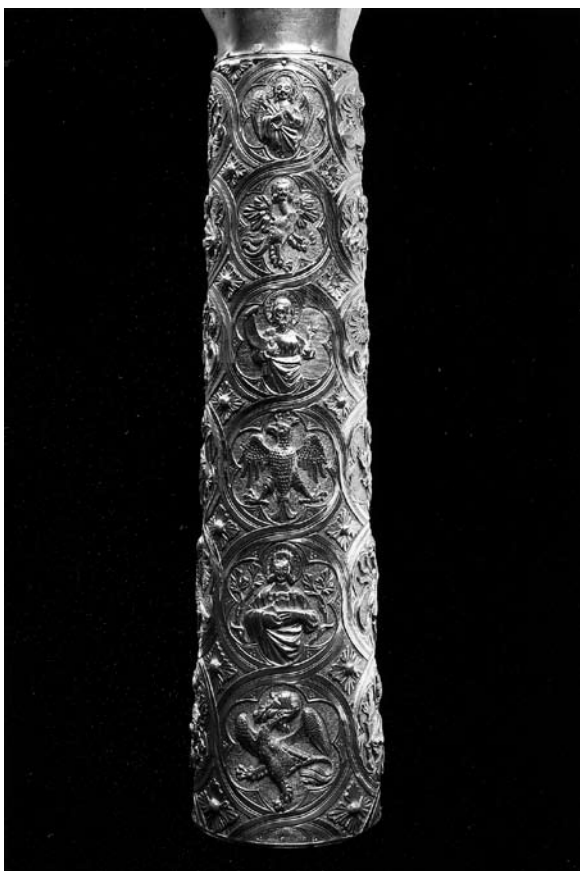
Sl. 4. Detalj moćnika ruke sv. Marije Magdalene (XXV.) iz Moćnika dubrovačke prvostolnice, Majstor fantastičnog bestijarija II, 14. st.