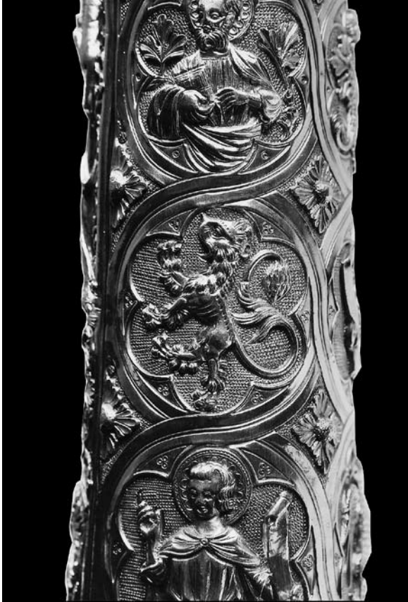
Sl. 6. Detalj moćnika s heraldičkim simbolom lava ruke sv. Marije Magdalene (XXV.) iz Moćnika dubrovačke prvostolnice, Majstor fantastičnog bestijarija II, 14. st.