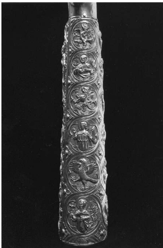
Sl. 5. Detalj moćnika ruke sv. Marije Magdalene (XXV.) iz Moćnika dubrovačke prvostolnice, Majstor fantastičnog bestijarija II, 14. st.