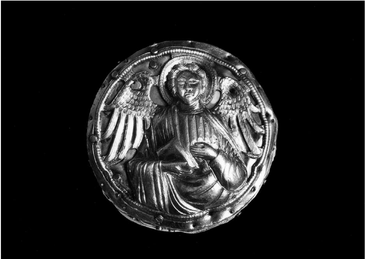
Sl. 8. Detalj s reljefom arhandela s moćnika ruke sv. Antuna Opata (XXXI.) iz Moćnika dubrovačke prvostolnice, Majstor fantastičnog bestijarija II, 14. st.