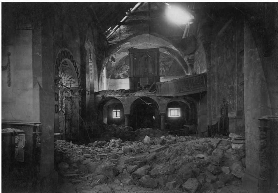
Unutrašnjost župne crkve Uznesenja Blažene Djevice Marije nakon potresa 9. 11. 1880., pogled prema koru