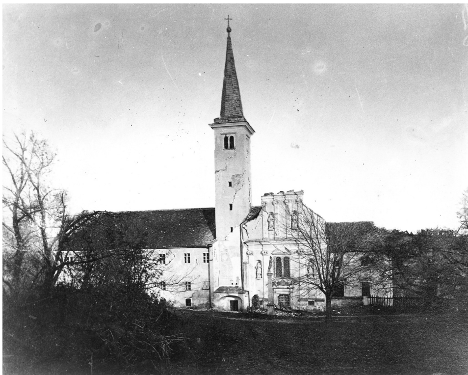
Ivan Standl, Glavno pročelje remetske župne crkve i dvora nakon potresa od 9. studenoga 1880.; Ministarstvo kulture Republike Hrvatske, Uprava za zaštitu kulturne baštine, inv. br.: 12620; neg.: II-9974

je kako je potres bio tako snažan da nije mogao ostati stajati na nogama, te da se poslije urušavanja svoda digla prašina koja se sat vremena nije uspjela do kraja slegnuti. 6