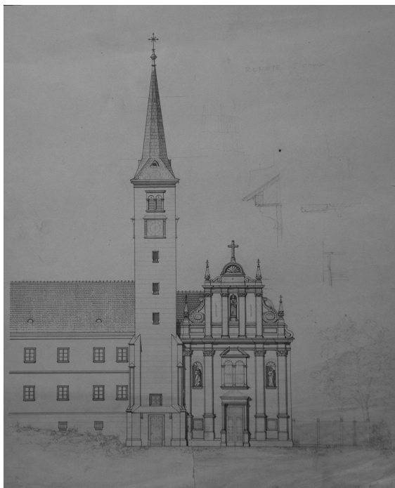
Herman Bollé, Projekt za restauraciju glavnog pročelja remetske župne crkve, 1882.; NAZ, Zbirka građevnih nacрта, sign. II-51

u kratko vrijeme pokriti, pa je novac posuđen od Zemaljske vlade, 47 te je u idućih nekoliko godina raspisivanjem poreza na župljane vraćan vladi sa 6% kamata. 48