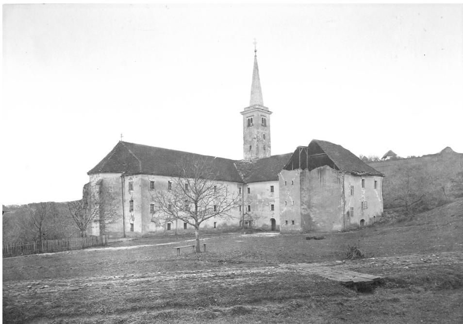
Ivan Standl, Začelje župne crkve i dvora u Remetama nakon potresa od 9. studenoga 1880.; Ministarstvo kulture Republike Hrvatske, Uprava za zaštitu kulturne baštine, inv. br.: 16564; neg.-

Vrlo brzo se pokazalo da se djelomično ipak radilo o pretjerivanju. Crkva je, kako je dijelom i spomenuto, doista bila jako oštećena, no zidovi su se dobro držali, orgulje su bile oštećene, no stajale su na koru, a samo svetište s oltarom Majke Božje ostalo je gotovo neoštećeno. 12 Stoga je i crkva, koja je isprva bila zatvorena, a misa se služila na otvorenom, 13 vrlo brzo postala ponovno dostupna znatiželjnicima koji su u nju počeli svraćati u sve većem broju, osobito nakon što je fotograf Ivan Standl, angažiran tjedan dana nakon potresa na izradi fotodokumentacije stradalih građevina u Zagrebu i okolici, 14 izradio niz fotografija remetske crkve koje su potom krajem 1880. bile objavljene u zagrebačkom Viencu. 15 Urušena crkva postala je, naime, svojevrsna atrakcija – građani se vikendom kolima vozili do Remeta i hodali po njezinoj uništenoj unutrašnjosti. 16 Osobito je velik broj znatiželjnika obilazio ruševine crkve i dvora na tradicionalni dan proštenja Zagrepčana u