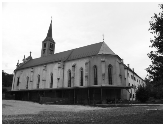
Bočno pročelje remetske crkve, današnje stanje