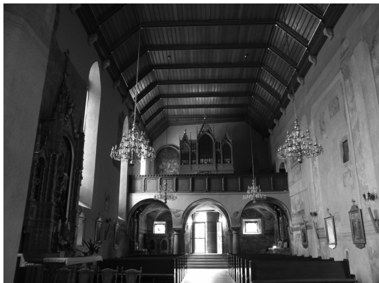
Unutrašnjost remetske crkve, današnje stanje