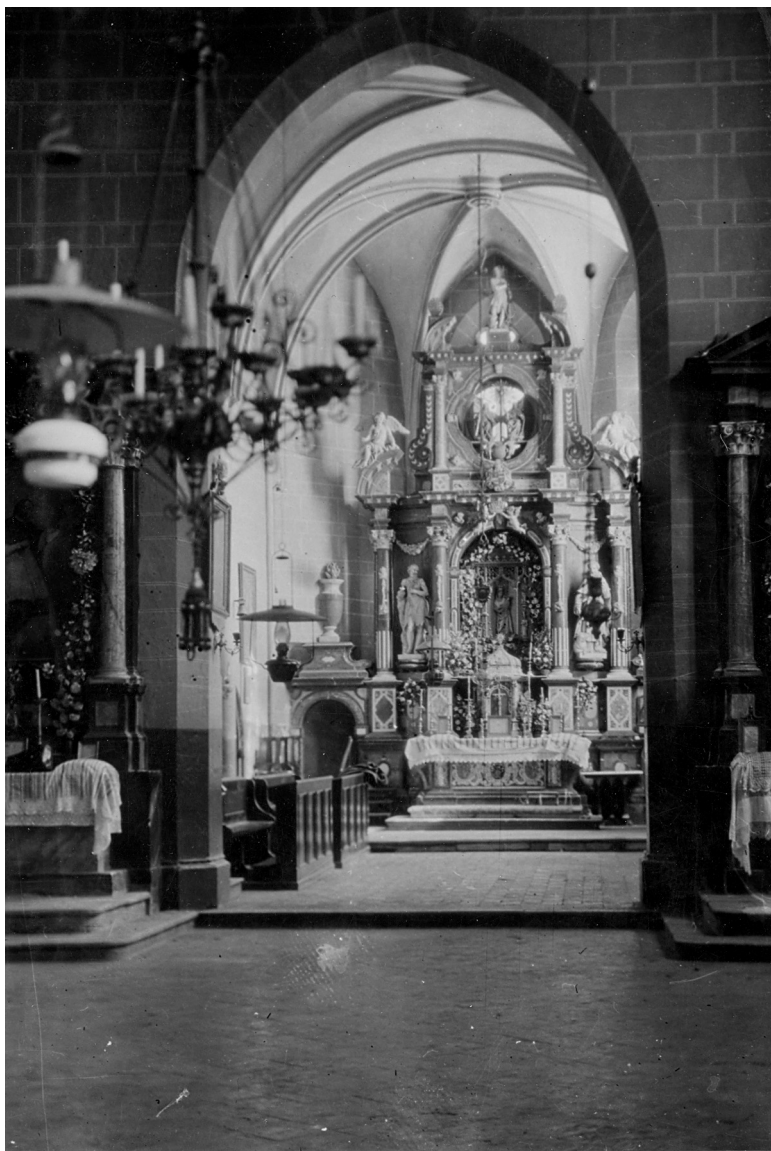
Trijumfalni luk i svetište remetske crkve oko 1938. godine; Ministarstvo kulture Republike Hrvatske, Uprava za zaštitu kulturne baštine, inv. br.: 866; neg.: /