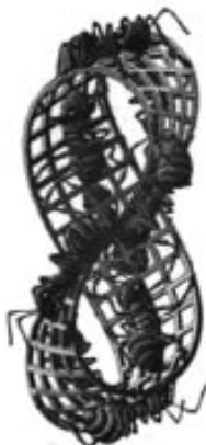
Möbiusova vrpца u umjetnosti - M. C. Escher (Povorka mrava)