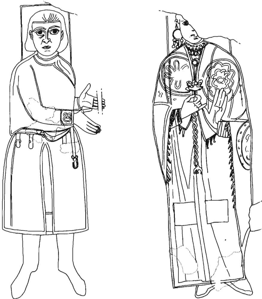
Sl. 3 Freska iz crkve Santa Maria Antiqua u Rimu (preuzeto iz Daim 2001)