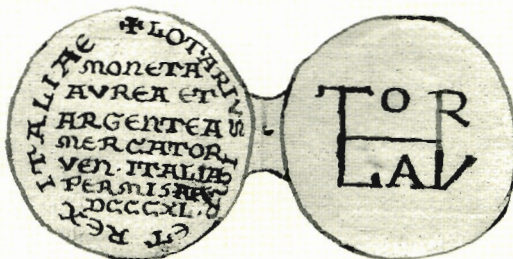
Sl. 11. A. Meneghetti, žeton s monogramom cara Lotara, AMZ E52164, crtež