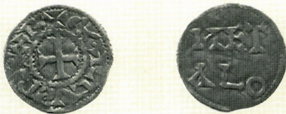
Sl. 6. Karlo III. Priprosti (898.-923.+929.), denar, AMZ E205