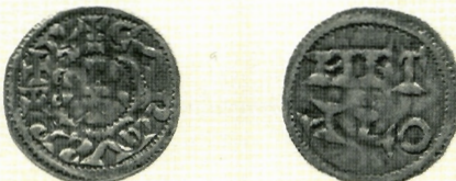
Sl. 7. Karlo III. Priprosti (898.-923.+929.), denar, AMZ E1015