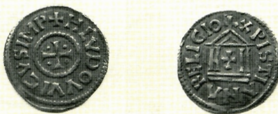
Sl. 8. Ljudevit II. (855.-875.), denar, AMZ E3166