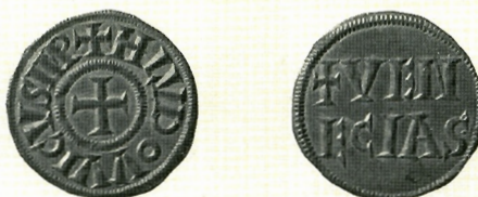
Sl. 9. Ljudevit I. Pobožni (814.-840.), denar, AMZ E24080