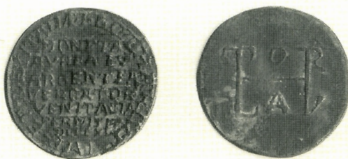
Sl. 10. A. Meneghetti, žeton s monogramom cara Lotara, AMZ E52164