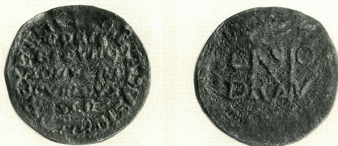
Sl. 12. A. Meneghetti, žeton s monogramom cara Konrada, AMZ E52165