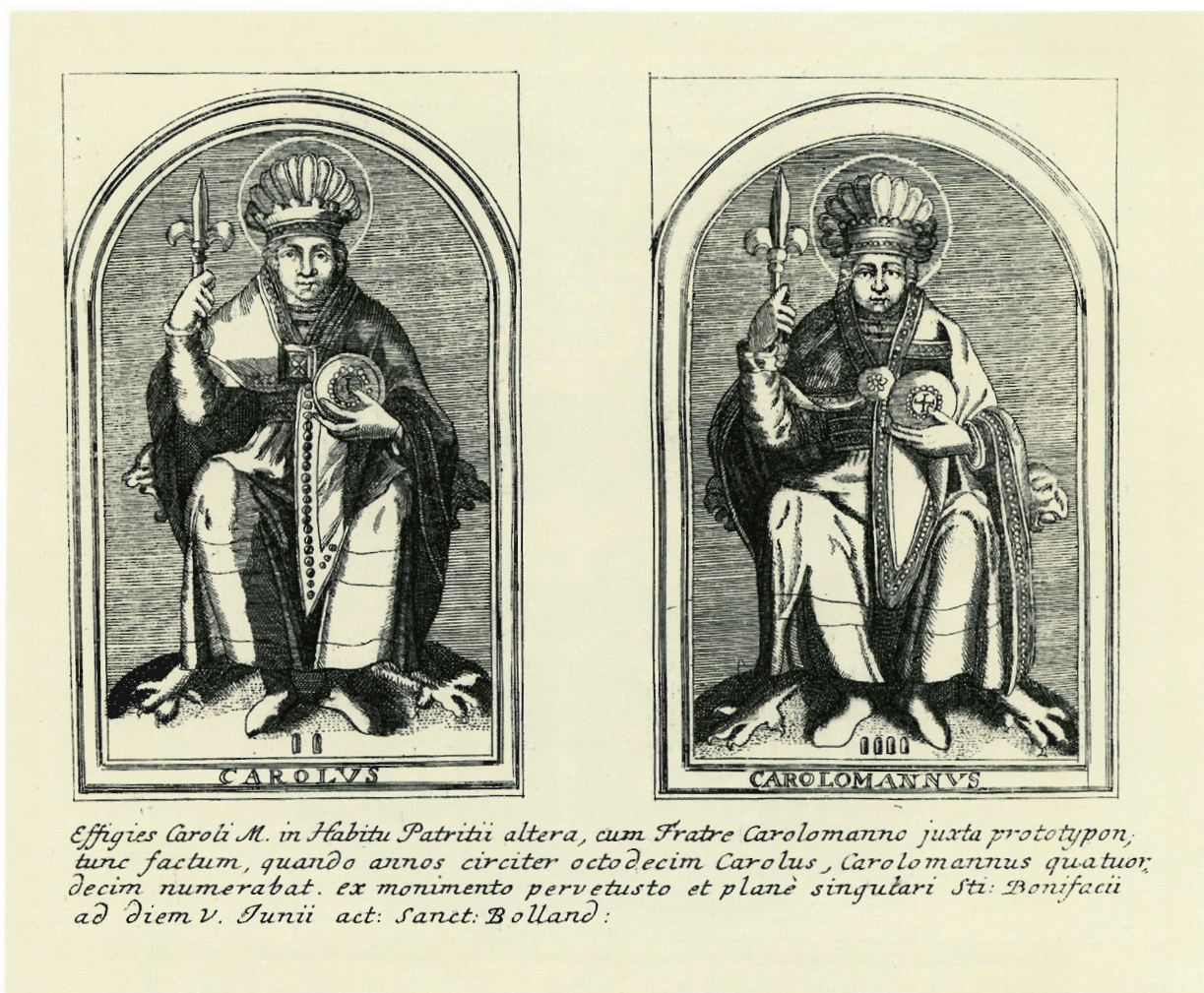
Effigies Caroli M. in Habitu Patritii altera, cum Fratre Carolomanno juxta prototypon, tunc factum, quando annos circiter octodecim Carolus, Carolomannus quatuordecim numerabat. ex monumento pervetusto et planè singulari Sti: Bonifacii ad diem V. Junii act: Sanct: Bolland: