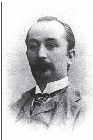
Dr. Emanuel Luxardo (1848. – 1905.)

Iz prikupljenog arhivskoga materijala te na osnovi još uvijek živih sjećanja sačuvanih diljem Dalmacije, u ovoj prigodi bit će prikazani samo osnovni biografski podaci i dan kratak osvrt na osobni doprinos izabranih.