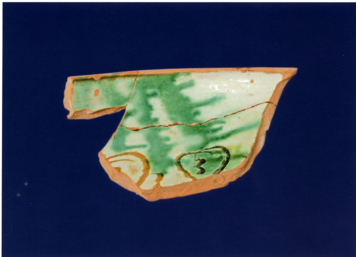
Sl. 6. Egejska keramika sa srcolikim ukrasom