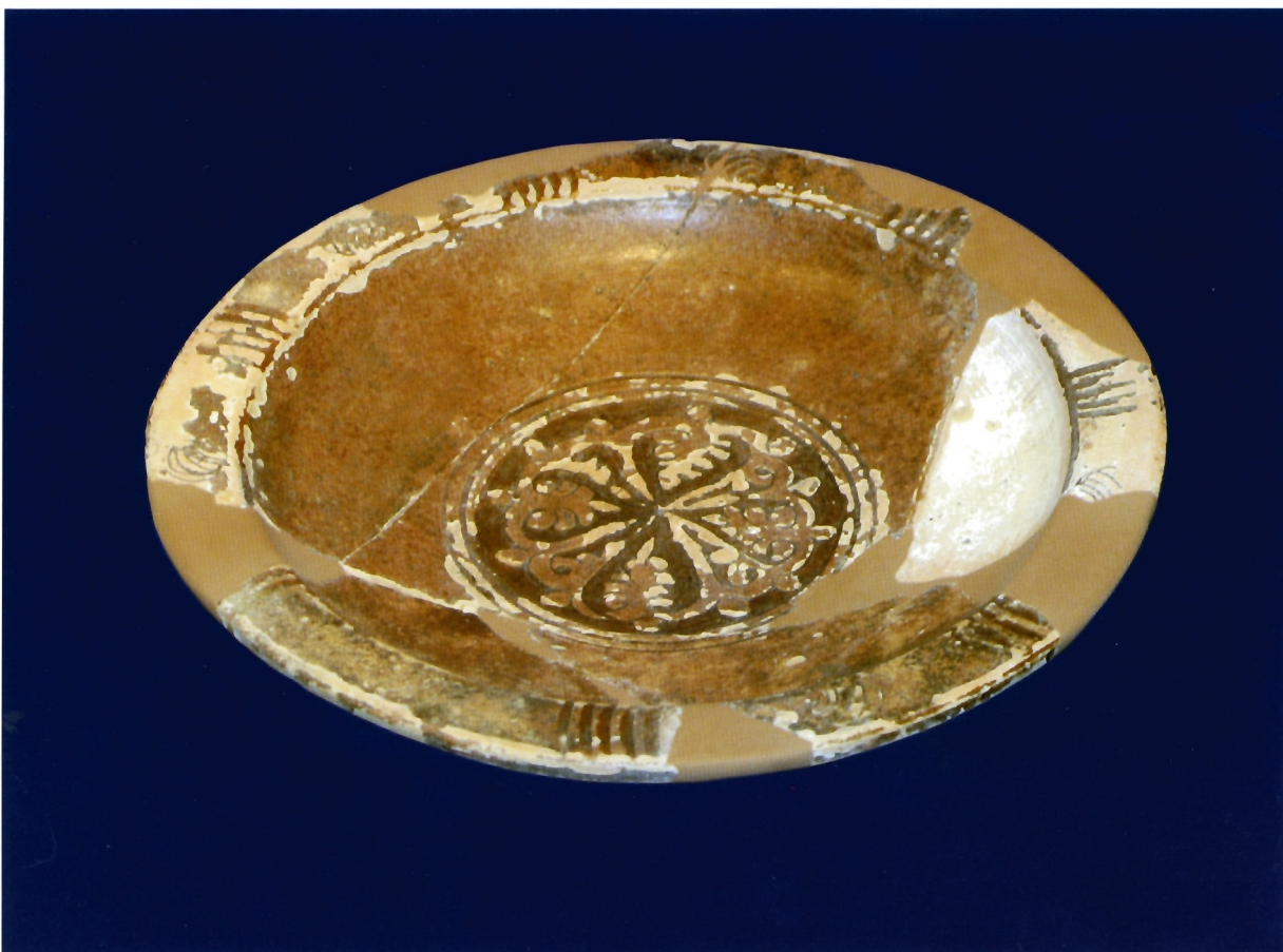
Sl. 2. Tanjur medaljonskog stila