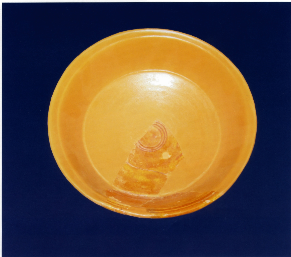
Sl. 9. "Roulette ware"