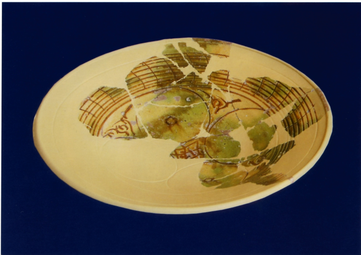
Sl. 5. Egejska keramika s urezanim sgraffito ukrasom