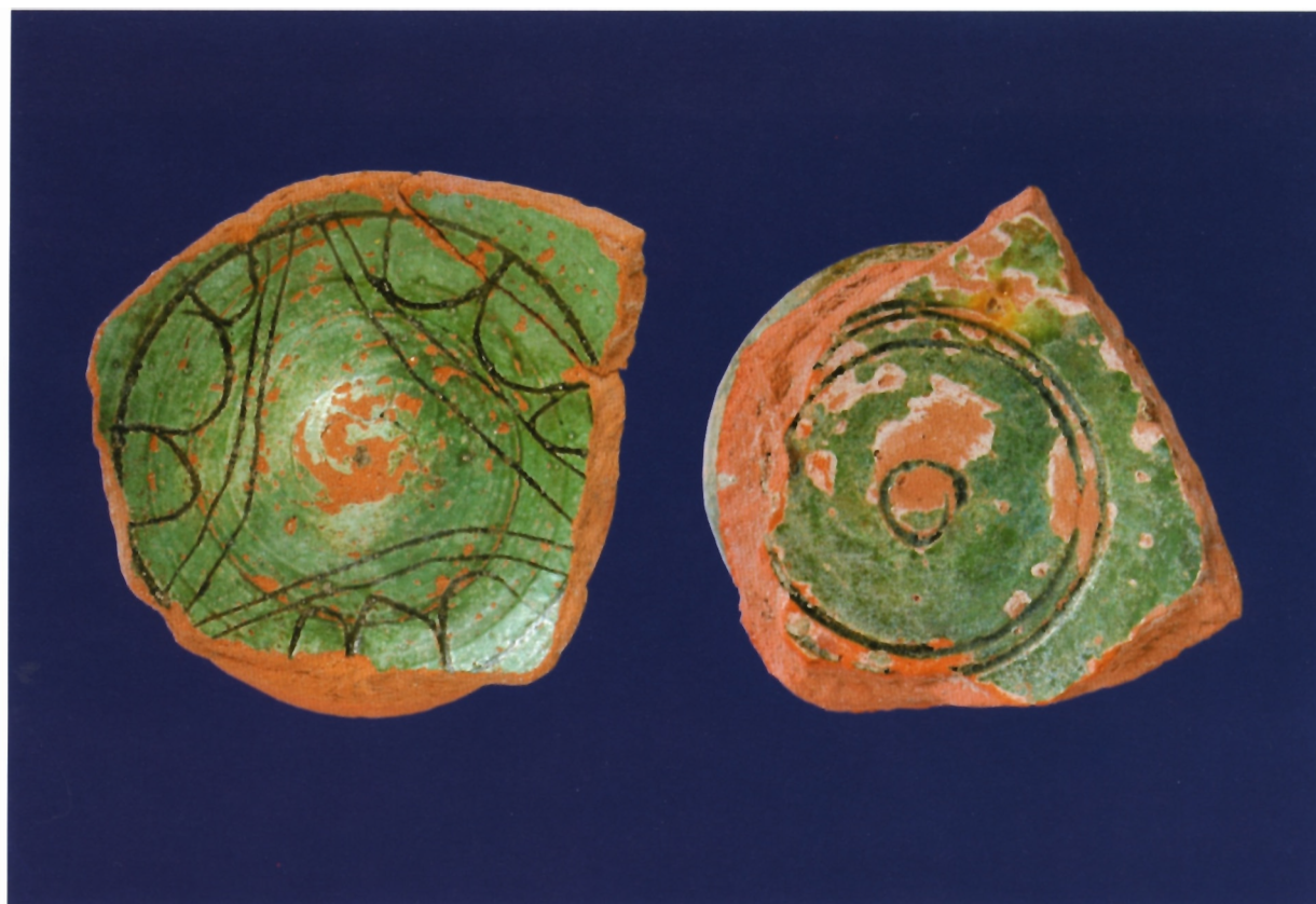
Sl. 8 i 8a. Primjerci rane venetske keramike ("spirale e cerchio" i "San Bartolo")