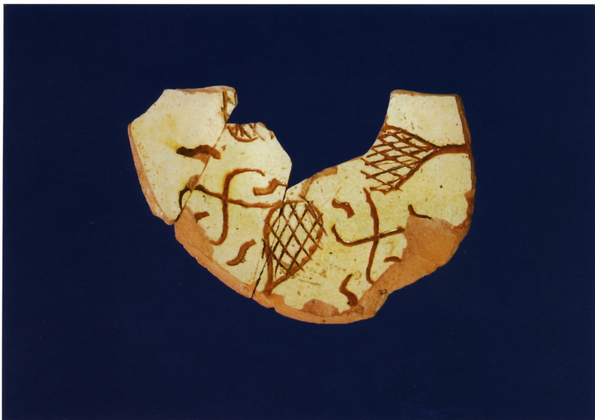
Sl. 3. Bizantska keramika sa široko urezanim ukrasom (Incised ware)