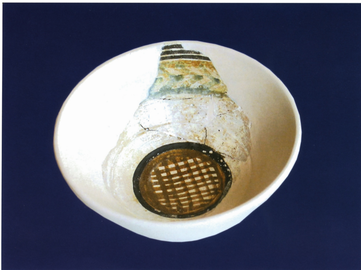
Sl. 7. Protomajolika