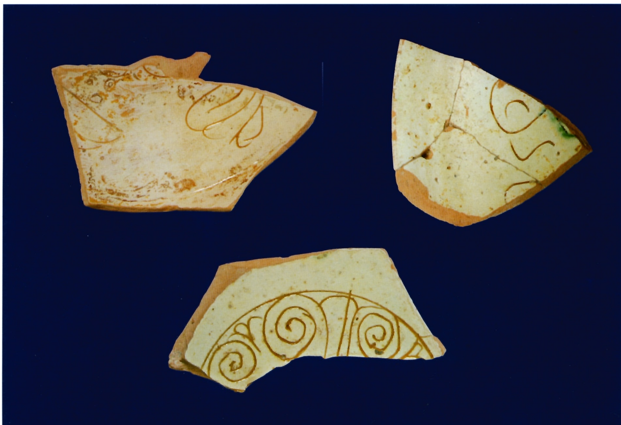
Sl. 1a - c. Ulomci keramike tzv. spiral style