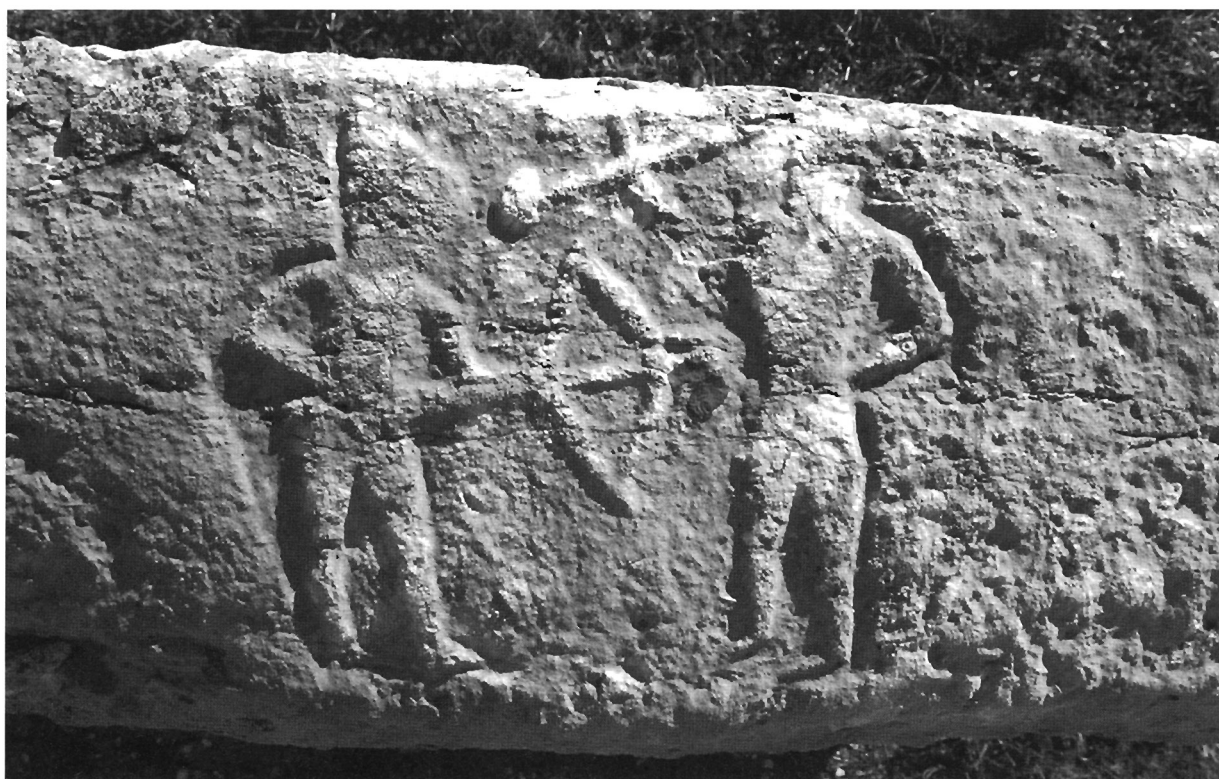
Sl. 4. Prikaz dvovoja na bočnoj strani stečka kod crkve sv. Luke u Trnbusima