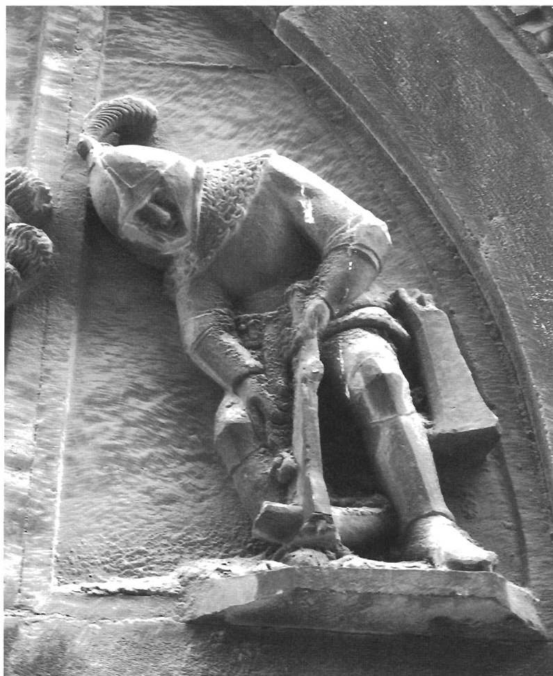
Sl. 3. Prikaz balistarija na portalu palače Šižgorić u Šibeniku, 15. stoljeće