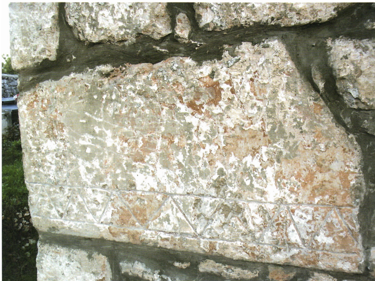
Sl. 30. Kljenak, ulomak s bordurom