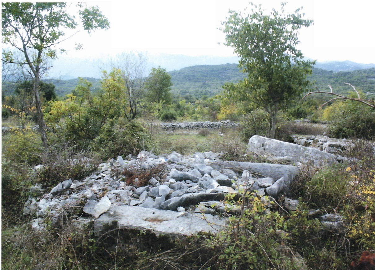
Sl. 12. Ravča, manja gomila, pogled sa sjevera