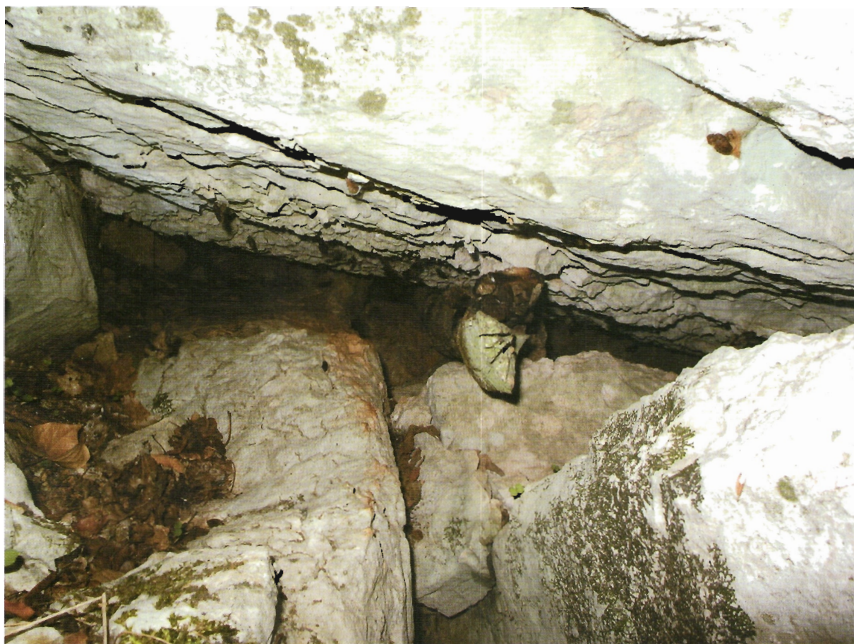
Sl. 37. Kljenak, kamenolom kod Jurjevića kuća, oblica po dužini