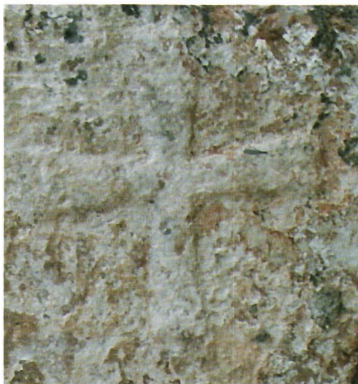
Sl. 33. Kljenak, križ sa zapadne strane