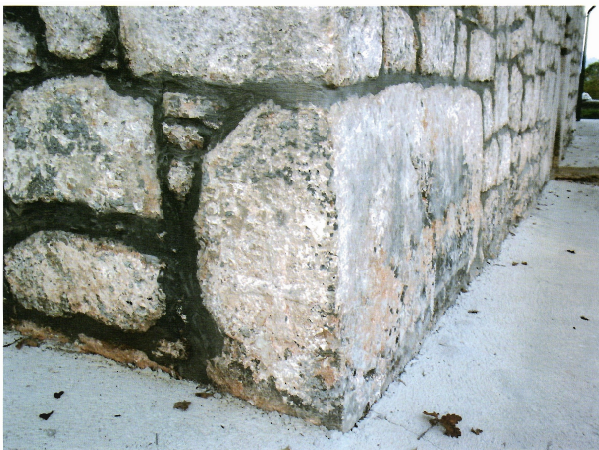
Sl. 32. Kljenak, južni temelji crkve s lijeve strane