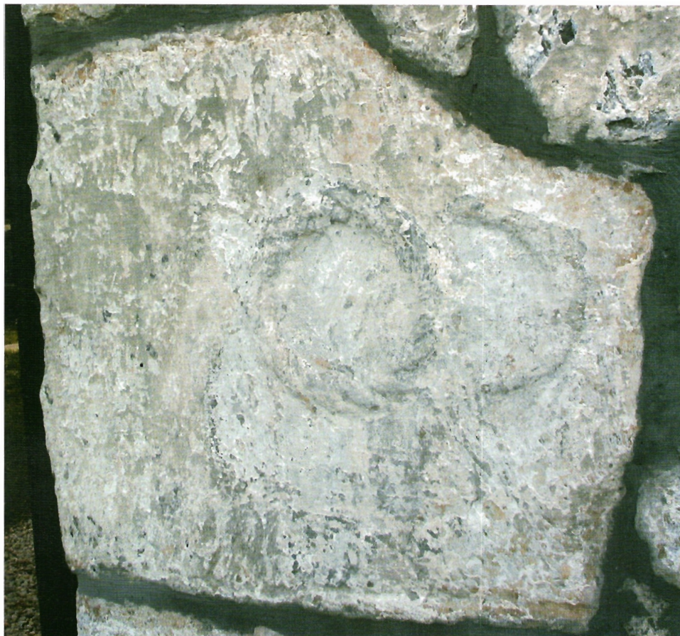
Sl. 21. Kljenak, ulomak gore lijevo na istočnoj strani apside