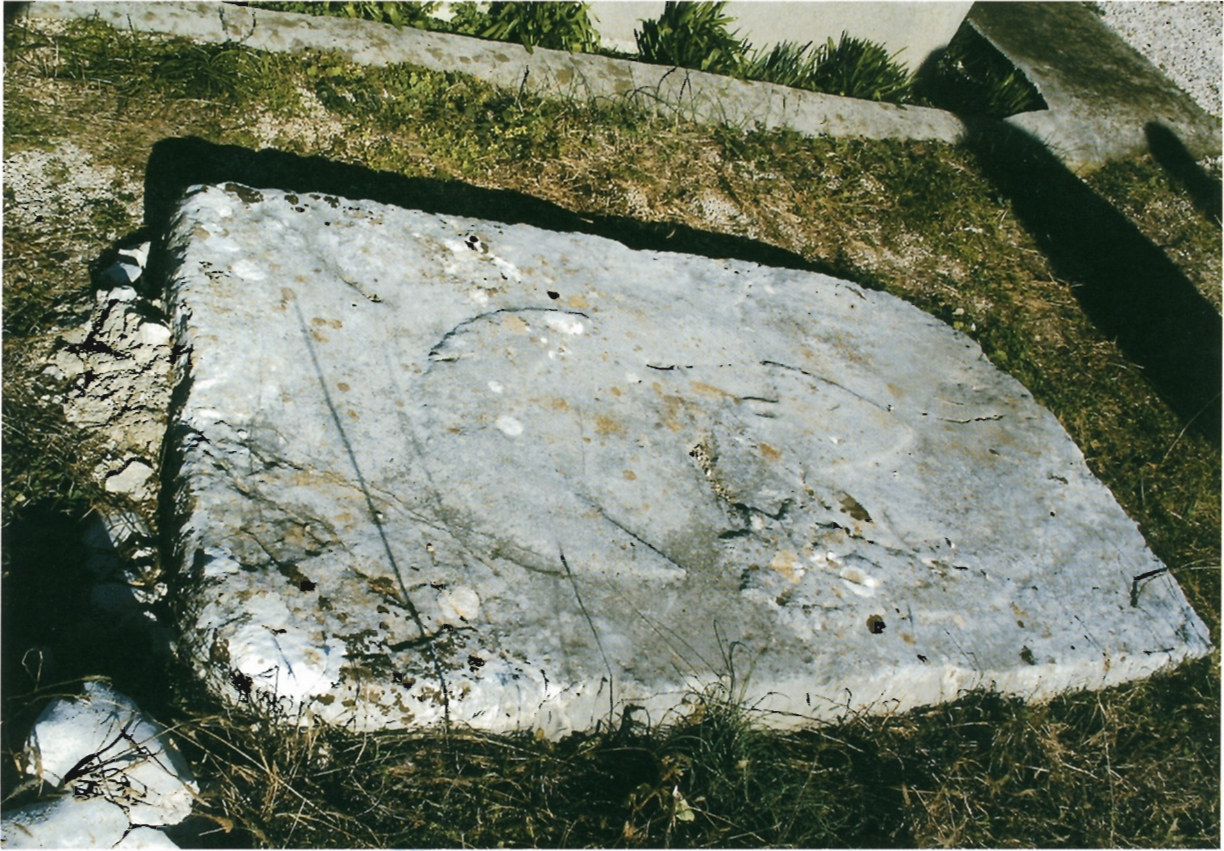
Sl. 7. Ravča, visoka ploča udaljenija od crkve