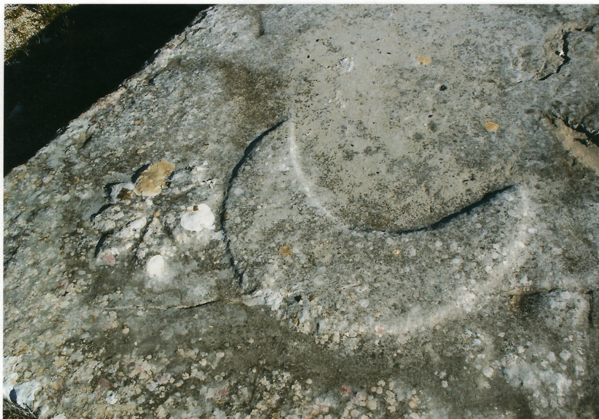
Sl. 6. Detalj