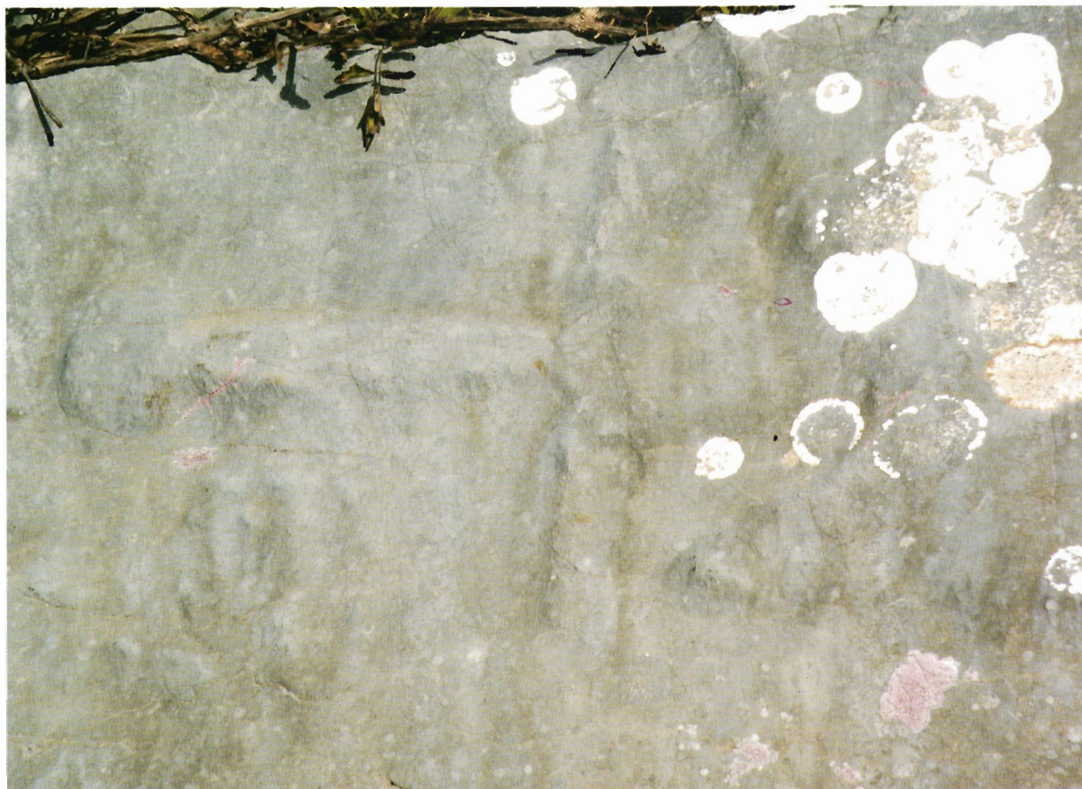
Sl. 15. Ravča, prikaz mača s manje gomile