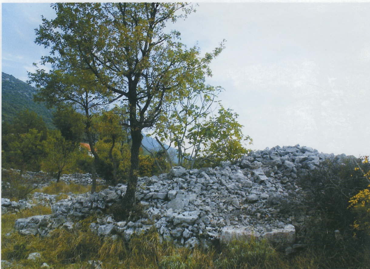
Sl. 9. Ravča, veća gomila, pogled sa zapada