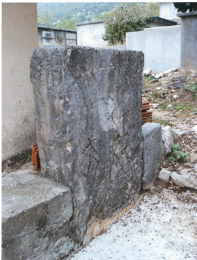
Sl. 2. Ravča, kamik desno od vrata mrtvačnice