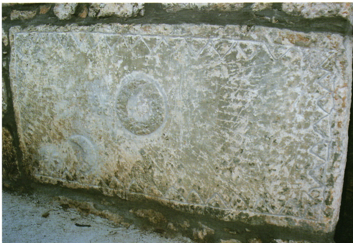
Sl. 31. Kljenak, ploča s cik-cak bordurom