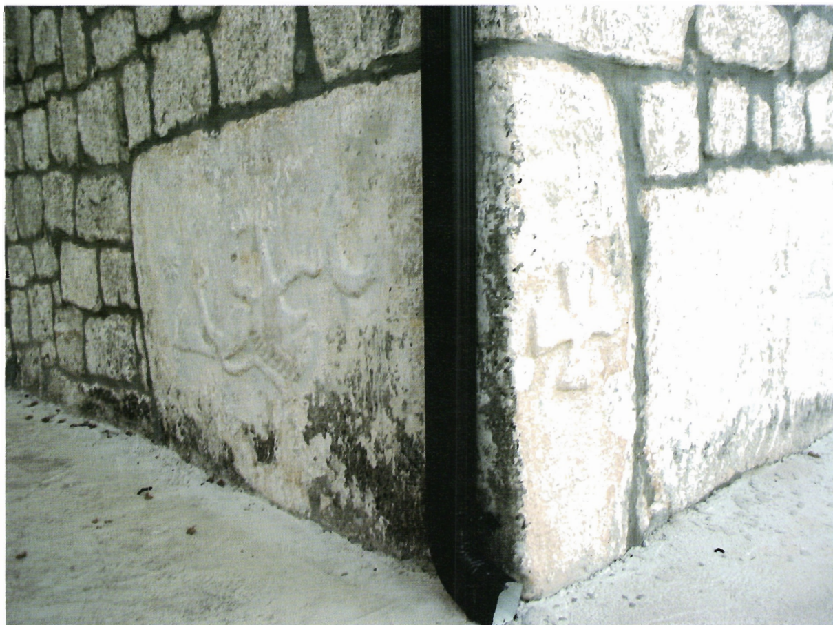
Sl. 17. Kljenak, crkva Svih svetih, jugoistočni kut apside