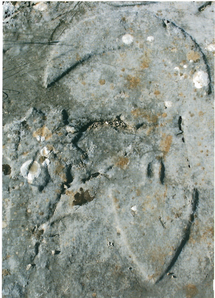
Sl. 8. Detalj