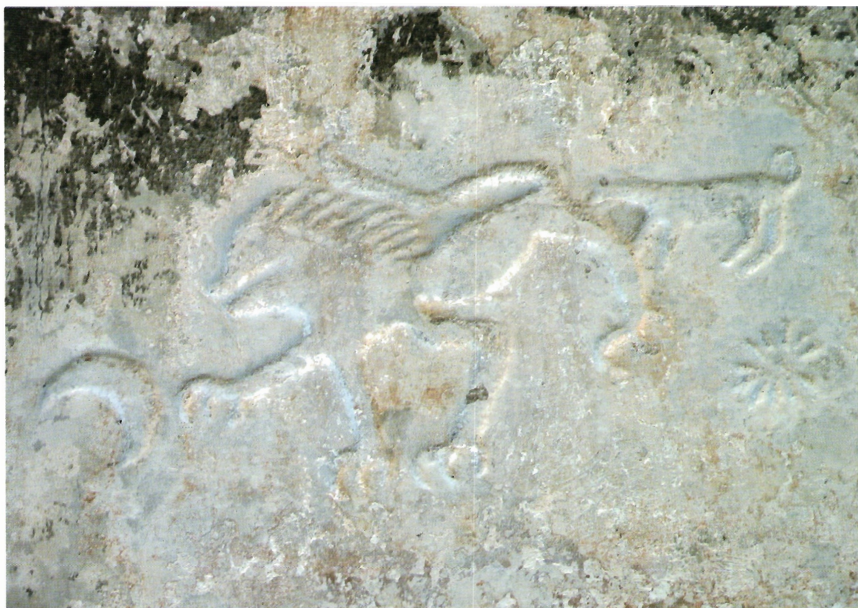
Sl. 18. Kljenak, pravilno okrenut detalj s prethodne slike