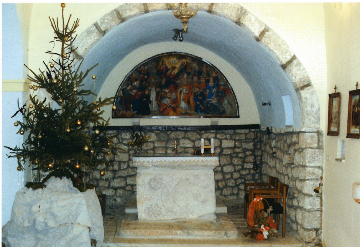
Sl. 3. Kljenak, crkva Svih svetih, oltar