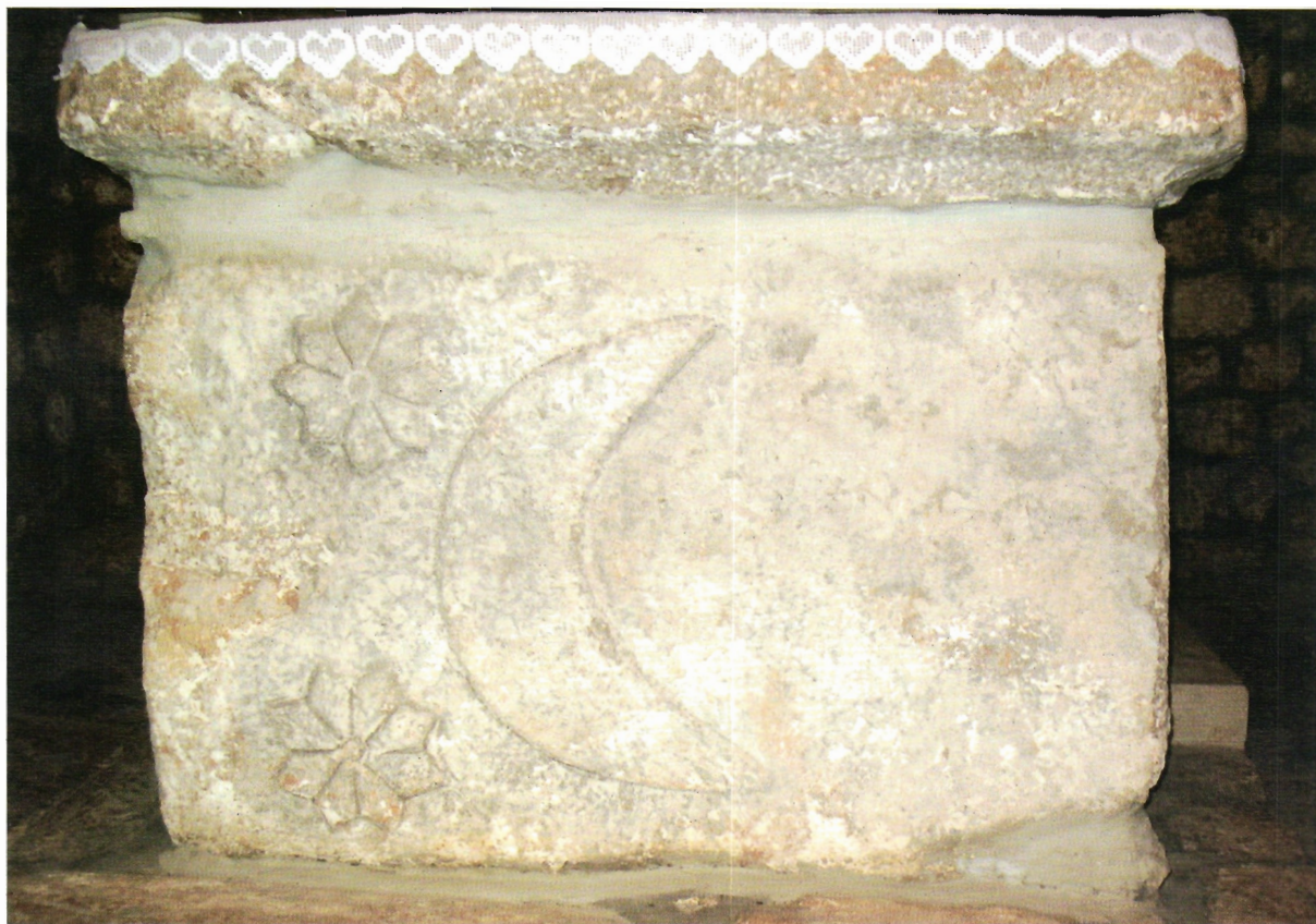
Sl. 34. Kljenak, crkva Svih svetih, prednja ploča oltara