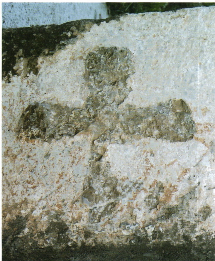
Sl. 29. Kljenak, pravilno okrenut detalj križa