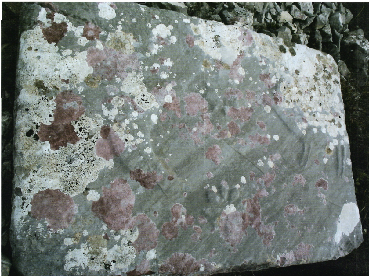
Sl. 13. Ravča, s manje gomile