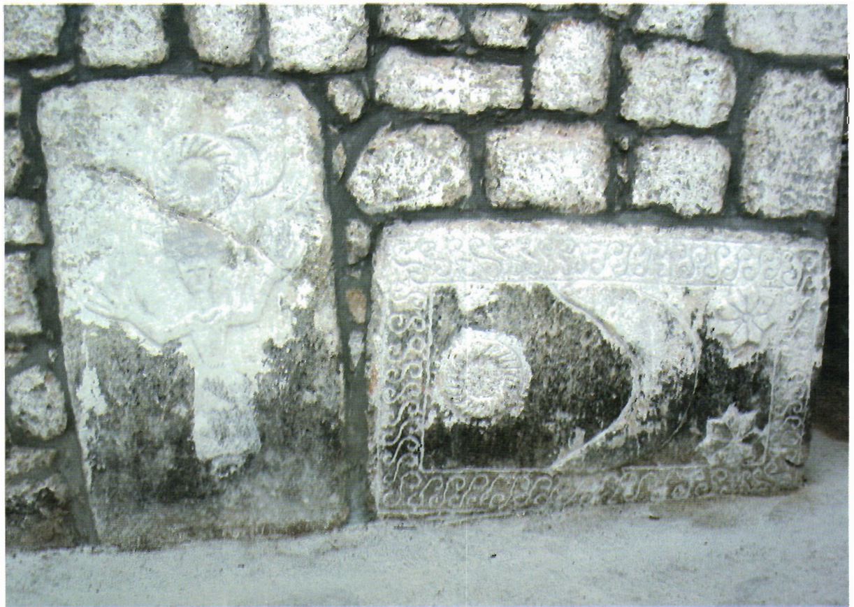
Sl. 26. Kljenak, crkva Svih svetih, sjeverna strana