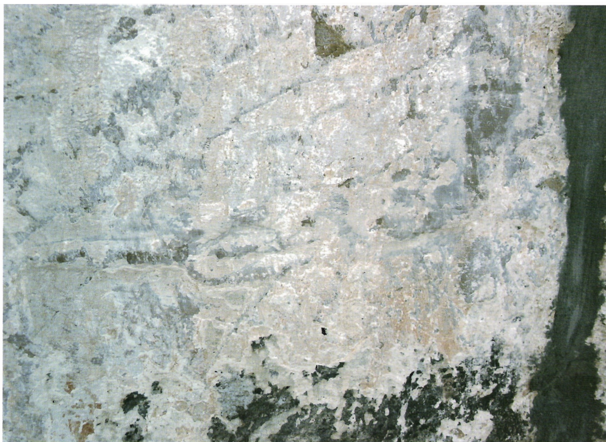
Sl. 24. Kljenak, detalj s prikazom trozubca i križa