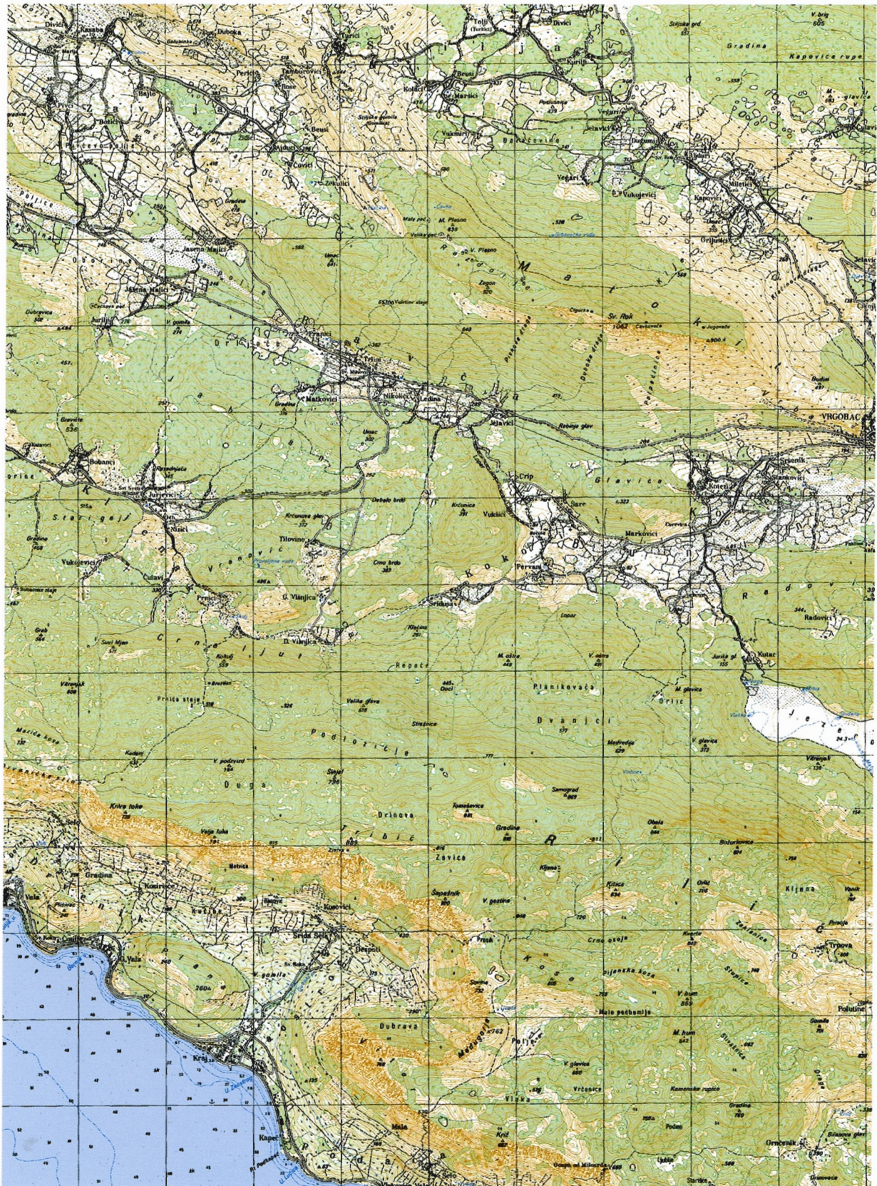
Karta vrgoračkog područja