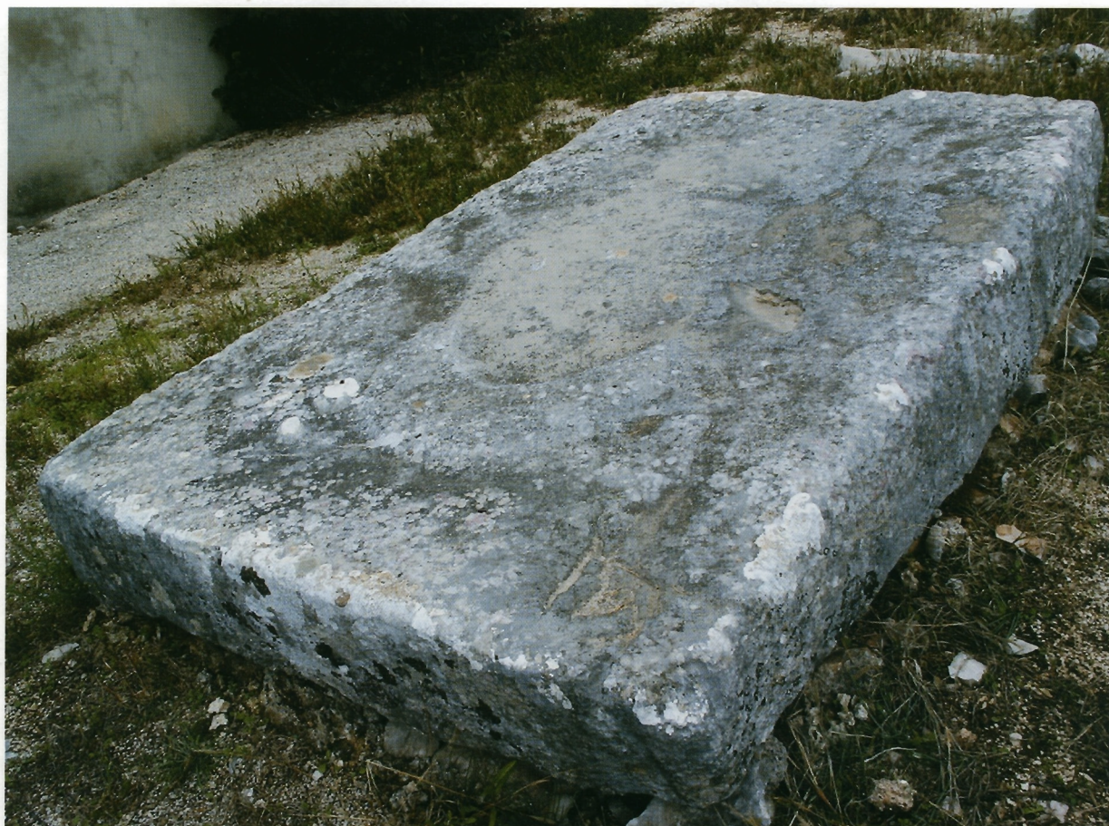
Sl. 5. Ravča, nizak sanduk u blizini crkve