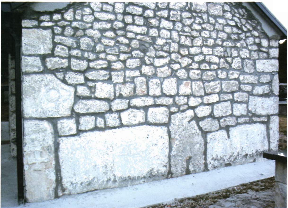
Sl. 20. Kljenak, apside