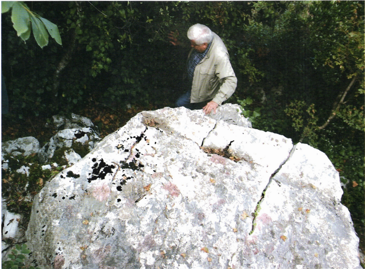
Sl. 35. Kljenak, kamenolom kod Jurjevića kuća