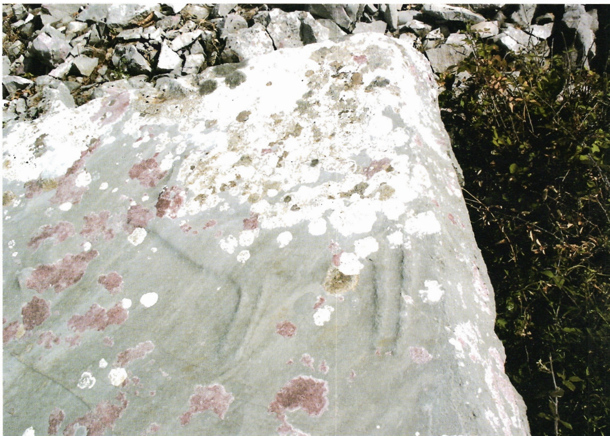
Sl. 14. Ravča, s manje gomile, detalj jelena