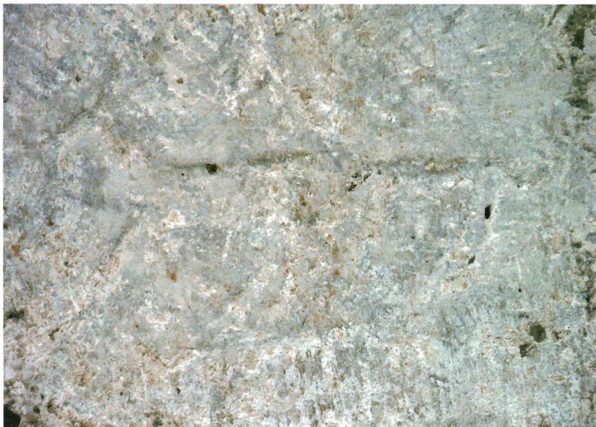
Sl. 22. Kljenak, detalj s prikazom jelena kojeg lovi pas