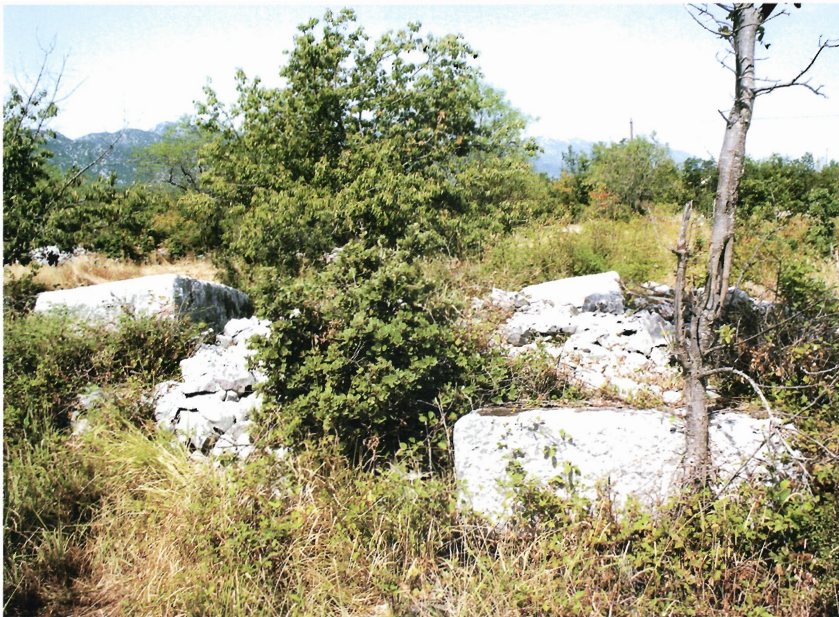
Sl. 11. Ravča, manja gomila, pogled s istoka