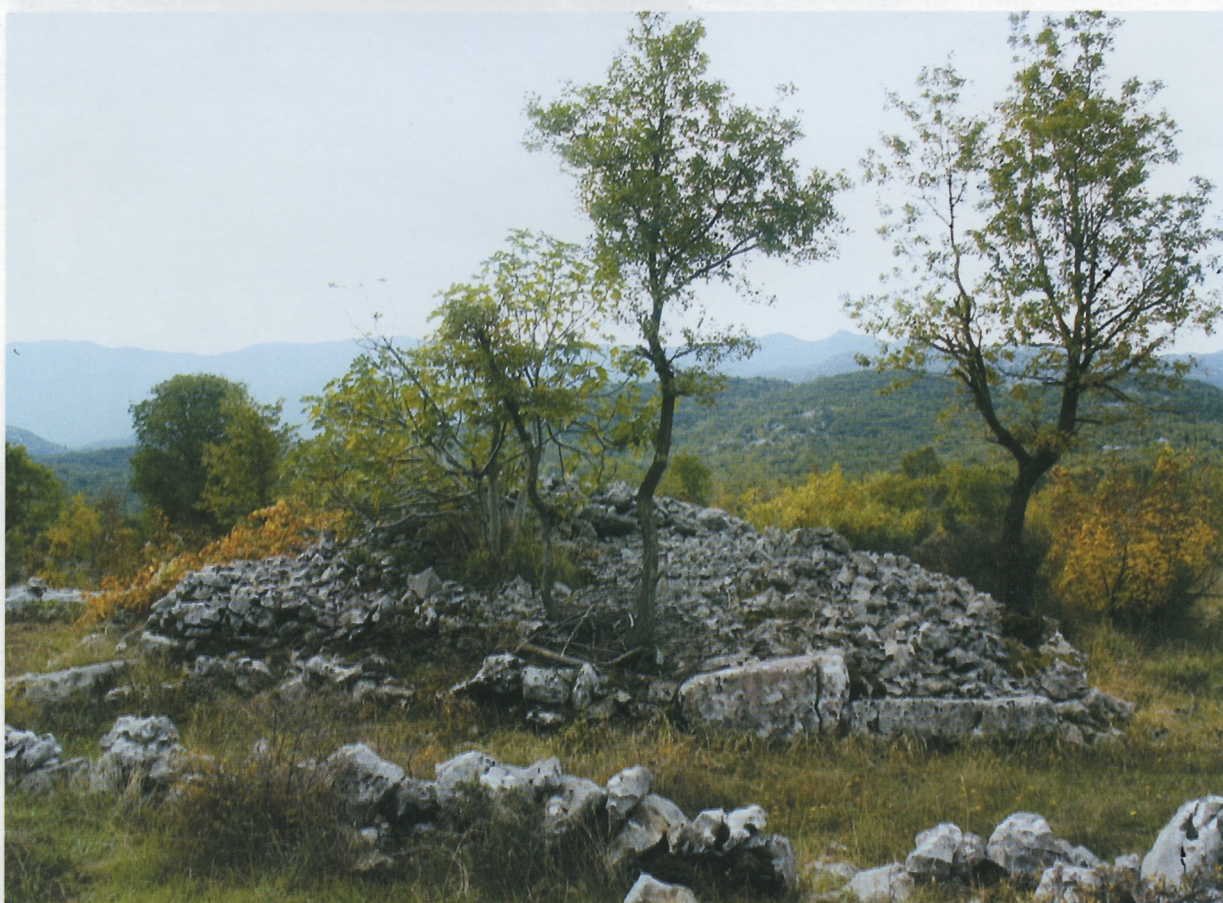
Sl. 10. Ravča, veća gomila, pogled sa sjevera