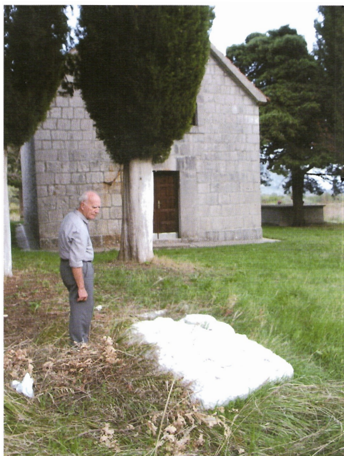
Sl. 38. Kokorići, sanduk – oltar ispred crkve sv. Jure