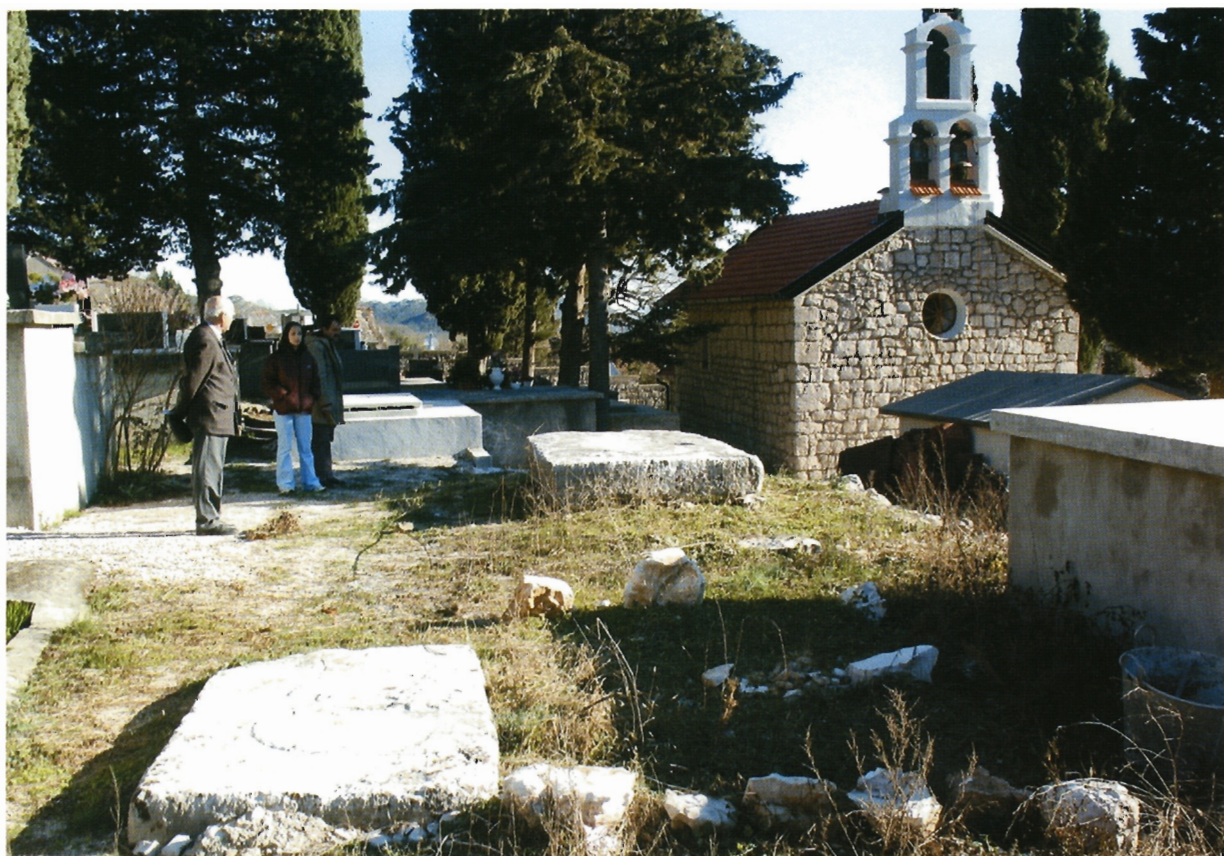
Sl. 4. Ravča, groblje pokraj crkve sv. Mihovila