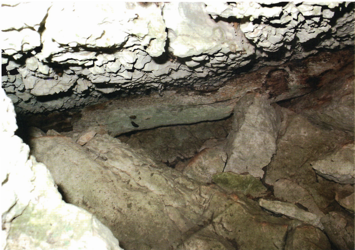
Sl. 36. Kljenak, kamenolom kod Jurjevića kuća, oblica u presjeku