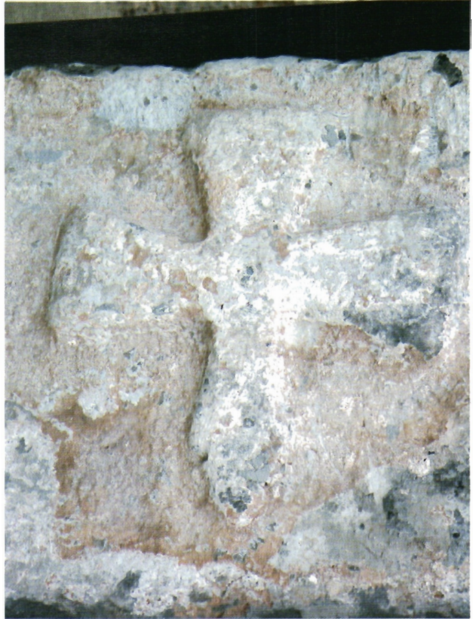
Sl. 19. Detalj križa pravilno okrenut s istočne stane apside