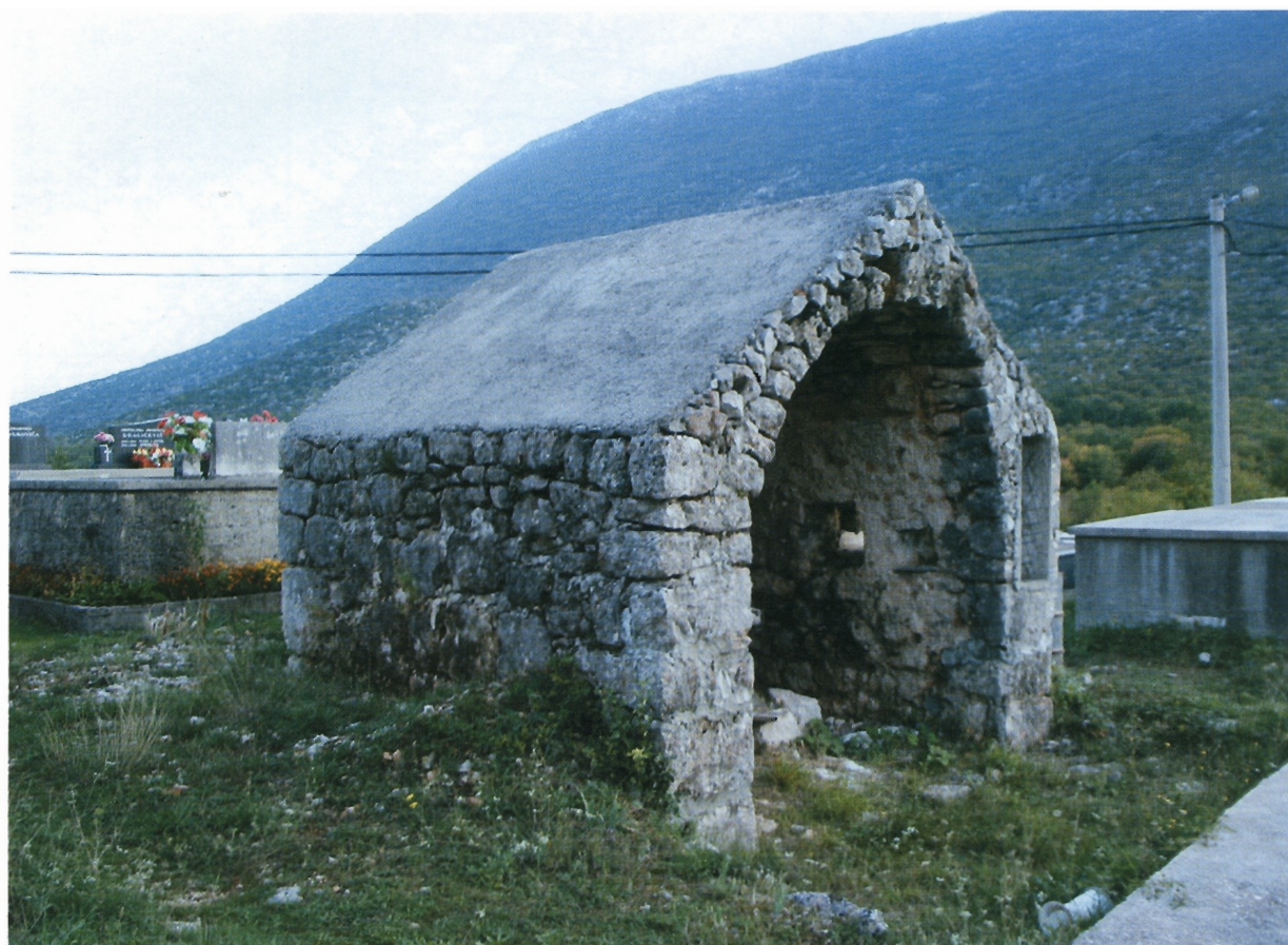
Sl. 1. Prapatnice, kapela s tri zida i jednim oltarićem