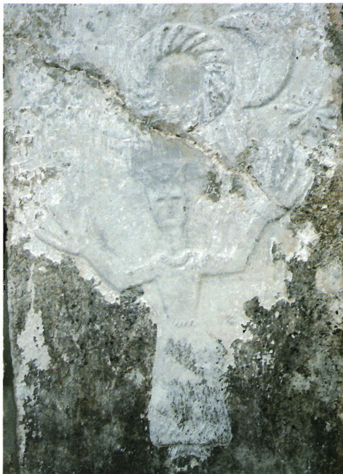
Sl. 27. Kljenak, figuralni prikaz na sjevernoj strani crkve