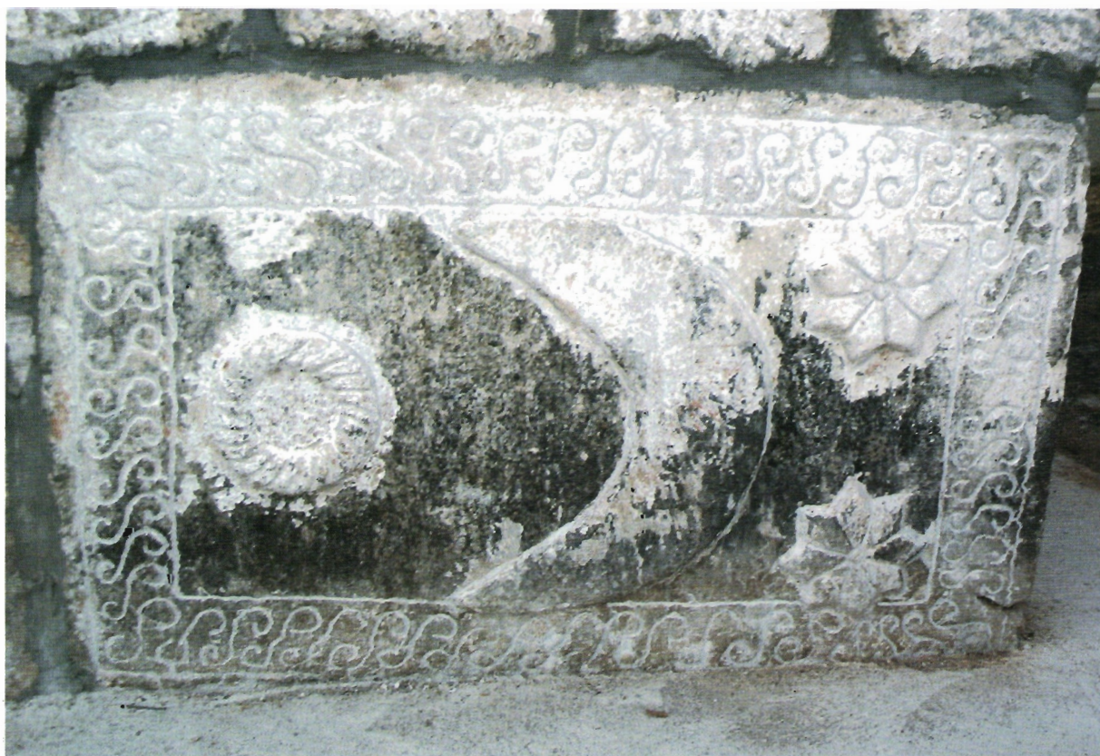
Sl. 28. Kljenak, desni sanduk sa sjeverne strane