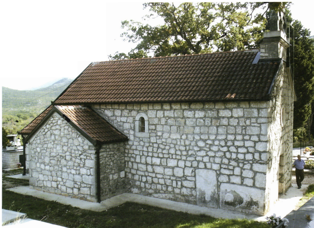
Sl. 16. Kljenak, crkva Svih Svetih, pogled sa sjeveroistoka