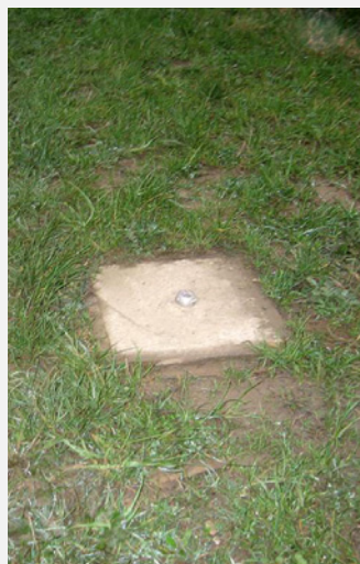
Slika 2.1. Stabilizacija geodetske točke

Geodetske točke obično su udaljene tridesetak metara od gradilišta u obradivim poljoprivrednim površinama, npr. u Slavoniji, ali ni to nije garancija da će biti sačuvane jer ih mogu uništiti poljoprivredne i građevinske mehanizacije. Zato je dobro označiti točku zabijanjem kolca pored nje i omotati neku vidljivu traku ili slično.