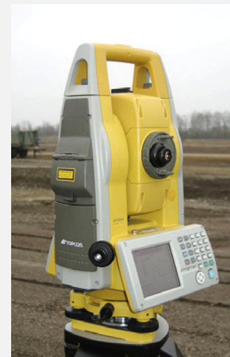
Slika 2.3. Totalna mjerna stanica