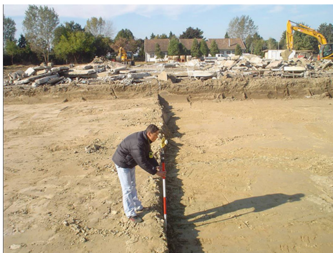
Slika 2.6. Primjer temeljnog tla