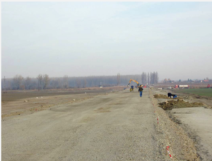
Slika 2.8. Završni sloj nasipa – posteljica

nadzora, npr. Institut građevinarstva Hrvatske – IGH, imenuje nadzornog inženjera i izdaje mu rješenje o imenovanju.