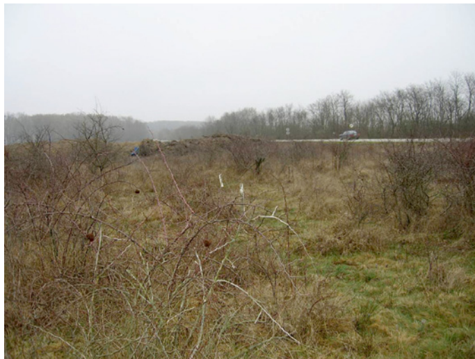
Slika 2.5. Primjer postojećeg stanja

Kontrolne poslove u procesu gradnje ceste obavljaju nadzorni inženjeri. Broj nadzornih inženjera ovisi o složenosti i veličini objekta na kojemu se izvode radovi. Pravna osoba koja je ugovorila poslove