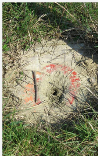
Slika 2.2. Uništena geodetska točka