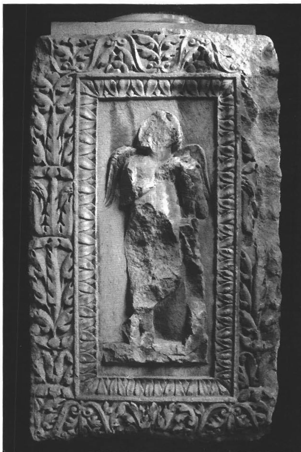
Sl. 1. Bočna strana are, 1. stoljeće, Salona