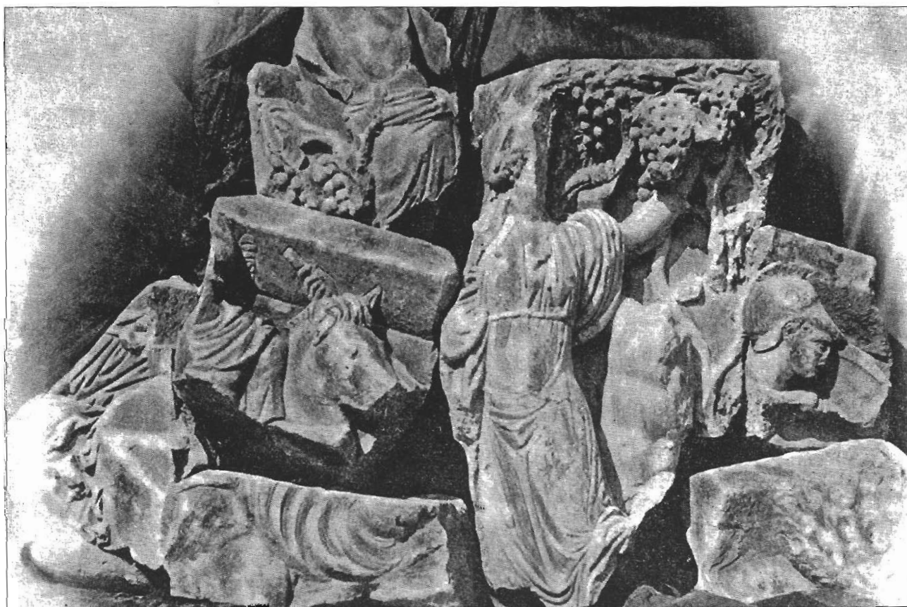
Sl. 4. Ulomci sarkofaga s prikazom Amazonomahije i sarkofaga s dionizijskom scenom Bakhove družbe