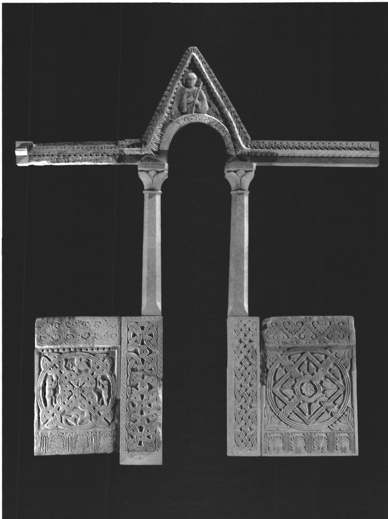
Sl. 5. Oltarna ograda s Koločepa