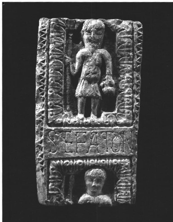
Sl. 3. Ulomak portala s natpisom na kojem se spominje Stephaton