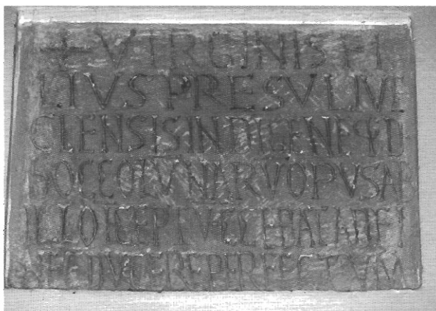
sl. 7 - Natpis uzidan iznad četvrtog južnog stupa katedrale