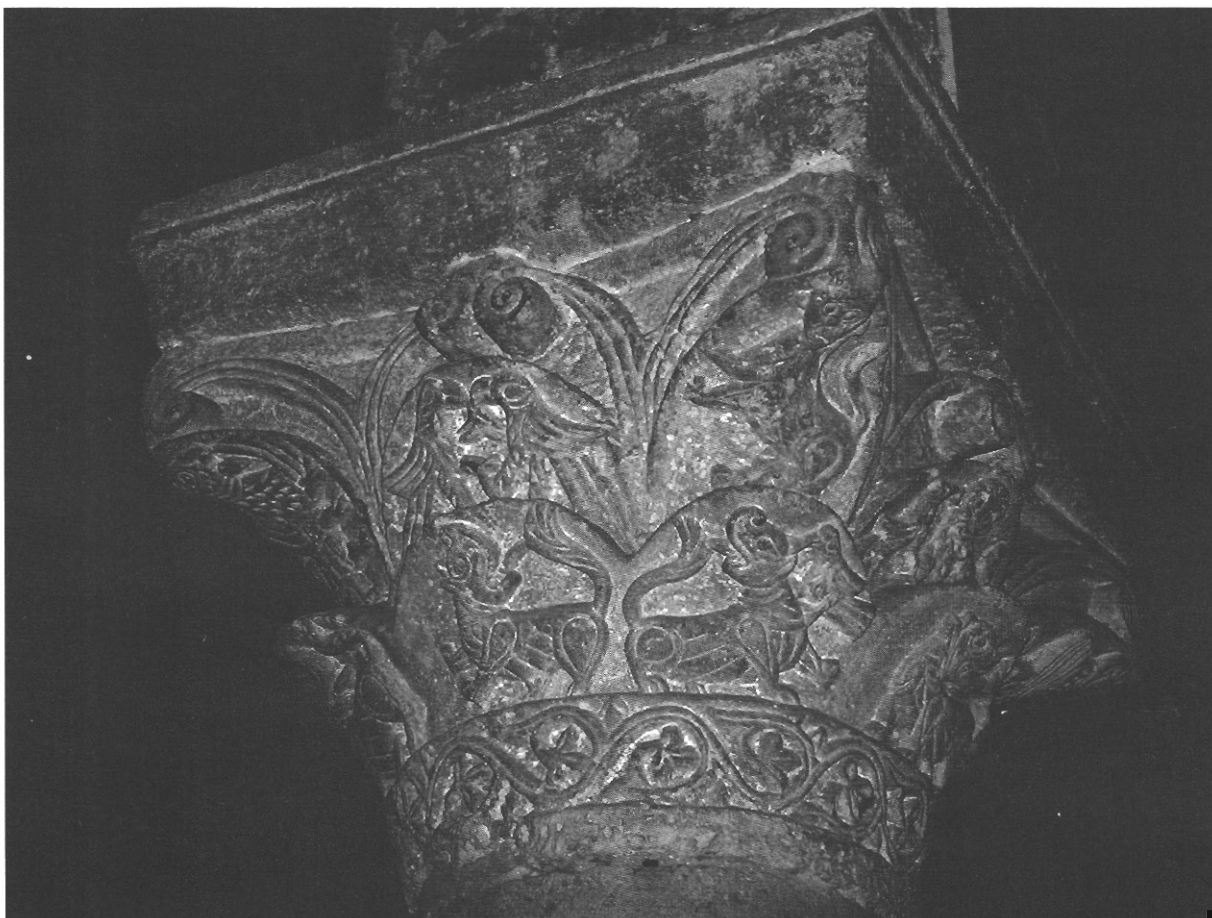
sl. 12 - Osmi kapitel sjeverne kolonade