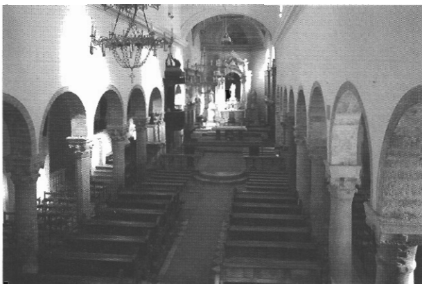
sl. 2 - Interijer katedrale sv. Marije