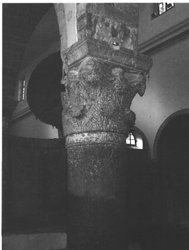
sl. 14 - Treći stup južne kolonade