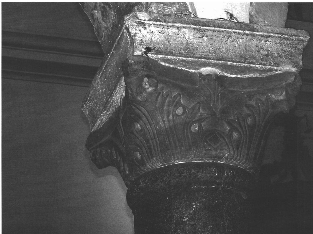
sl. 15 - Četvrti "skraćeni" kapitel južne kolonade