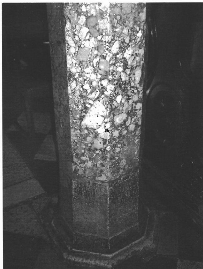
sl. 16 - Dio poligonalnog stupa južne kolonade