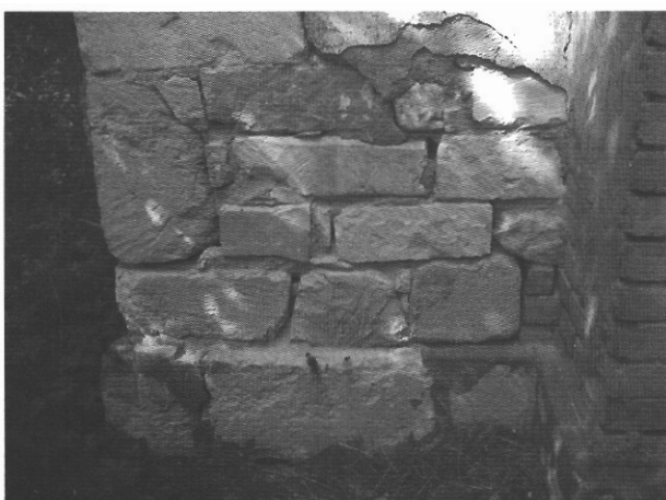
sl. 5 - Dio južnog zazidanog luka na zidu okrenutog prema apside