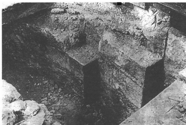
sl. 3 -Zazidani interkolumnij katedrale