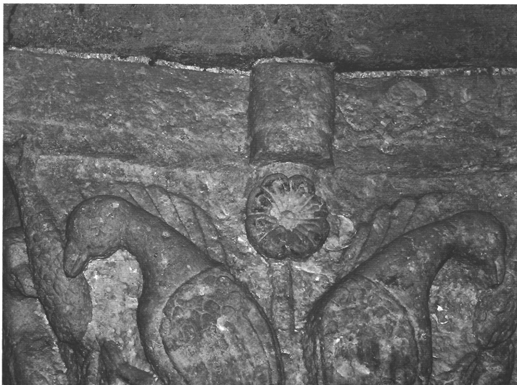
sl. 10 - Detalj prvog kapitela sa sjeverne strane (dio s ptičjim krilima)