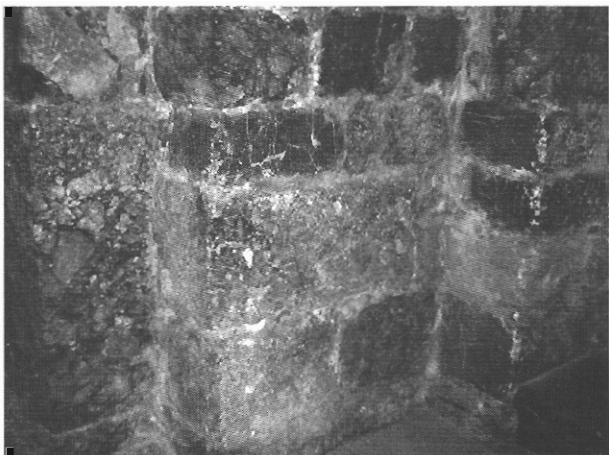
sl. 4 - Južni završetak apside katedrale