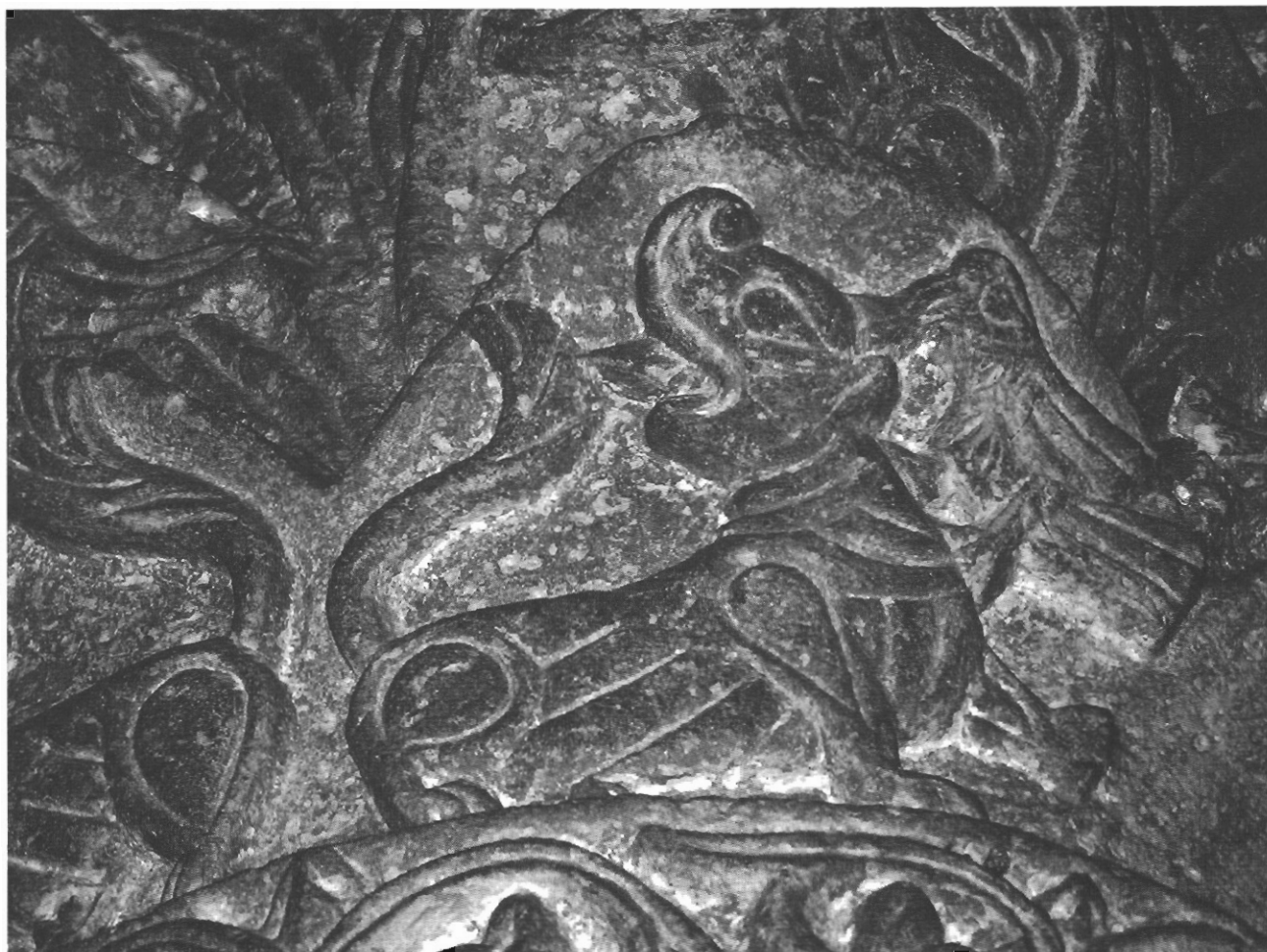
sl. 13 - Detalj s lavom i pticom