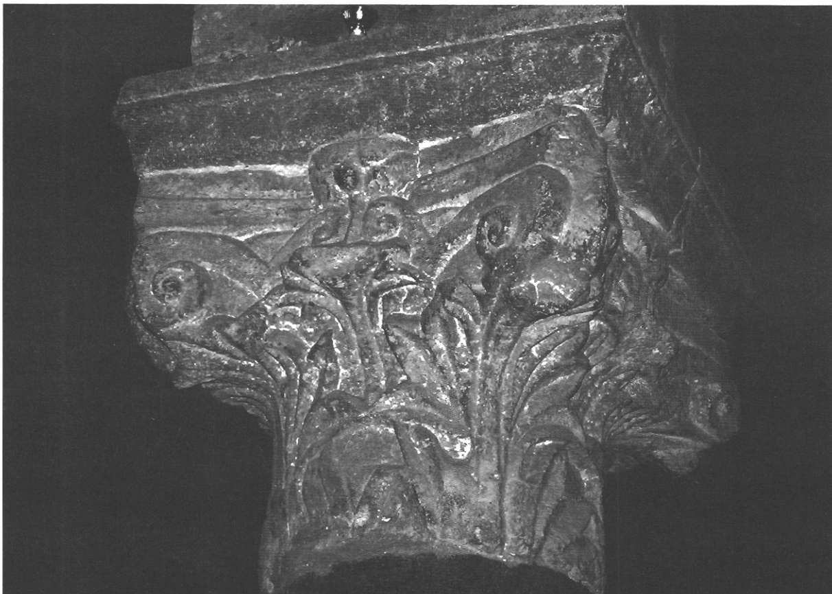
sl. 11 - Deveti kapitel sjeverne kolonade