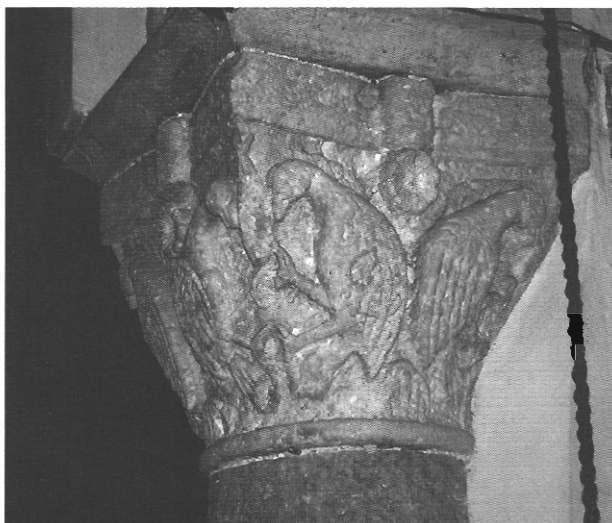
sl. 9 - Prvi kapitel sjeverne kolonade sa životinjskim motivima