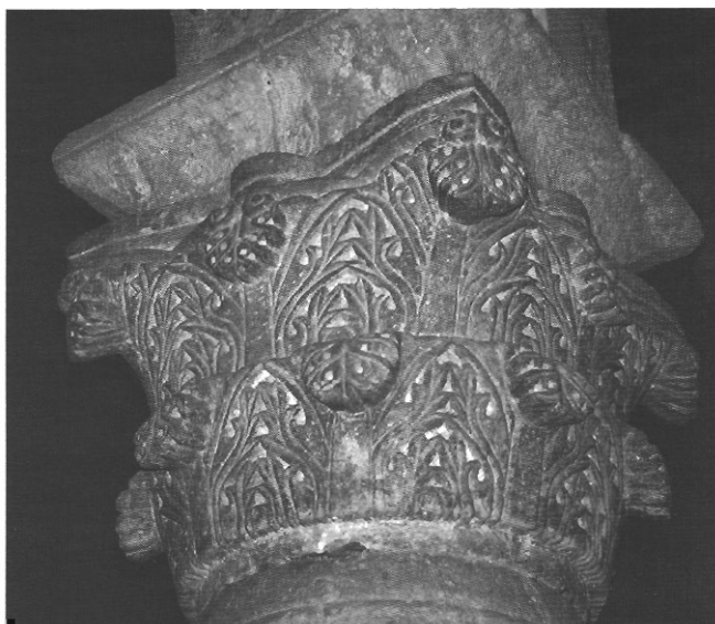
sl. 8 - Dvozonski ramanički kapitel u kolonadi katedrale