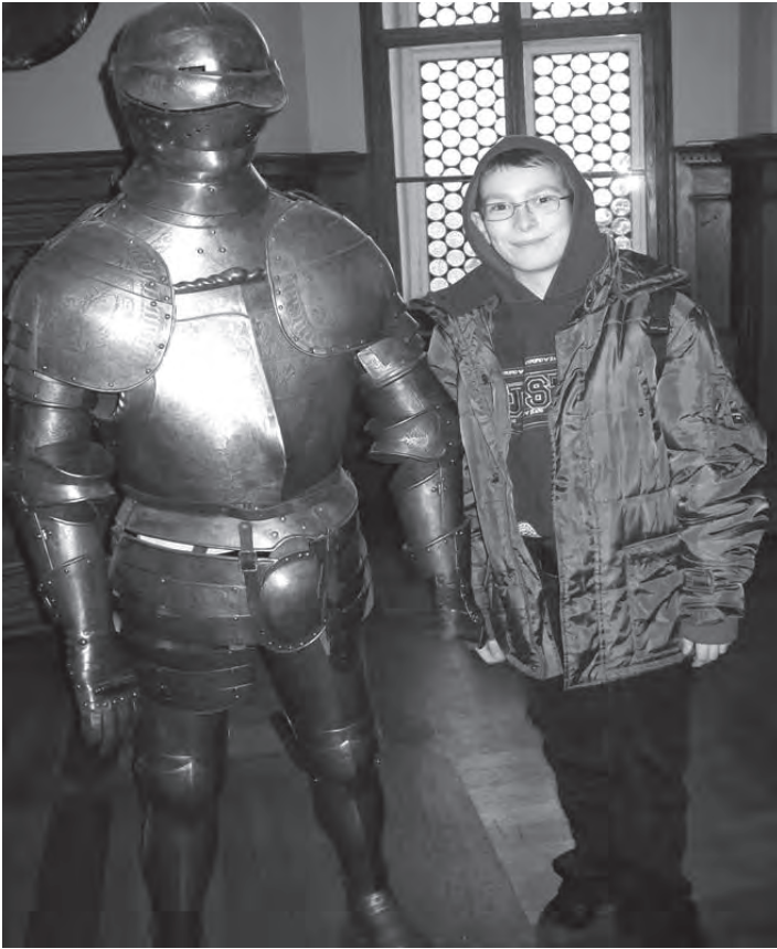
Povijest na zanimljiv način – fotografija za uspomenu

razgovora prilikom utvrđivanja gradiva pokazalo se da su znanja stečena radom u muzeju razumljivija i trajnija.