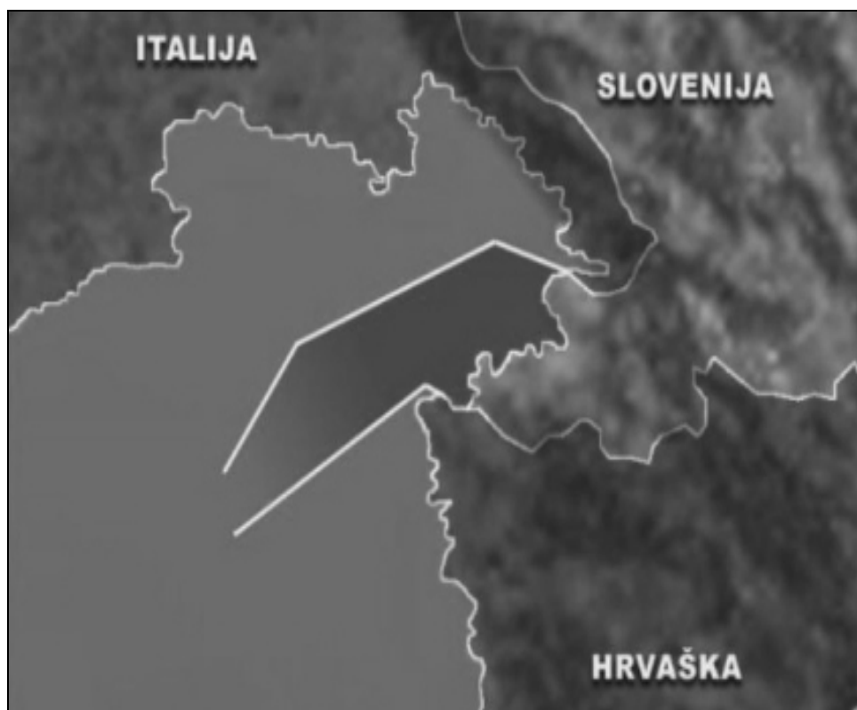
Karta 4. Chart 4.

U Službenom listu Republike Slovenije u kojem je objavljena navedena Uredba, nema kartografskog prikaza granica ribolovnog mora Republike Slovenije, kao što je to kod Praviilnika o granicama u ribolovnom moru Republike Hrvatske („Narodne novine“, br. 144/05.). Na Karti 4. dan je prikaz ribolovnog mora Republike Slovenije (dostupno na http://klepetalnica.24ur.com ).