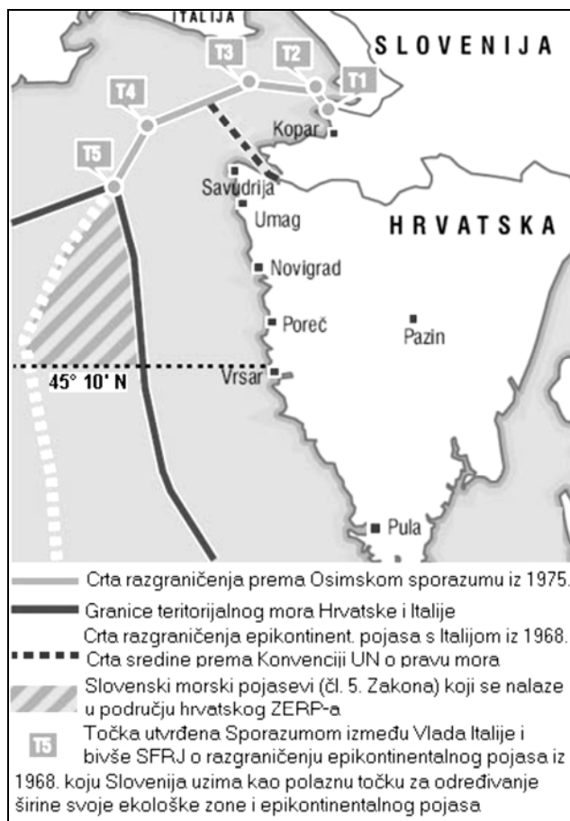
Karta 2. Chart 2.