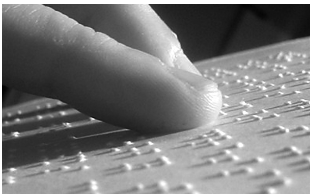
Slika 1: Taktilni oblik brajice

Grafemski oblik brajice dostupan je korištenjem računala i Brailleovih fontova, koji prilagođeni pojedinom jeziku omogućuju pripremu i adaptaciju materijala, izradu taktilnih prikaza, ali i pomoć u adaptaciji, transkripciji i korekciji teksta pisanog u taktilnom obliku. Duxbury system Inc. (1994) oglašava razvoj softverskih rješenja za korištenje brajičnih fontova, što ukazuje na važnost primjene i razvoj tehnologija koje omogućuju vizualizaciju brajice. Grafemski oblik brajice simulira brajicu za potrebe videćih čitača brajice. Grafički simulirana brajica nastaje tako, da ispupčene točkice prezentiraju obojanim (istaknutim) točkicama, dok se točkice koja nedostaju prezentiraju manjim, neobojanim ili manje istaknutim točkicama. Grafemski pristup u prezentaciji brajice koriste različiti autori (Lukić, 2007., Niemann, Jacob, 2005., Krznarić, 2001., Baković, 1995., Fajdetić, 2005., Salizbury, 2008. i dr.).