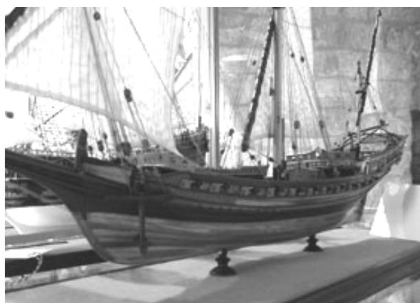
Slika 3. Francuski šambek, 18. stoljeće (Rumunjska)

Prije deset godina, osnivanje Društva brodomodelara "Argosy" obnovilo je organizirani rad dubrovačkih modelara nakon poduže stanke. Uz podršku Atlantske plovidbe, Pomorskoga muzeja i Sveučilišta u Dubrovniku (tada Veleučilišta), u prostorima kojega ovo društvo i danas djeluje, njegovi su članovi počeli organizirano sudjelovati najprije na državnim, a potom i na međunarodnim natjecanjima. Nastupi dubrovačkih modelara bili su vrlo zapaženi i uspješni. Gotovo da nije bilo natjecanja na kojemu oni za svoje modele nisu osvojili neko od najviših odličja. U tom razdoblju ostvarena je i vrlo dobra suradnja s Centrom tehničke kulture iz Rijeke, organizatorom državnih natjecanja, koji je od početka prepoznao kvalitetu i potencijal dubrovačkih brodomodelara i pružao im je potporu u radu. Također, rad i uspjesi članova Društva "Argosy" bitno su pridonijeli i izboru dubrovačkoga brodomodelara M. Mitića za predsjednika Hrvatskog saveza brodomodelara. Uspjesi i suradnja s CTK Rijeka omogućili su i nazočnost trojice dubrovačkih modelara na