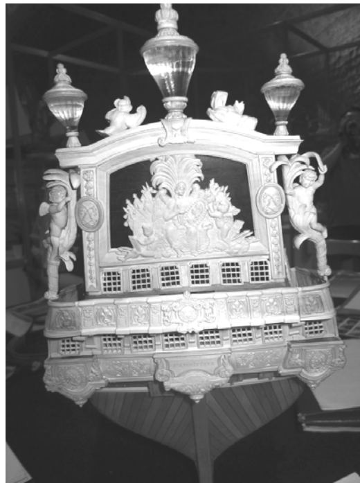
Slika 7. Krma francuskoga ratnog galijuna L'ambitieux (Italija)

Svaki sudac pojedinačno ocjenjuje model na osnovi pet kriterija (prije navedenih) pa se na kraju suđenja ocjene svih sudaca međusobno uspoređuju i donosi se konačna ocjena. Dopuštena razlika u dodijeljenim bodovima među sucima može biti najviše do pet bodova. Ako je broj bodova nekoga suca manji ili veći od dopuštene razlike u ocjeni, pristupa se raspravi i ponovnom ocjenjivanju modela.