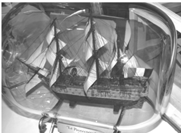
Slika 1. Minijturni model broda u boci (Kina) Figure 1. Miniature model of a ship in a bottle (China)

Od 24. lipnja do 2. srpnja ove godine, pod visokim pokroviteljstvom Predsjednika Republike Hrvatske, u Dubrovniku je održano "13 th Naviga World Championship - Dubrovnik 2006" (13. svjetsko prvenstvo u brodomodelarstvu prema pravilima NAVIGA-e), koje je okupilo više od 170 sudionika iz 15 zemalja svijeta, a u konkurenciji je bilo više od 250 modela brodova. Tim povodom donosimo kratak osvrt na ovu veliku manifestaciju i nekoliko crtica o brodomodelarstvu i dubrovačkim modelarima čiji su dugogodišnji rad, entuzijizam i brojni uspjesi bitno pridonijeli da se ovo veliko natjecanje dogodi u Dubrovniku.