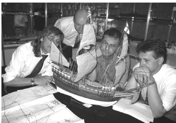
Slika 6. Međunarodni tim sudaca pri ocjenjivanju modela

Svaki pojedini brodski model ocjenjuje prosudbeno tijelo (suci) od pet članova, od NAVIGA-e licenciranih stručnjaka koji su većinom i sami vrsni brodomodelari. U ocjenjivanju se posebno vodi računa o tehničkoj preciznosti (usuglašenost s mjerilima i brodograđevnim nacrtima), povijesnoj vjerodostojnosti (funkcionalna i vizualna točnost u odnosu prema originalu), procjenjuje se izvedba modela (obrtnička i umjetnička vještina obradbe, kvaliteta i primjerenost upotrijebljenih materijala) i opća usklađenost svih sastavnica modela (opći dojam). Svaki je natjecatelj dužan dokumentirati izradbu svoga modela svim potrebnim nacrtima, dokumentima, literaturom i slikama, te na zahtjev sudaca argumentirati detalje izradbe i izvedbe modela.