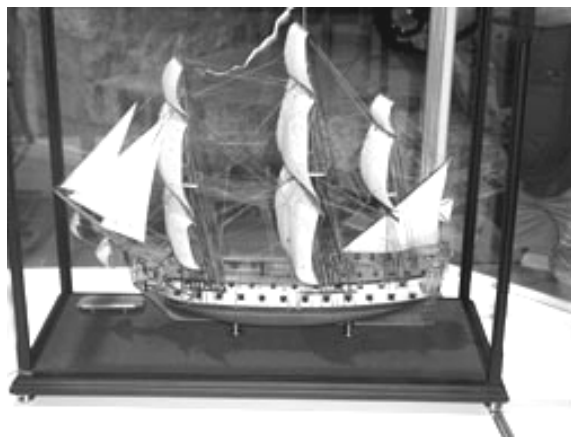
Slika 5. Ruski linijski brod sa 60 topova, 18. stoljeće (Rusija)

Postupak i propozicije prema kojima se provodi natjecanje i ocjenjivanje modela propisane su posebnim međunarodnim pravilnikom NAVIGA-e. Pravila su uspostavljena još 1968. godine i prihvatile su ih sve zemlje Europe, ali i mnoge izvaneuropske. Ocjenjuje se u sedam razreda: C-1 (modeli brodova na vesla i na jedra), C-2 (modeli brodova na motorni pogon), C-3 (modeli instalacija, dijelovi broda, lučka postrojenja, dijelovi luke, dijelovi brodogradilišta i oprema), C-4 (minijaturni modeli razreda od C-1 do C-3 u omjeru 1:250 i manjemu), C-5 (brodovi u boci), C-6 (plastični modeli) i C-7 (kartonski i papirnati modeli).