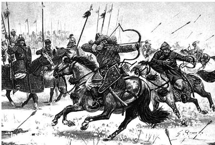
Slika 3: Mongolska laka konjica u akciji

Na taj je način razvukao svoje redove i njegovi bokovi su postali ranjivi. Njegovim vitezovima je izgledalo da progone protivnika, a kada su ustanovili da su se odvojili od svojih pješaka i da su okruženi, bilo je kasno. U ovoj bici Mongoli su imali osjetne gubitke. Može se pretpostaviti da bi to bio i njihov poraz da su protivnika napali frontalno. Umjesto toga oni su protivniku nametnuli bitku gdje je došla do izražaja njihova brzina i „vatrena nadmoć“ u gađanju iz daljine.