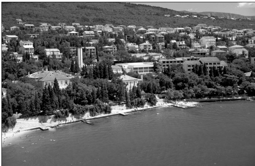
Slika 4. Današnja (nova) Thalassotherapia u Crikvenici Figure 4 Today's (renovated) Thallassotheapia in Crikvenica, Croatia

Pritom valja istaknuti izvrstan oporavak i brzu revitalizaciju respiratorne sluznice kod bolesti gornjih i donjih dišnih putova kao jedinstvenog sustava te poboljšanje osjeta mirisa i bolju prohodnost dišnih putova.