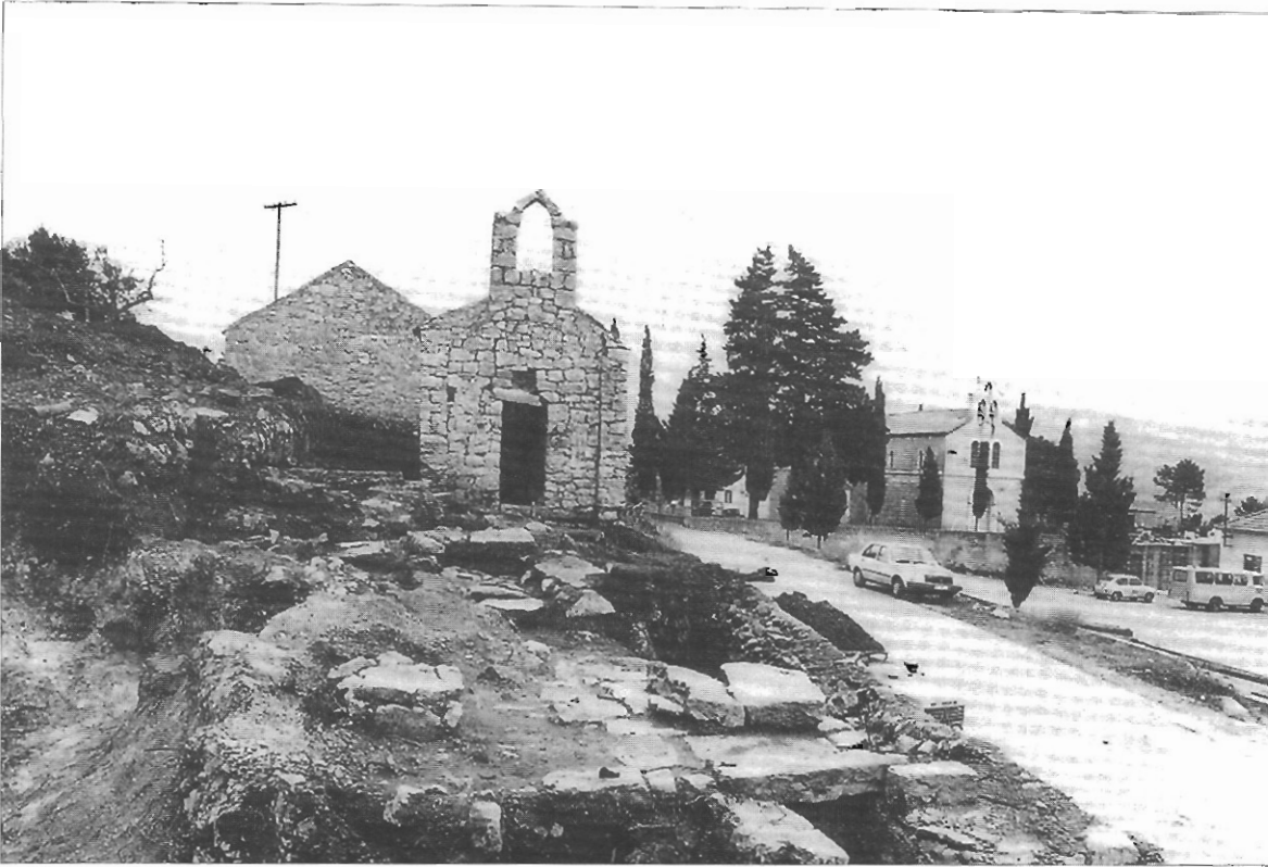
Sl. 2. Crkva Sv. Đurda s nekropolom.

natno stepenasto istaknute u odnosu na liniju začelnog zida. Nnutrina apside artikulirana je trima polukružnim nišama. Vanjski zidni plašt crkve nije raščlanjen, osim na pročelju, koje obodno uokviruju dvije lezene. Nad pročeljem je prediomenzirana preslica. Unutrašnjost je crkve artikulirana s dva para nasuprotnih lezena i njima pripadajućim pojasnicama pa je na taj način brod trotravejno oblikovan. Premda ona baštini osnovni model predromaničkog sloga, način zidanja građevine i zvonik na preslicu upućuju na 12. ili 13. stoljeće 3 .