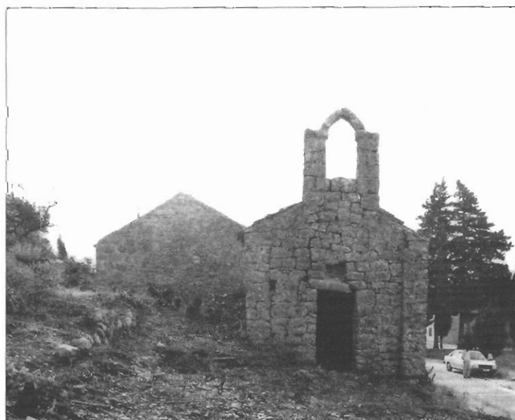
Sl. 1. Sv. Đurđ u Ponikvama, stanje prije istraživanja.

Premda su arheološka istraživanja na crkvi Sv. Đurđa u Ponikvani izvedena prije gotovo 20-ak godina, kada su sažeto objavljeni rezultati, ovaj dopunjeni tekst kao i nove nalaze na lokalitetu Sv. Martina posvećujem svečaru dr. Dušanu Jelovini 2 . Crkva Sv. Đurđa nalazi se uz pelješku magistralu u zaseoku Ledinići u Ponikvama (sl. 1). Građevina se sastoji od pravokutne lađe, koju presvuđuje bačvasti svod, te pravokutne apside nez-