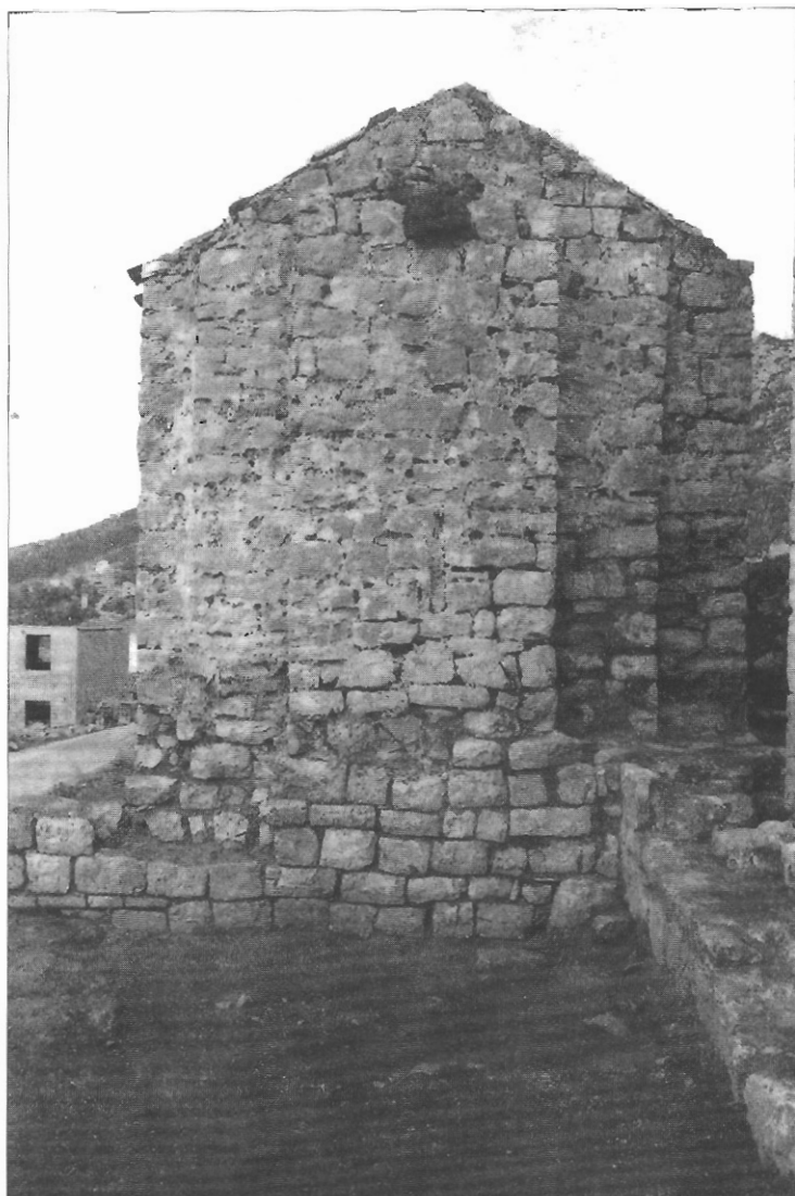
Sl. 3. Antičke zidane strukture uz crkvu Sv. Đurda.

U nižem sloju pronađene su 24 grobnice, koje po obliku i stratigrafiji pripadaju prvom horizontu ukapanja.