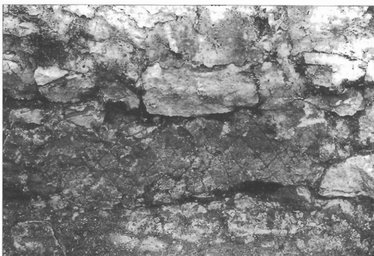
Sl. 4. i 5. Crkva Sv. Martina u Stonu prije i poslije konzervacije.