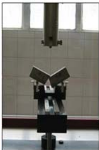
b) Ispitivanje vlačne čvrstoće savijanjem