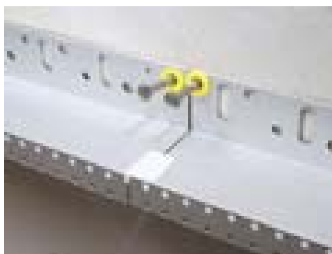
Slika 3. Sokel šina za postavu EPS-a

Sanacijska žbuka normirana je u DIN EN 998-1 (skraćena R - Renovation Mortar). Sanacijska žbuka je specijalna izrazito porozna žbuka (poroznost > 40 vol.-%) s izraženom sposobnošću difuzije vodene pare i smanjenom kapilarnom vodljivošću. Koristi se za žbukanje, odnosno sanaciju zidova od kapilarne vlage i zidova zasićenih topivim solima.