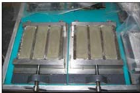
a) Uzorci ugrađeni u kalupe

Od jednog uzorka prizme prilikom ispitivanja savojne čvrstoće nastanu dva uzorka na kojima se onda ispituje tlačna čvrstoća. Čvrstoća na tlak označava se sa „CS“ (Compression = Druck), a izražava u N/mm 2 (Slika 4.).