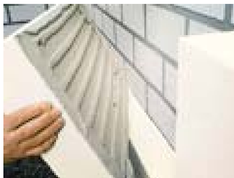
Slika 1. Kleben (lijepljenje EPS-a)

Način postavljanja termoizolacijski spregnutog sistema WDVS: