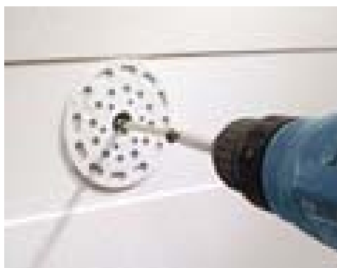
Slika 2. Dübeln (učvršćenje tiplima)