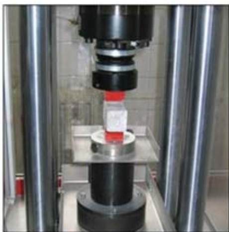
c) Ispitivanje tlačne čvrstoće