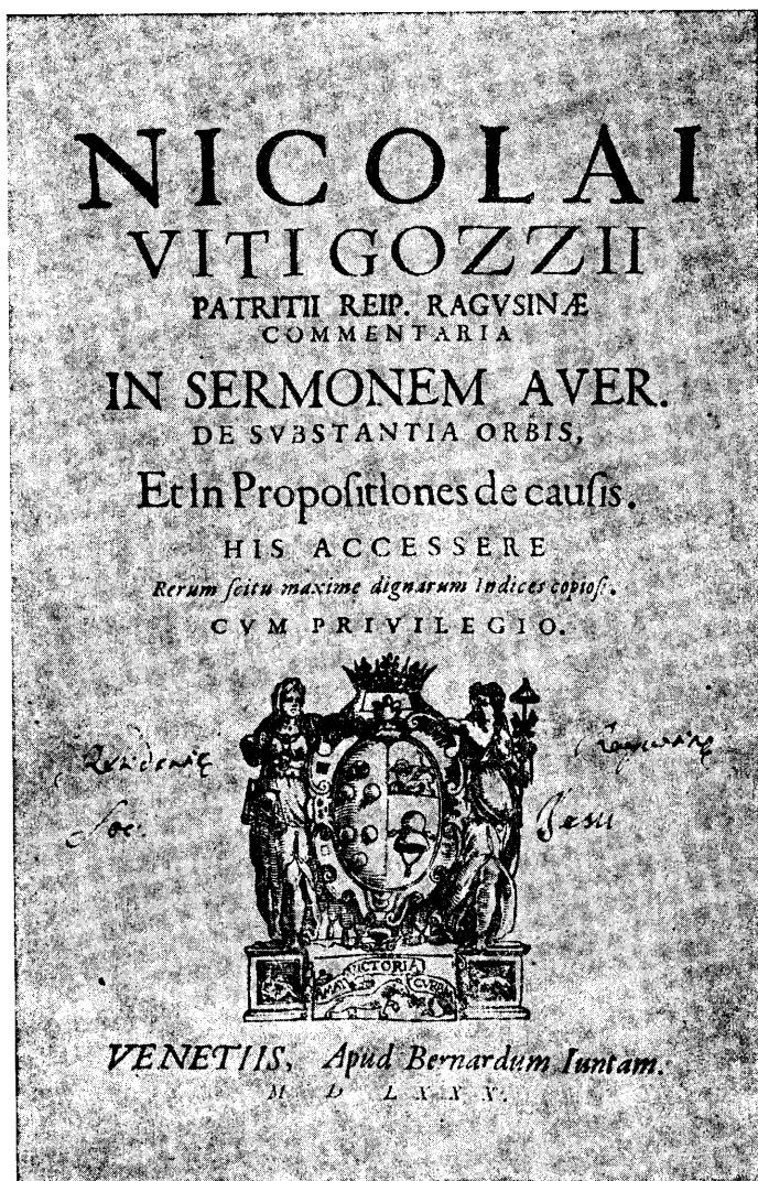
Nikola V. Gučetić, Commentaria in sermonem Averrois de substantia orbis et in propositiones de causis , Venecija 1580.