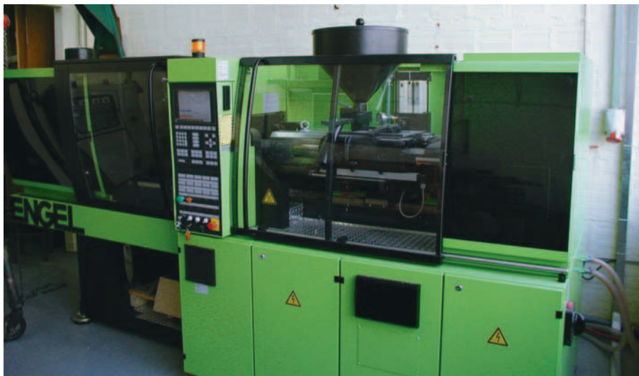
SLIKA 2. Ubrizgavalica ENGEL Victory 330/60 Power

jektima poput, u ovome trenutku aktivnoga Erekova projekta Ecoplast , a koji se odnosi na ispitivanje mogućnosti preradbe i recikliranja drvno-plastomernih kompozita.