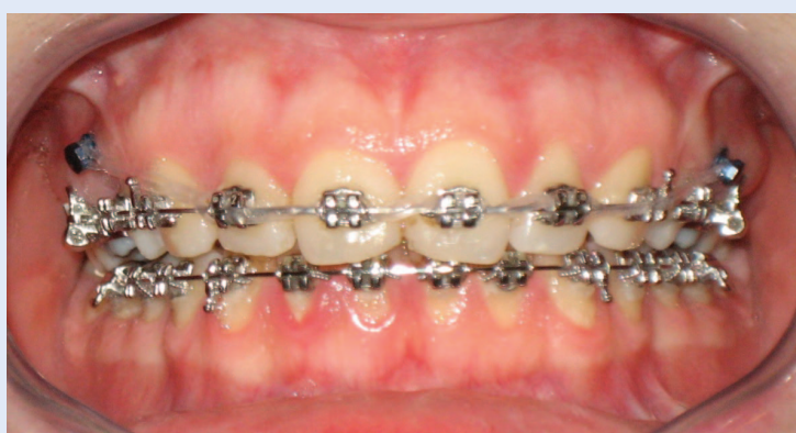
Slika 3. Fiksna ortodontska edgewise naprava s metalnim bravicama na obje čeljusti Figure 3. Fixed orthodontic edgewise appliance with metal brackets in both jaws

cima treba evaluirati i razmisliti o mogućoj impakciji 2 . Impakcija očnjaka utvrđuje se najčešće njegovim zakašnjelim nicanjem, prisustvom mliječnog očnjaka u zubnom nizu, odsustvom nabrekline u bukalnom vestibulumu ili prisustvom palatinalne nabrekline. Dodatni simptomi su distalno ili labijalno nagnuti postranični sjekutići. Nabrekline u kosti palpira se bukalno ili palatinalno na sluznici, a odsustvo nabrekline djeteta starosti od 9 do 10 godina može biti rani simptom impakcije 11-15 .