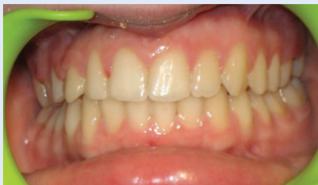
Slika 4c. Skinuta fiksna ortodonska naprava – prednji snimak Figure 4c. Patient after removal of fixed orthodontic appliance – frontal view