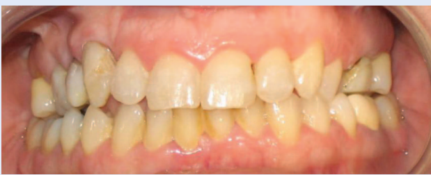
Slika 6c. Skinuta fiksna ortodonska naprava – prednji snimak Figure 6c. Condition after removal of fixed appliance – frontal view