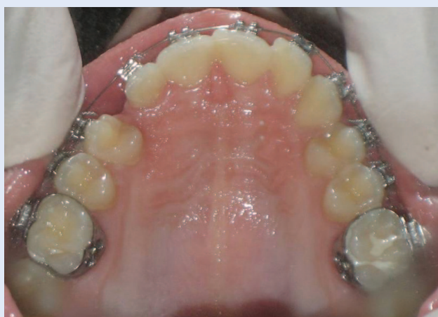
Slika 4b. Postavljena fiksna ortodonska naprava – oralni snimak Figure 4b. Fixed orthodontic appliance – occlusal view