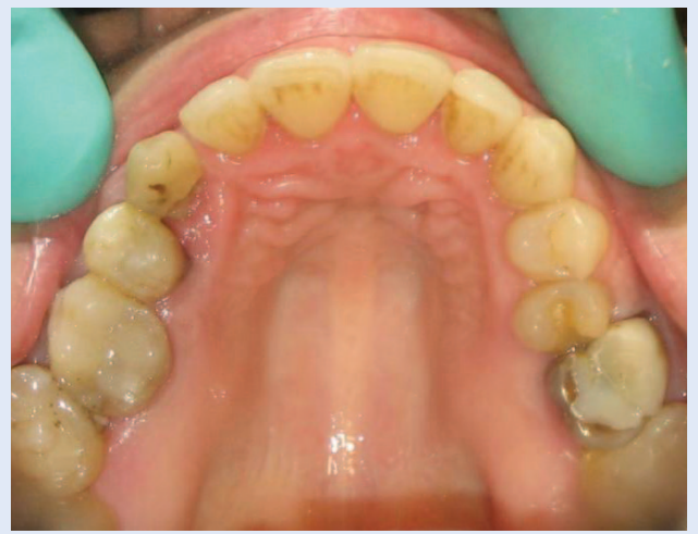
Slika 6e. Skinuta fiksna ortodonska naprava – oralni snimak Figure 6e. Condition after removal of fixed appliance – occlusal view