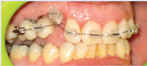
Slika 6a. Postavljena fiksna ortodonska naprava – bočni snimak Figure 6a. Fixed appliance – lateral view