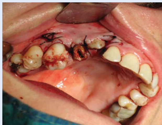
Slika 5. Stanje nakon završene operacije apikalno pomaknutog režnja s prikazivanjem krune očnjaka Figure 5. Frontal view following apically repositioned flap with exposition of tooth crown