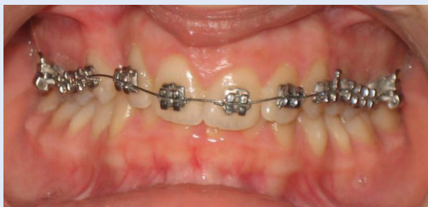
Slika 4a. Postavljena fiksna ortodonska naprava – prednji snimak Figure 4a. Fixed orthodontic appliance – frontal view