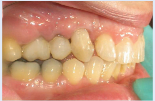
Slika 6d. Skinuta fiksna ortodonska naprava – bočni snimak Figure 6d. Condition after removal of fixed appliance – lateral view