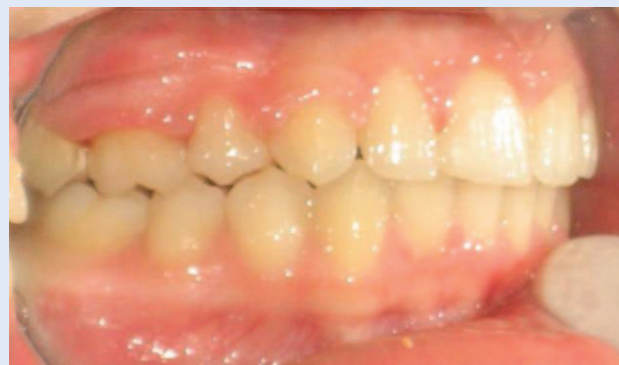
Slika 4d. Skinuta fiksna ortodonska naprava – bočni snimak Figure 4d. Patient after removal of fixed orthodontic appliance – lateral view