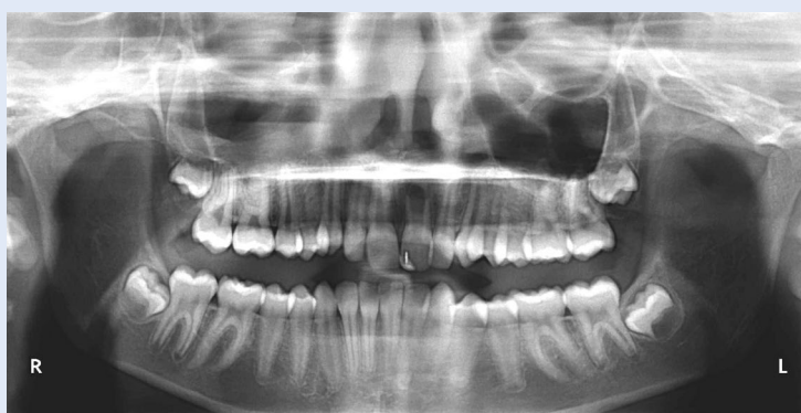
Slika 1. Ortopantomogram bolesnika s mladom trajnom denticijom Figure 1. Orthopantomogram of patient in early permanent dentition