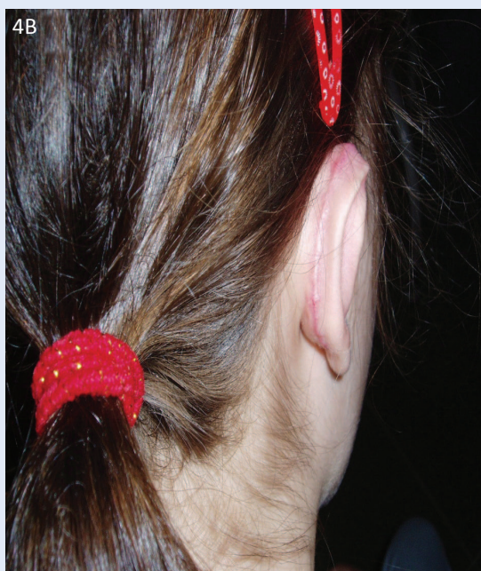
Slika 4. Bolesnica godinu dana poslije operativnog zahvata: A) s lijeve strane; B) s desne strane

Figure 4. The patient seen one year after operation A) View from the left B) View from the right