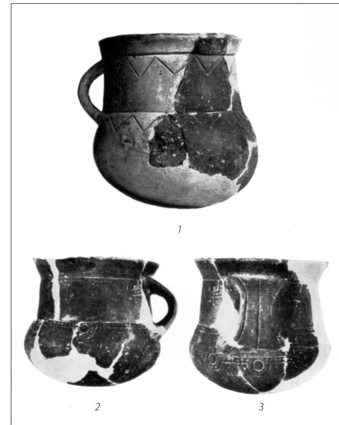
Tabla 1. Vrč iz Bajagića (Sinj) (1); vrč iz groblja u Laterzi (Bari) (2, 3).