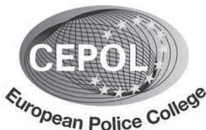
Slika 1: Logotip CEPOL-a ( http://www.cepola.europa.eu/ )

CEPOL je u današnjem obliku osnovan Odlukom Komisije 2005/681/JHA od 20. rujna 2005. kao slijednik European Police College osnovanog Odlukom Komisije iz 2000. godine. Skraćenica CEPOL sastoji se od prvih slova francuskog naziva Collège européen de police – eng. European Police College . CEPOL ima status pravne osobe, a godišnji proračun mu iznosi oko 8,45 milijuna eura za 2012. godinu. 2