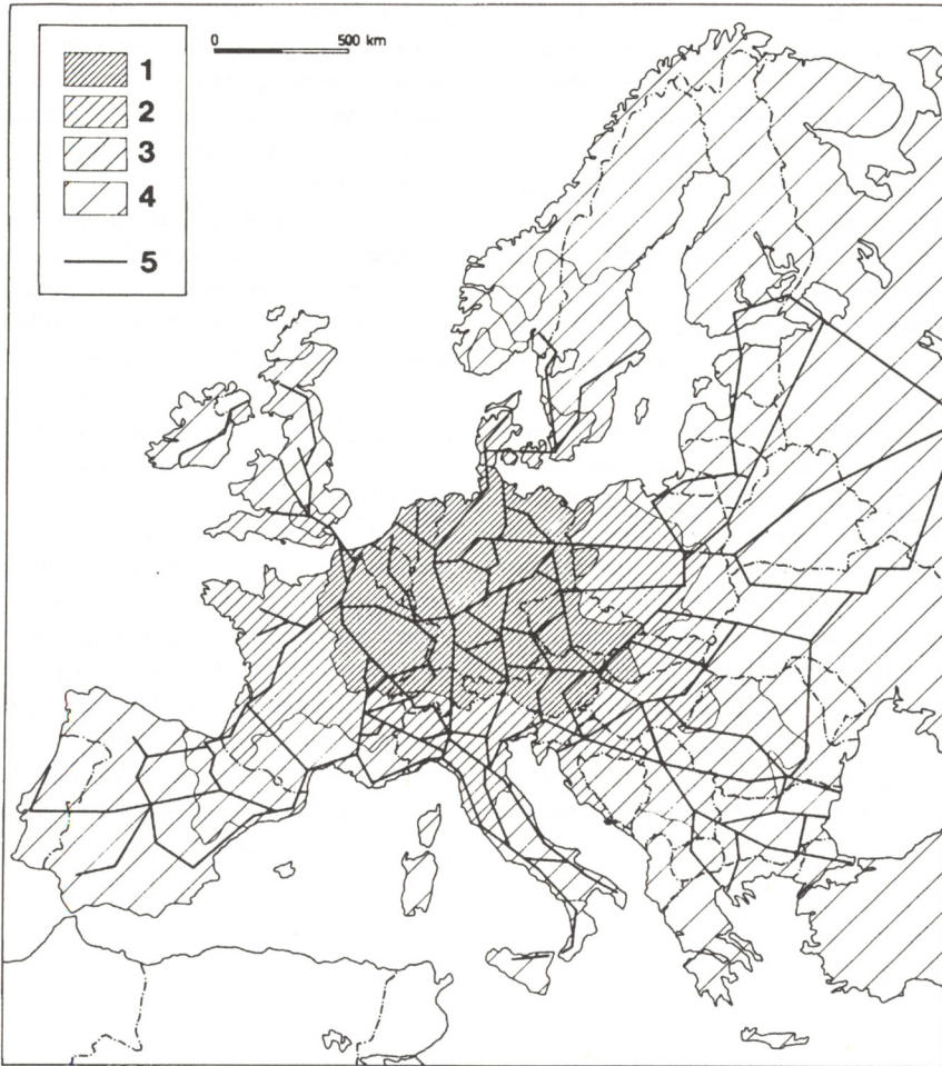
Sl. 3. Stupnjevi dostupnosti u željezničkom prometu - sa srednjeeuropskog stajališta - 1. središnji položaj, 2. središnji rubni položaj, 3. periferni položaj, 4. periferni rubni položaj, 5. važnije željezničke veze. Karta izrađena prema podlozi K. Rupperta.

Picture 3. Levels of access in railway traffic based on Central Europe approach 1. Central location 2. Central marginal location 3. Peripheral location 4. Peripheral marginal location 5. Major railway connections. Map based on K. Ruppert's background details