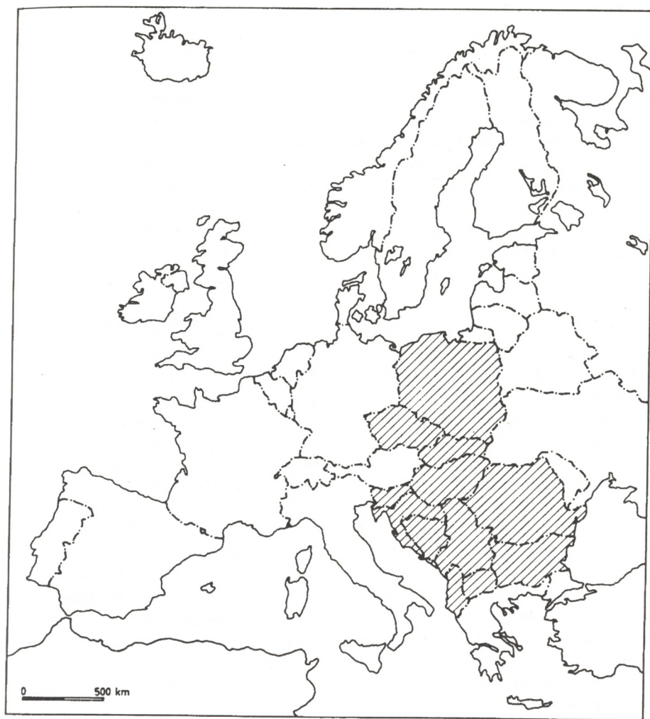
Sl. 1. Europa mediane M. Fouchera. Karta izrađena prema podlozi K. Rupperta Picture 1. M.Foucher's Europa Mediana. The map based on K.Ruppert's background details