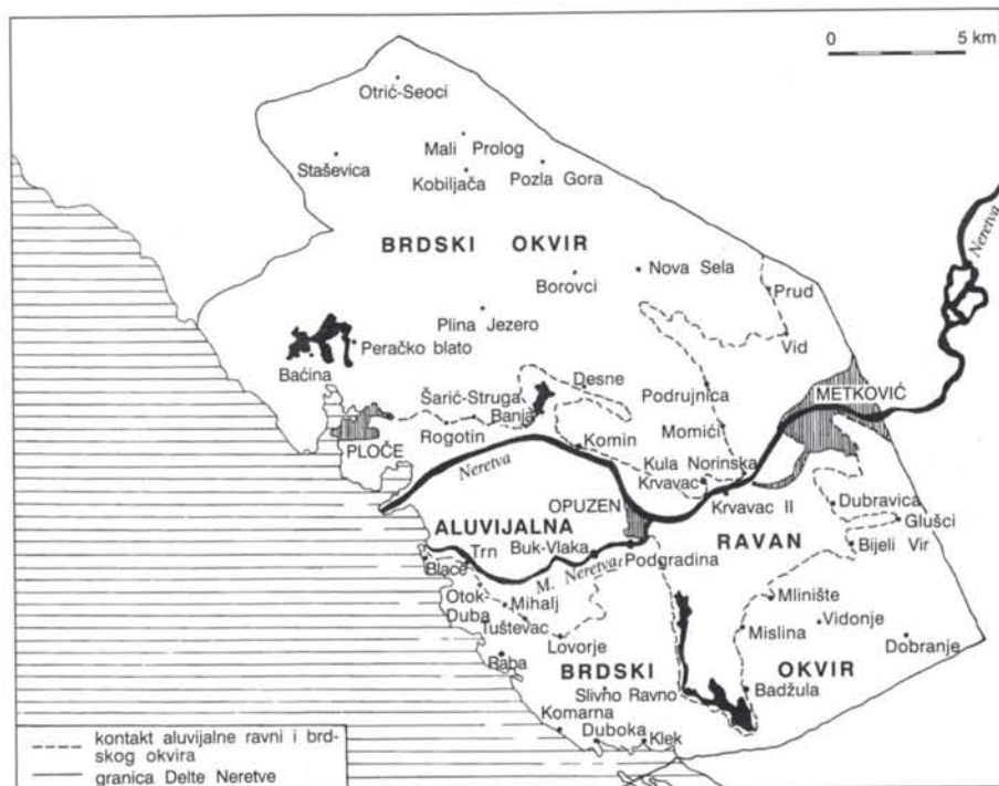
Sl. 1. Glavna naselja delte Neretve 1991. godine