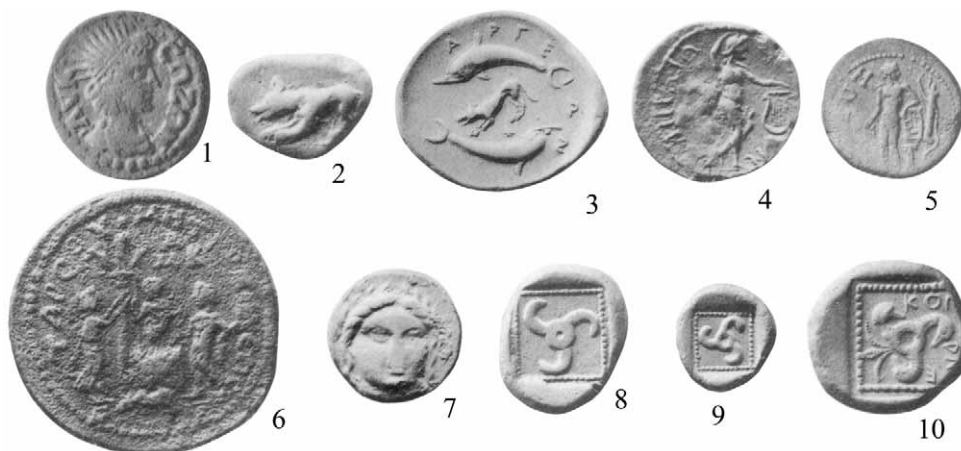
Sl. 1/Fig. 1

na atenskom novcu (Sl. 1.4), Apolona Likijskog na novcu Sarda (HEAD 1911: 657; T. 1.2) te Apolona Likejskog, koji drži uzde dvama vukovima, na novcu kilikijskog grada Tarza (HEAD 1911: 733; BMC Lycaonia, Isauria, and Cilicia: 215 br. 266, 267, 213, br. 304; Sl. 1.6). Ovomu možemo dodati i novac Tesalske lige iz vremena Klaudijeve vladavine s prikazom ovjenčanog Apolona uz natpis ΔΥΚΟΥ na aversu te vuka na reversu (RPC suppl. 1 str. 21, S-1438B). Naposljetku, karakteristični simbol likijskog novca, prvi puta potvrđen u 5. st. pr. Kr., triskeles , vjerojatno predstavlja »solarni znak koji simbolizira kružno kretanje«, nesumnjivo povezan sa štovanjem »nacionalnog božanstva Likije, Apolona Likijskog, boga svjetlosti« (HEAD 1911: 688–689; cf. BABELON 1893: xci; ovakvu interpretaciju prvi je predložio MÜLLER 1877; Sl. 1.8–9; cf. COOK 1914: i.299–302). Interpretacija triskeles kao simbola sunčevog kružnog kretanja prilično je uvjerljiva, pa su Head i Babelon vjerojatno u pravu kada ju (oprezno) povezuju s likijskim solarnim božanstvom Apolonom, a ona se nadalje može potvrditi tipom novca koji prikazuje triskeles ukrašen labudovim glavama (BABELON 1893: 70 br. 474, tab. XII.11, 79 br. 532, tab. XV.5; Sl. 1.10), što se ima shvatiti kao asocijacija na Apolona (o ovome više na drugom mjestu).