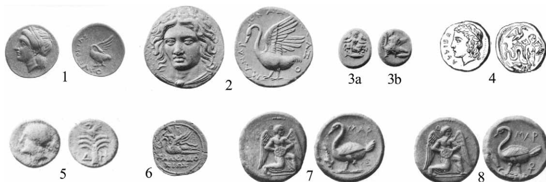
Sl. 4/Fig. 4

krilate muške figure u Knielauf položaju, koja u rukama drži kružni disk s osmokrakom zvijezdom, vjerojatno »sunčevu ploču«, dok se na reversu nalazi prikaz labuda (IMHOOF-BLUMER 1883a: 104–107, Pl. V.13–19; BMC Lycaonia, Isauria and Cilicia : 97–8 i Plate XVI.8–13, XL.9; Sl. 4.7, 8). Ličnost na aversu, koga god predstavlja, zasigurno prenosi snažan solarni simbolizam te, shodno tomu, i labuda treba promatrati kroz vezu sa sličnim konceptom.