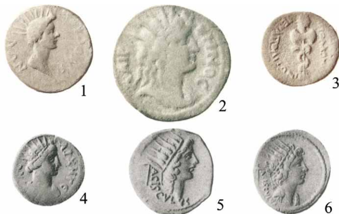
Sl. 2/Fig. 2

glavi i lukom u ruci (LIMC br. 484). 3 Nekoliko tipova neapolitanskog Italy novca ( BMC Italy : 110, br. 158–161; T. 1.4) prikazuje Apolona na aversu te bika s ljudskom glavom (koji možda predstavlja riječnog boga Aheloja, oca Sirene Partenope; vidi BILIĆ 2006: 38–40 za složenu povezanost Apolona, Partenope i Neapola) iznad kojeg su poprsje Helija ili osmokraka zvijezda, sugerirajući širok raspon kompleksnih asocijacija koje se nalaze izvan opsega ovog rada. 4