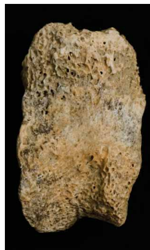
Slika 2. Probavljena akcesorna falanga svinje. Figure 2. Digested pig accessory phalanx.

U jami SJ 03 pronađene su tri alatke (šila) izrađene od tibija ovikaprida (slika 3). U jami SJ 63 pronađen je jedini ostatak jelena na nalazištu. Riječ je o fragmentima roga (stablo i dio paroška), koji je otpiljen kako bi se dobio sirovinski materijal za izradu alatki (slika 4). Fragment roga je odbačen kao neiskoristiva sirovina, dok je od ostatka izrađen neki uporabni predmet koji nije pronađen. S obzirom na to da je samo jedan uzorak, i to dio roga, pripisan jelenu, ne možemo sa sigurnošću govoriti o lovu na divljač. Naime, riječ je o sirovinskom materijalu koji je do »vlasnika« možda dospio posrednim putem ili je sakupljen u prirodi kao odbačen. Poznato je da je u srednjem vijeku slugama i seljacima zakonom zabranjen lov na divljač, no kada točno taj zakon stupa na snagu i je li tako rano vrijedio i na našim prostorima, nije poznato. Istovremeno, mali postotak divljači u utvrdama prije upućuje na lov kao plemeniti sport nego na sredstvo preživljavanja (BÖKÖNYI 1974: 39).