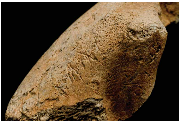
Slika 1. Tragovi rezanja na temporalnoj kosti konja. Figure 1. Cutting marks on an equine temporal lobe.

Na stupanj očuvanosti kostiju utjecali su razni tafonomski procesi, a u ovom slučaju prirodni faktori prevladali su nad ljudskim utjecajem. Naime, zbog specifičnog sastava tla te biljnog pokrova nad nalazištem, površina kostiju je dosta oštećena. Drugim riječima, vrlo malo uzoraka s tragovima ljudskog djelovanja možda nije odraz realnog stanja na nalazištu. Samo 12 uzoraka pokazuje neke tragove ljudskog djelovanja, a 4 od toga su alatke, odnosno sirovinski materijal. Zanimljivo je da su urezi od odvajanja udova, osim na govedu i kozi/ovci, utvrđeni i na ostacima konja, a na jednom uzorku mogu se interpretirati kao tragovi odvajanja mandibule (slika 1). Tragovi gorenja utvrđeni su na 7 uzoraka, a riječ je o kostima koje su slučajno ili namjerno završile u vatri, no nisu imale veze s pripremom hrane. Tragovi djelovanja želučane kiseline na jednoj akcesornoj falangi i fragmentu kalkaneusa svinje upućuju na prisustvo pasa, koji su se znali pogostiti ostacima ljudske ishrane (slika 2).