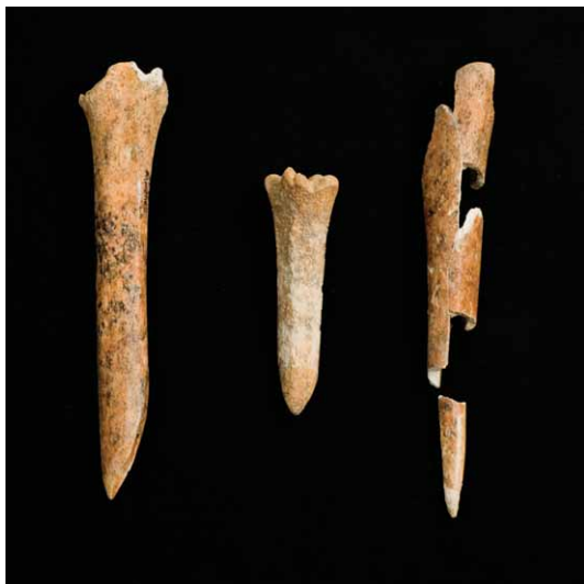
Slika 3. Koštana šila.