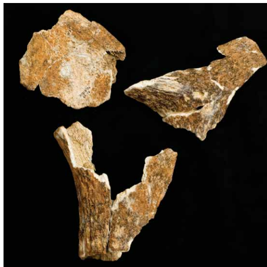
Slika 4. Fragmenti roga jelena.