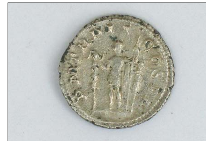
Slika 5. Novac čišćen mehanički pomoću rotirajuće četke i destilirane vode, nakon suhog čišćenja.

Za njihovo skidanje korišten je skalpel, jer samo četkanje nije bilo dovoljno. Na nekim novcima ostavljene su manje tvrde naslage, kako se njihovim daljnjim skidanjem ne bi oštetila srebrna površina. Na kraju su novci isprani u destiliranoj vodi, te stavljeni na sušenje. Nakon sušenja novac nije konzerviran sredstvom za konzervaciju, jer u odgovarajućim uvjetima čuvanja novac više neće korodirati. Površina srebra pod utjecajem svjetla, fotolizom dobije patinu koja vizualno ističe reljefni prikaz na novcu. Takva se patina, ako je potrebno, jednostavno skida. Dovoljno je novac uglačati četkama od prirodnog materijala: pamuk, vuna ili koža (sl.7).