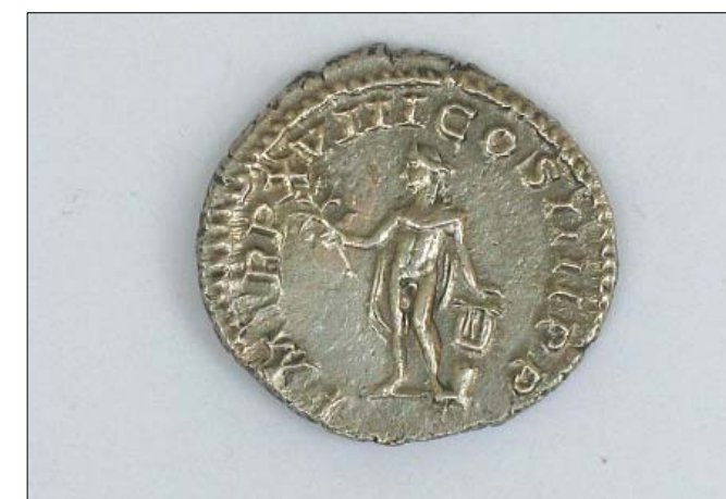
Slika 6. Novac čišćen samo mehanički pomoću rotirajuće četke i destilirane vode.