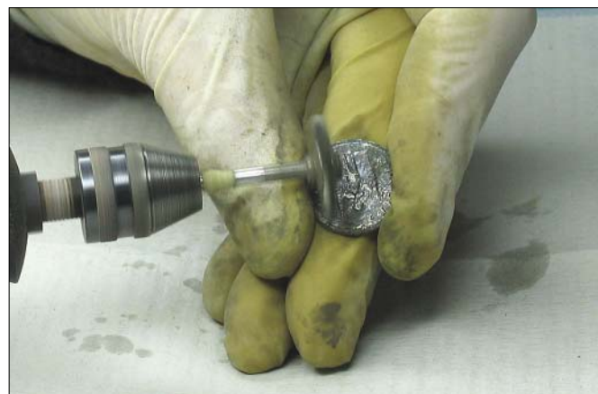
Slika 2. Čišćenje novca mehanički pomoću rotirajuće četke na suho.