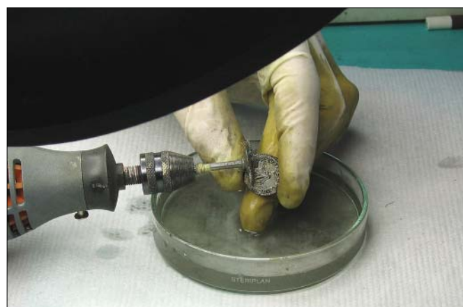
Slika 4. Čišćenje novca mehanički pomoću rotirajuće četke i destilirane vode.

sloj oksida. Dio naslage koji ne može skinuti, četka uglača. Pritom se metalni predmeti, u ovom slučaju novac, zagrijava (sl. 3). Povećavanjem broja okretaja, novac se više zagrijava, skidaju se naslage, ali četka ostavlja tragove na mekšim naslagama oksida. Proces je vidljiv uz uporabu povećala ili mikroskopa. Ako tragovi ostaju na naslagama, onda će vjerojatno ostajati i na srebrnoj površini novca. Iako je do sada praksa u radionici AMS-a bila da se predmete od bronce i srebra čisti mehanički na suho, u ovoj prigodi pokušala sam čistiti uz pomoć destilirane vode. Za to mi je bila potrebna plitka staklena posuda s destiliranom vodom u neposrednoj blizini rotirajuće četke i novca (sl. 4), tako da se prilikom rotiranja na novac istodobno nanosi voda. Dobri rezultati su se odmah pokazali (sl. 5). Izbjegnuto je zagrijavanje metala, četka ne ostavlja tragove na površini s naslagama, a oksid se bolje i lakše skida. Destiliranu vodu potrebno je često mijenjati - što je voda čišća, naslage su manje. Na ovaj način očišćen je veliki dio površine. Ostale su mjestimično manje naslage koje su bile tvrde ili nakupljene u udubinama reljefa novca (sl. 6). One su čišćene na isti način, ali pod mikroskopom. Kod novca koji je imao tvrde naslage korozije ponavljano je kuhanje u destiliranoj vodi i otopini natrij-karbonata (NaHCO 3 ).