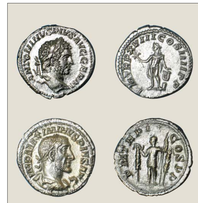
Slika 7. Očišćeni novac.