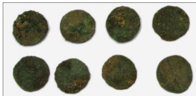
Slika 1. Novac prije čišćenja.

Novac je na početku čišćen malim brojem okretaja motora uz čestu promjenu smjera četkanja. Na taj način skida se površinski