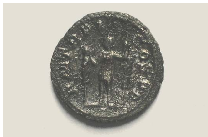
Slika 3. Novac čišćen mehanički na suho.