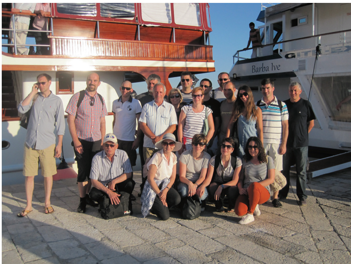
Sudionici terenskog obilaska u sklopu znanstvenog skupa Dalmacija u prostoru i vremenu – Što Dalmacija jest, a što nije?