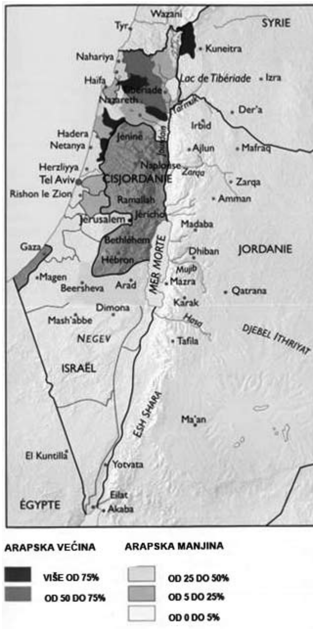
Prilog 1 – Karta udjela arapskog stanovništva u državi Izrael. 26