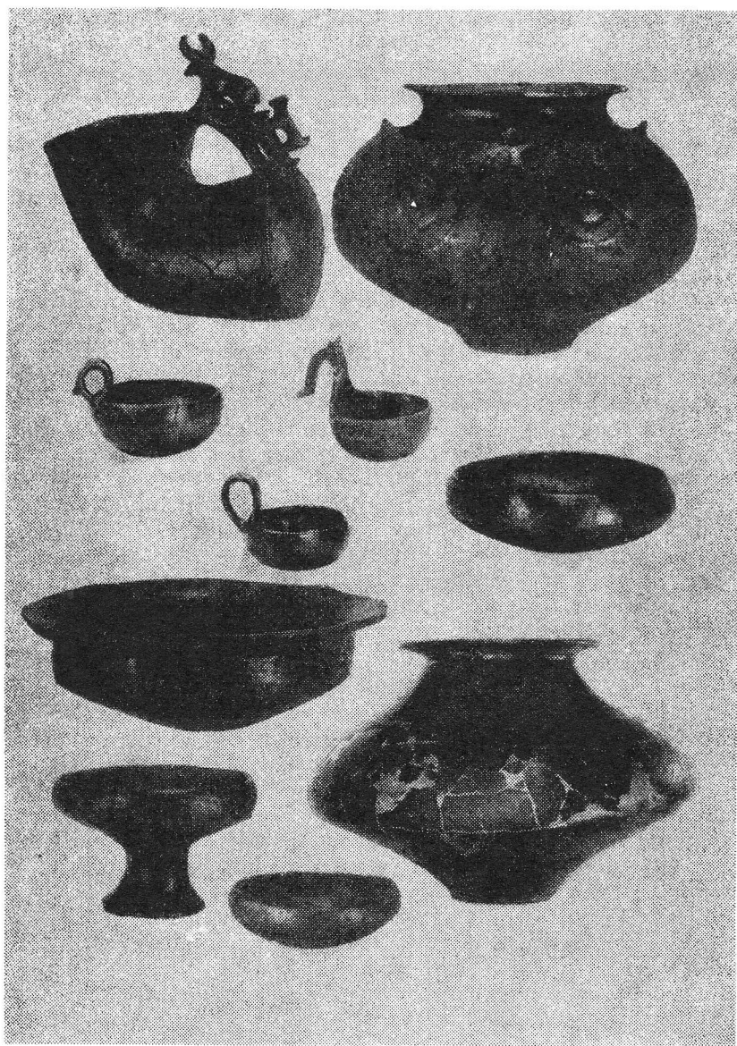
T. I — Keramički prilozi groba 12 — Goričan '82