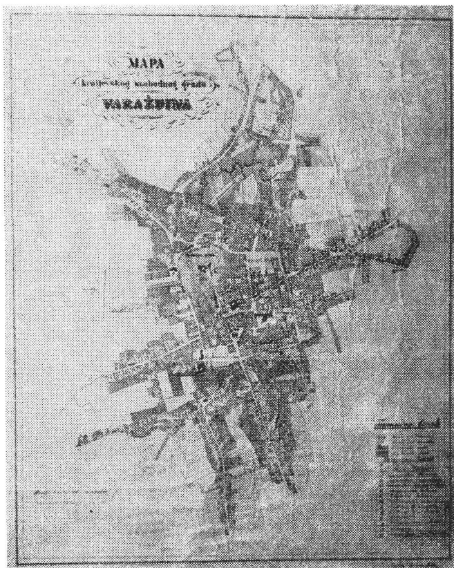
Plan Varaždina od Antona Kieswettera iz 1860. godine

planu su kosim linijama označene varoške insule i zemlje izvan gradskih zidina. Znakom križa obilježen je položaj sakralnih građevina, izuzev župne crkve svetog Nikole. Zemljišne čestice unutar varoši i u predgrađima su naznačene brojevima.